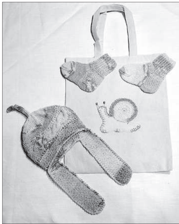
Стильные комплекты для самых маленьких.