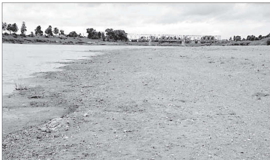
Пляж на берегу Даугавы.

тому берегу, на пути встречаются лужи и кучи мусора.