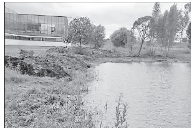
Берега водоема на Эспланаде очищаются.

Интересная новинка вскоре появится в микрорайоне химиков на берегу озера Пороховка, и, судя по описанию, подобная площадка отдыха будет в Даугавпилсе единственной. В конце прошлой недели была объявлена закупка по обустройству здесь детской площадки, главным элементом которой станет канатная дорога протяженностью 30 м. Она будет предназначена для детей старше 6-ти лет, и будет представлять собой два параллельно натянутых каната. По нижнему можно будет передвигаться, а за верхний держаться. Для детей помладше на берегу Пороховки возведут полосу препятствий из деревянных кругляков. Конкурс завершится 12 августа, и если его результаты никто не оспорит, то уникальная площадка может появиться уже октябре этого года.