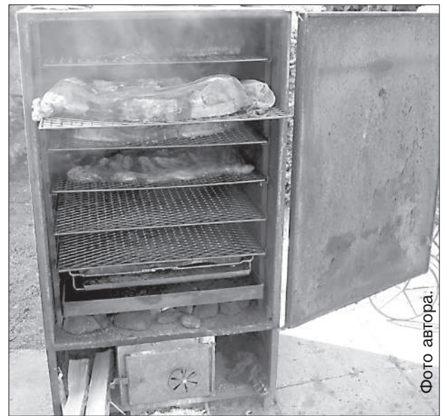
В коптильне готовится вкусный и пахучий окорок.

работу. Родители рады, что остаются жить за границей сын пока не планирует. Дочь тоже пожила погодой в Дании, но вернулась в Латвию.