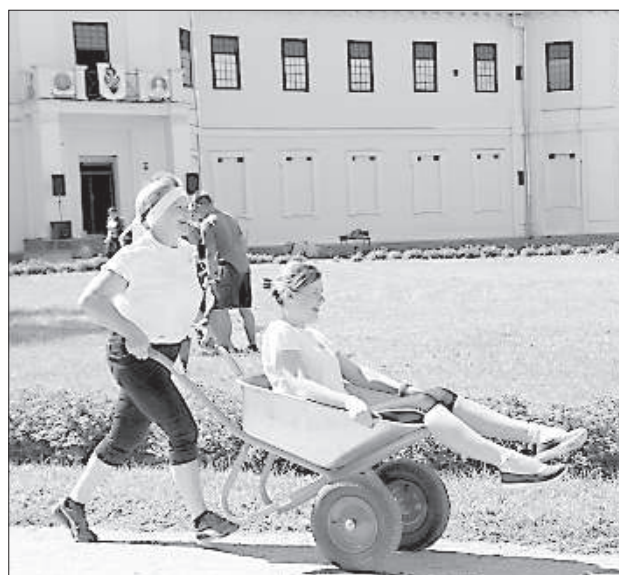
Эстафета “Посадка роз в саду замка”.