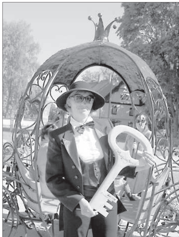
Символ соревнований ключ хранится в Краславе.