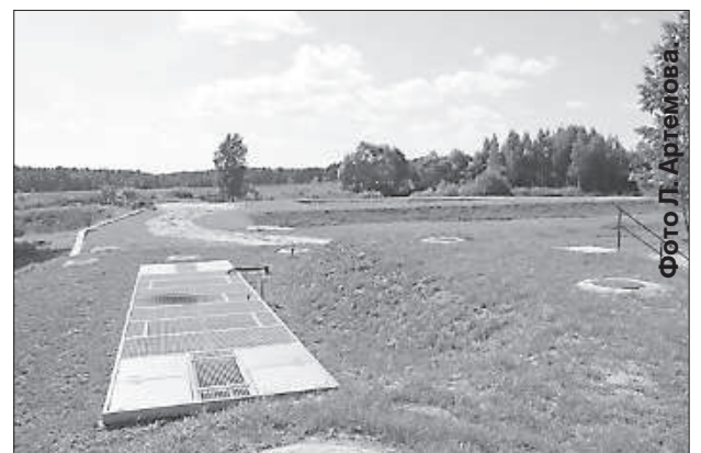
Отремонтированное оборудование по очистке сточных вод.

Также фирмы SIA "Nordserviss" и объединение "UNL-K" реконструировали сети водоснабжения на ул. Сколас, Аляс и Дарза, отремонтировали оборудование по очистке сточных вод и вспо-