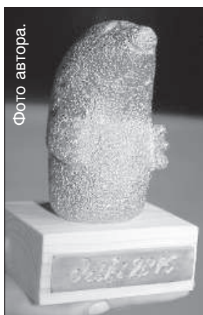
“Золотой крот” Вишкской волости.