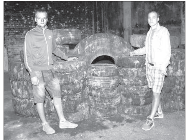
Парни создали свой пейнтбольный парк.

чать свою предпринимательскую деятельность в области деревообработки.