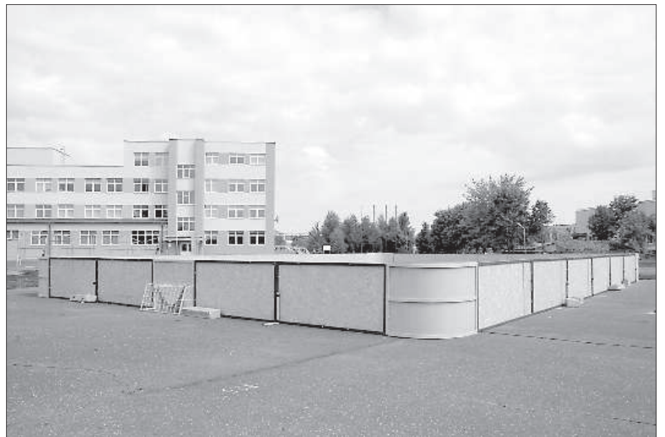
Рядом со школой оборудовано мобильное футбольное поле.