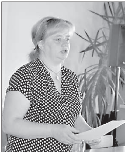
С. Дрейере поддерживает акции протеста крестьян.