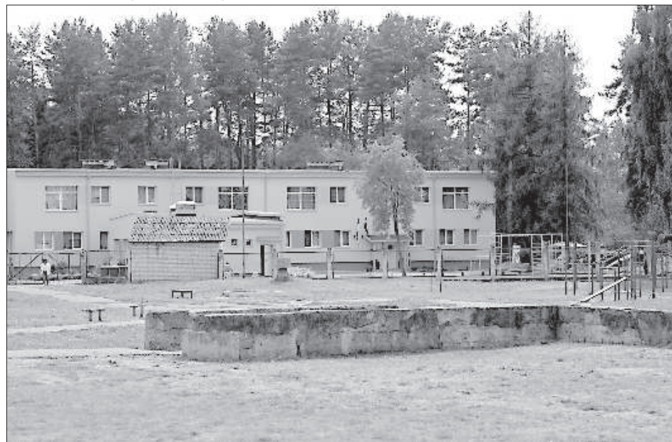
Детский сад «Крыжи».