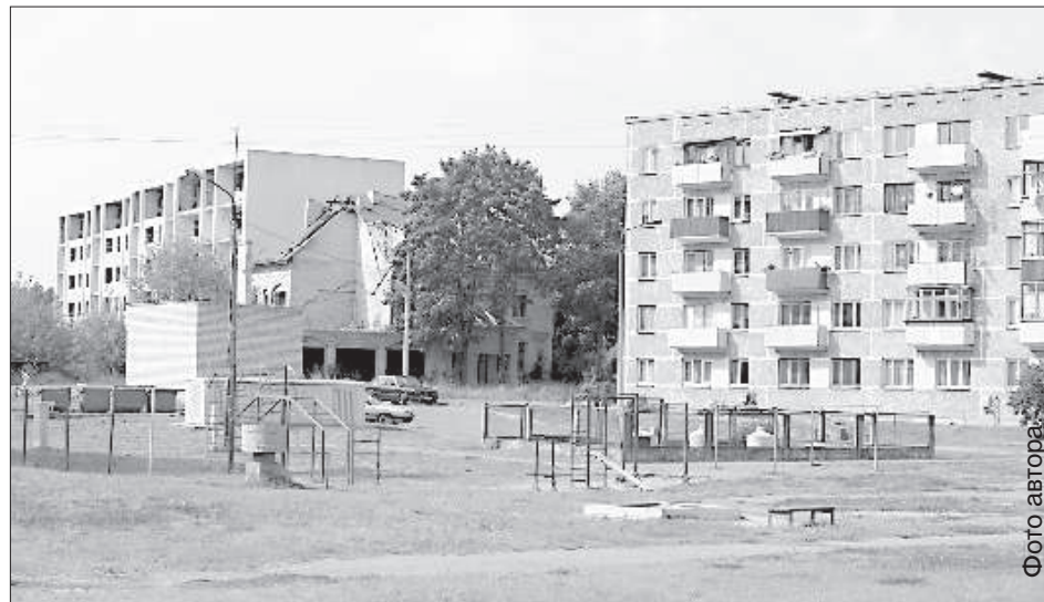
Жилое и заброшенное рядом.