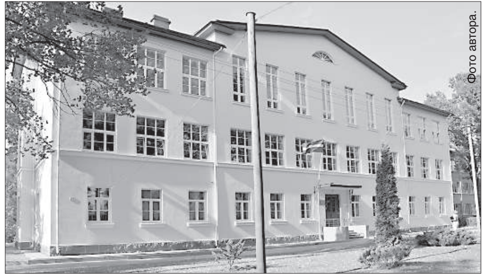
Утепленная Салиенская ср. школа.