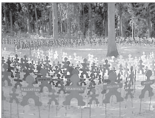
Создается лабиринт из имен.

близиться к достижению Инеты. Каждый год авторы тропы придумывают что-нибудь новое. Скоро здесь будет еще один ла-