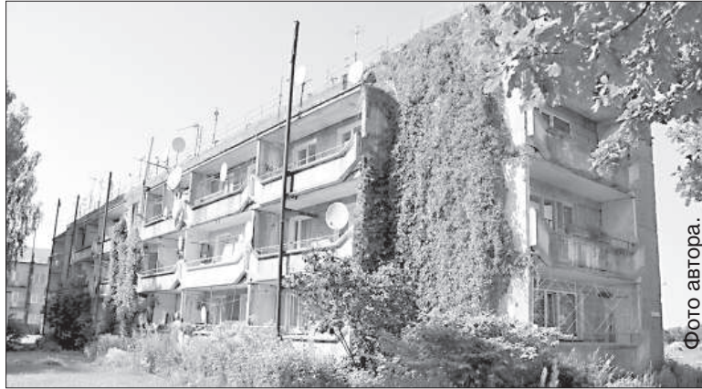
Изберут нового управляющего дому на улице Накотнес, 7 в Дубне.