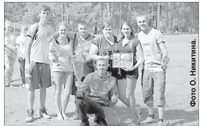
Победители слета – команда вабольской молодежи.