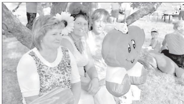
Отдых на лавочке любви.