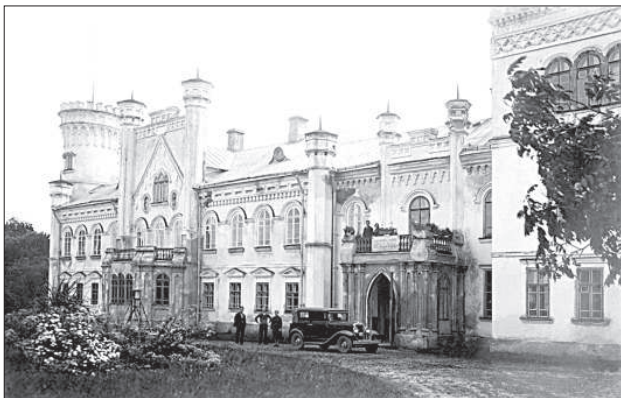
Прейльский замок на фотографии 1930 года.

Идея проекта уже представлена на получение поддержки в рамках программы охраны памятников истории и культуры Министерства культуры. Если самоуправление получит эту поддержку, на первом этаже могла бы расположиться интерактивная экспозиция, которая посетителям позволит ощутить время, когда в замке жили графы Борхи. В более далеком будущем необходимо привести в порядок систему прудов парка. ■