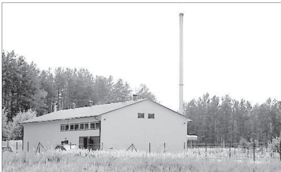
Котельная работает с осени 2009 года.