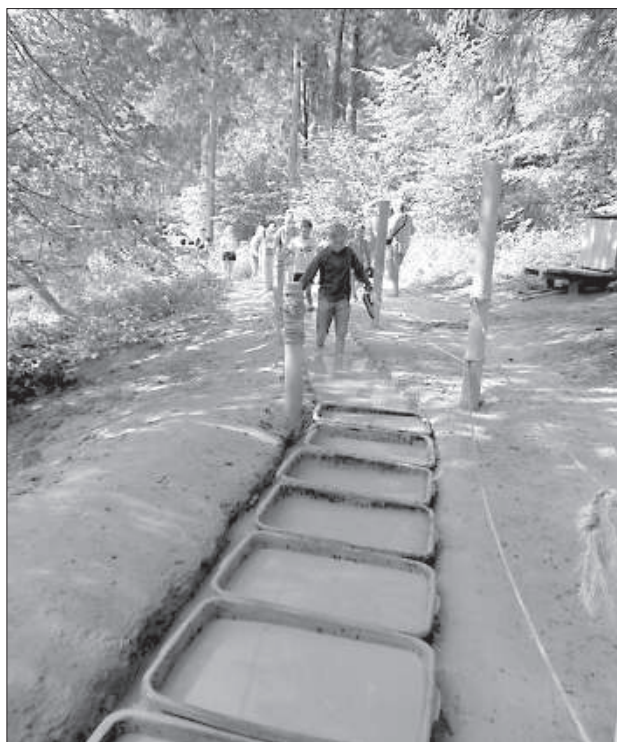
Грязевую ванну никто не пропускает.