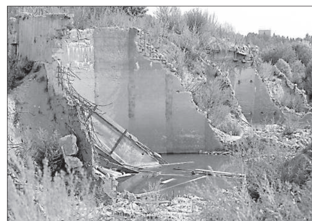
Бывшие территории мясокомбината.