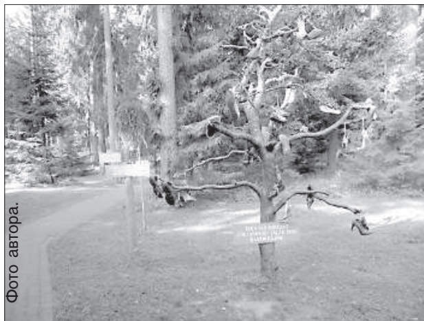
Напоминание, что обувь нужно снять и оставить на полочке.