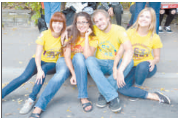
Участники из Чехии и Болгарии.