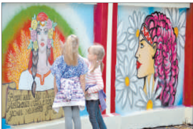
Болгарская и латвийская девушки чем-то похожи.

На открытии галереи все участники рассказали и исполнили танец дружбы. Все они за время проекта сдружились, успели погулять по Даугавпилсу, посетить крепость и Центр искусств Марка Ротко, участвовали в дискуссиях и встречах.