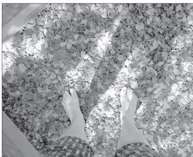
Прогулка по стеклу.