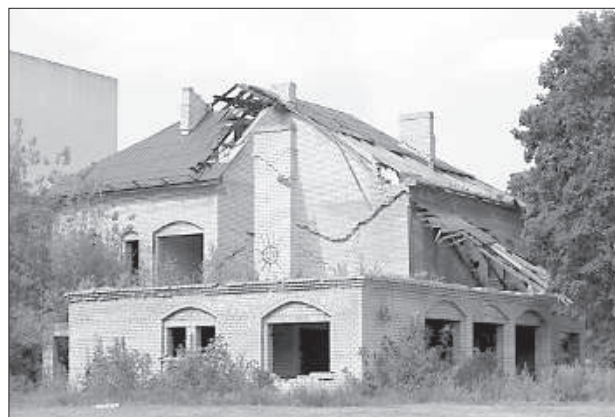
Место игр для мальчишек.

Микрорайон Крыжи (ранее Крыжовка) расположен в северной части Даугавпилса. Находится в полуизолированном состоянии. Образовался посёлок в советское время со строительством мясокомбината.