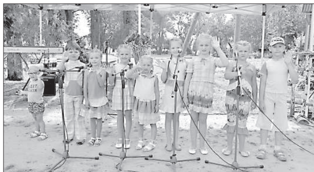
Выступление ансамбля „Varavīksne”.