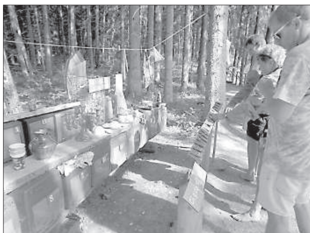
Здесь можно узнать, как долго в природе разлагается мусор, оставленный человеком.

биринт, который сформируют имена людей. Будет интересно в этой путанице найти именно свое имя.