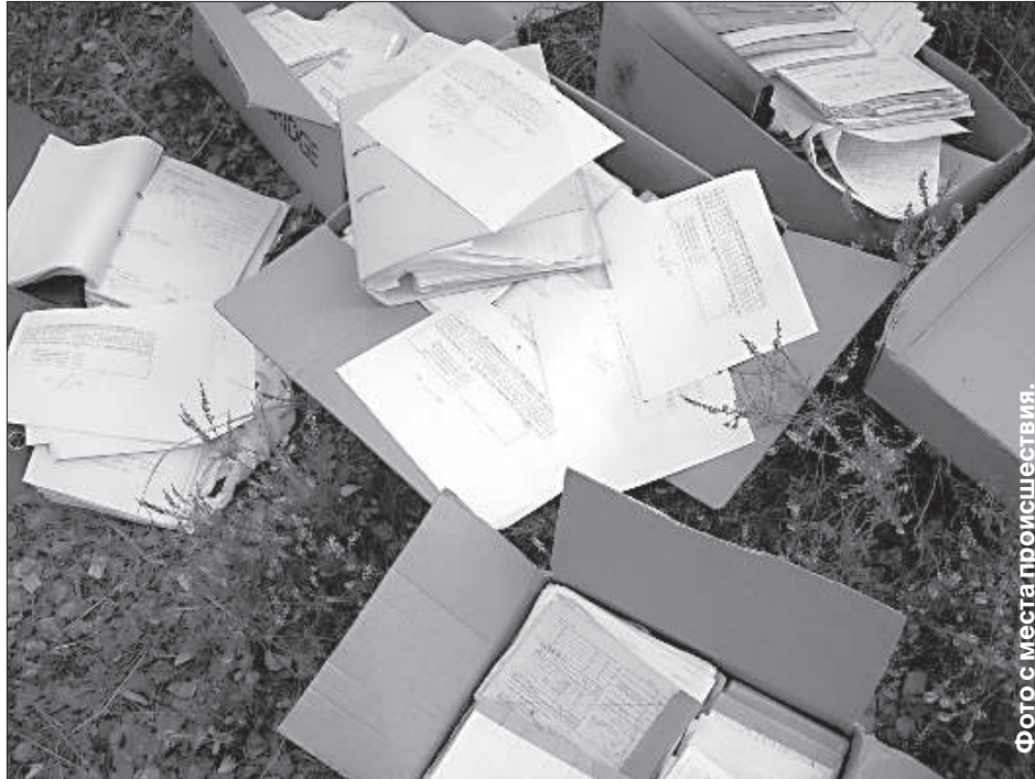
Фото с места происшествия.

ского отделения Национального центра здоровья Янис Питранс информировал, что, в соответствии с правилами кабинета министров № 76 от 5 февраля 2008 года «Положение инспекции здоровья» подпункта 3.1, одной из функций инспекции здоровья является надзор и контроль за выполнением врачебными