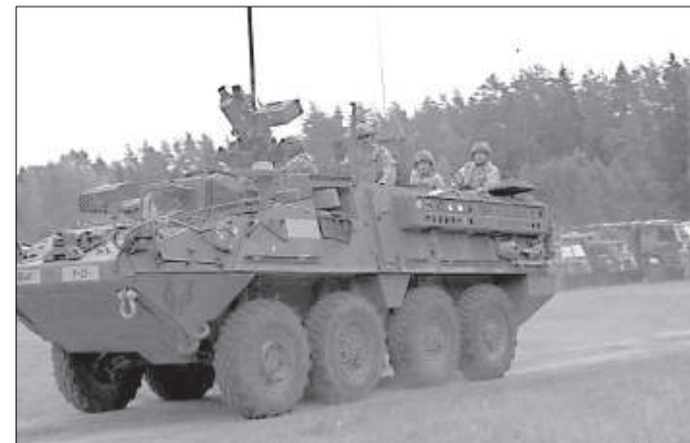
Возвращение на базу.

Своими впечатлениями поделился земессарг 32-го батальона Дагнис Тиховский, передвигающийся в колонне бронетехники: «Очень интересные учения. Появилась возможность посмотреть что-