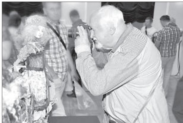
Я. Стрейчс запечатлел многих кукол в фотографии.