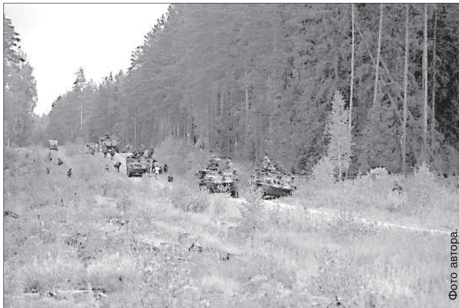
Боевые машины «Страйкер» подверглись нападению.