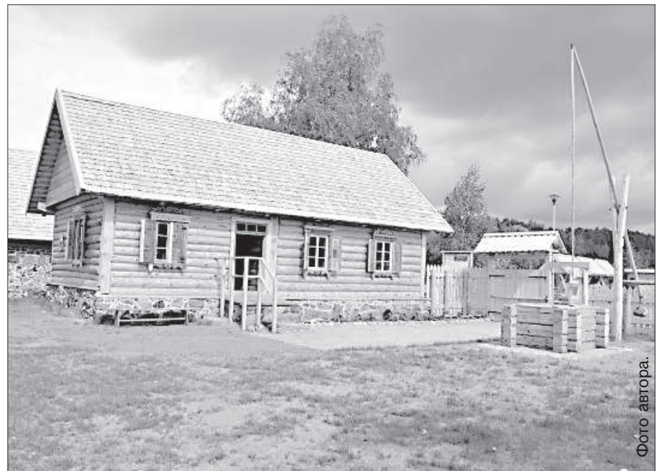
Восстановленный жилой дом.