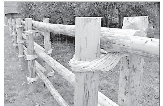
Забор внутреннего двора.