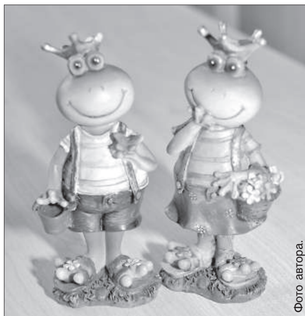
Лягушки – сказочные герои.