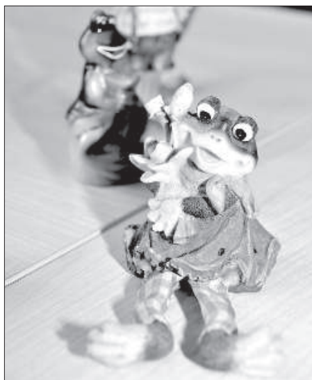
Лягушка с ногами из ткани.