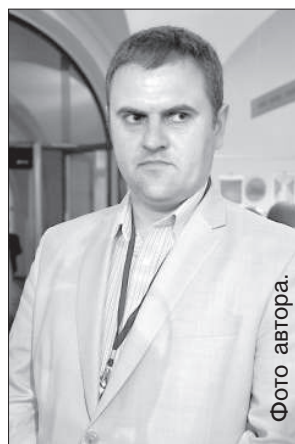
Дан Адриан Баланеску.

Второй раз Даугавпилс посетил и посол Румынии в Латвии Дан Адриан Баланеску. Он сказал, что Латвию и Румынию очень мно-