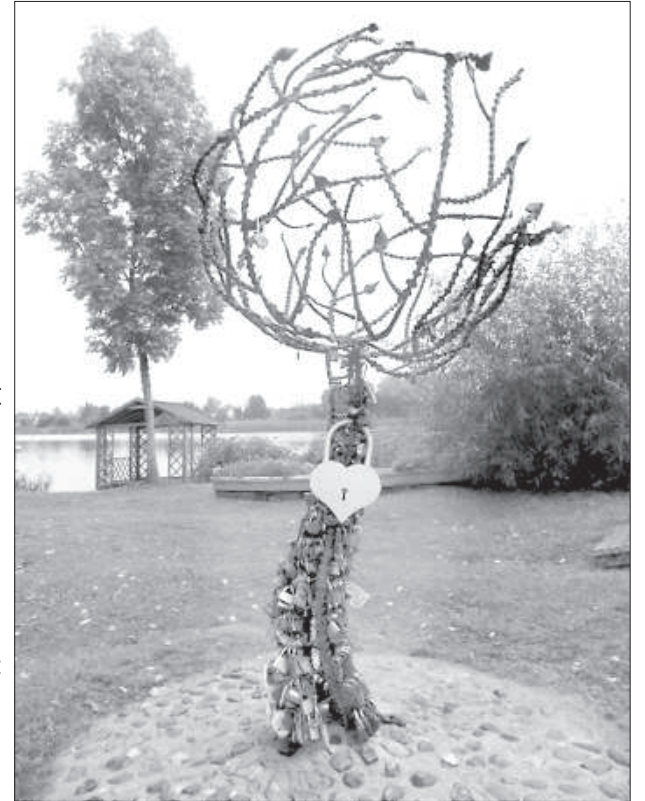
Дерево любви сделано из ключей, который раньше украшали предыдущее дерево.

Жителей Ликсненской волости поздравили руководитель Ликсненского