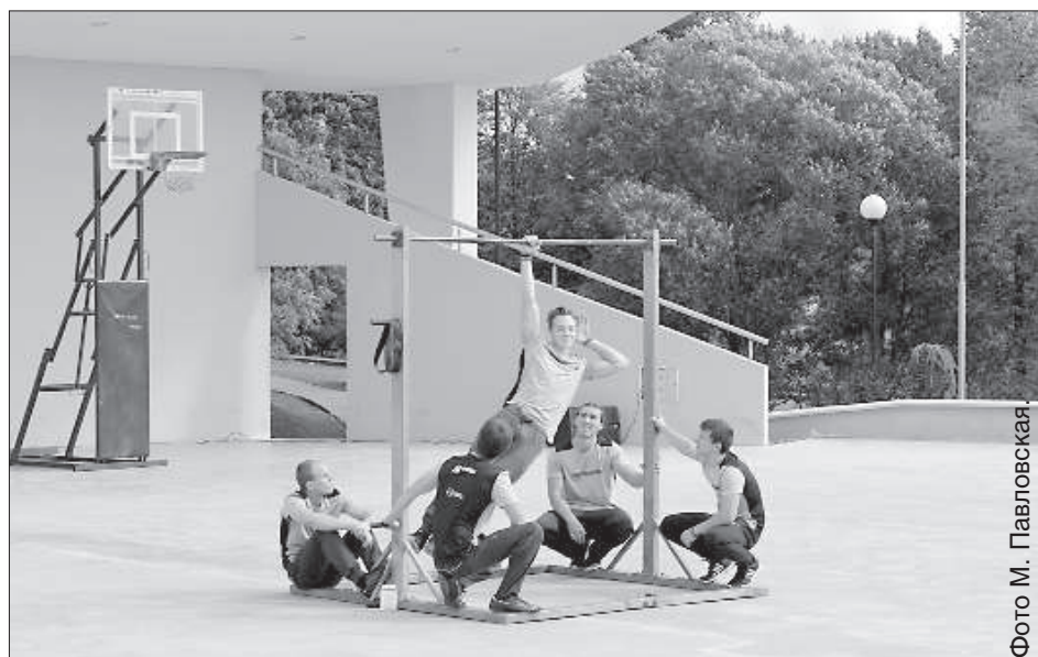
Показательные выступления уличных гимнастов.