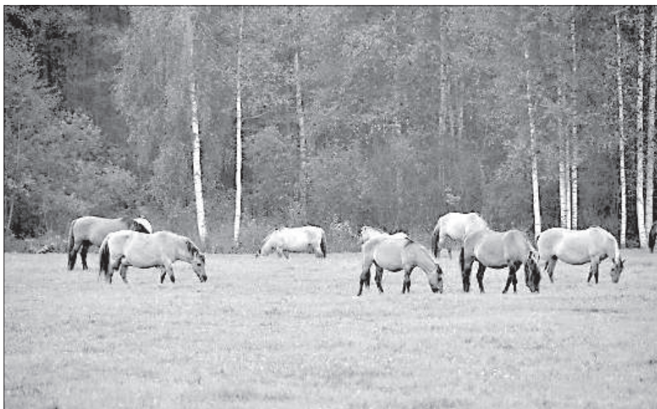
Дикие лошади на лугах поймы.