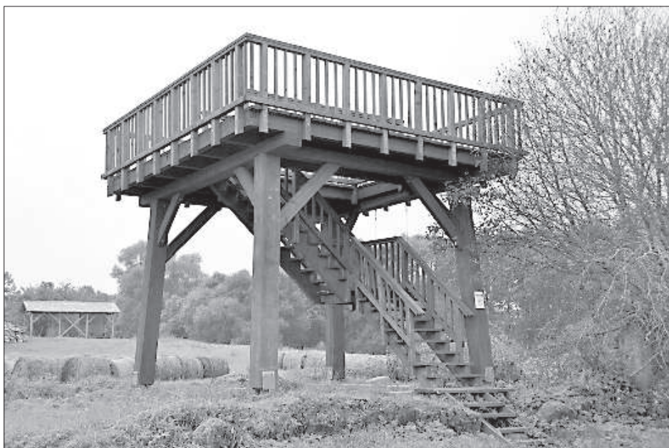
Со смотровой платформы во время весеннего паводка можно наблюдать за более чем 200 видами птиц.