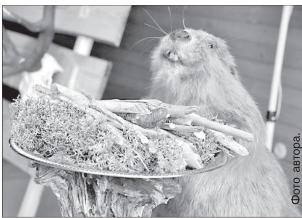
Бобр Бениты Штраусы рекламирует Бебреной волость.