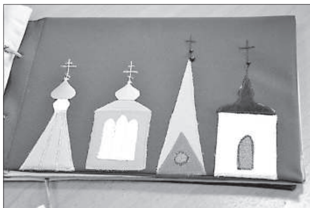
Из книги можно узнать, как выглядит храмовая горка Даугавпилса.

была создана в марте этого года с целью поддерживать даугавпилское отделение Латвийской библиотеки незрячих, оказывать поддержку людям с особыми потребностями, организовывать их досуг. Название символично, оно отсылает к шрифту Брайля. Сейчас в обществе 14 человек, и к нему присоединяются новые участники. Общество уже провело в библиотеке выставку тряпичных кукол, которая вызвала здесь настоящий ажиотаж, в ближайших планах – поездка по местам Райниса, а в 2016 году «Братство точек» собирается работать над созданием Сада ощущений и организовывать клуб любителей бардовской песни.