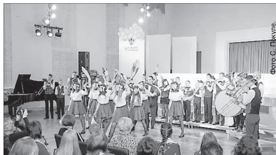
Выступает диксиленд и группа поддержки 13-й ср. школы.

"Я заметила, что хоровое пение закрепляет в детях знание латышского языка и прумножает патриотизм. С помощью этого концерта мы продолжаем традицию школьных хоров петь вместе. Хоры уже устраи-