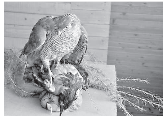
Ястреб терзает ворону.

что выставка — это подтверждение уважения к пойманному животному. "К сожалению, не все охотники достаточно активно участвуют в выставках трофеев. Но участвовать нужно! По ТВ и в газетах об охоте рассказывают много негативного, но не