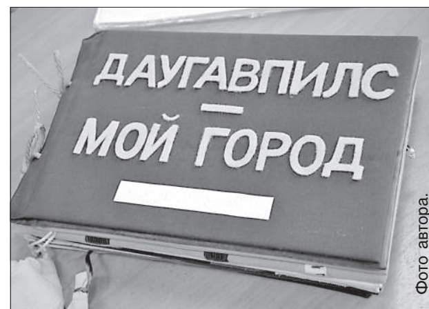
Тактильная книга для слабовидящих и незрячих людей.