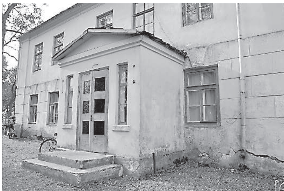
Пожертвования помогут восстановить старинное здание усадьбы.

охозяйствованию популяции парнокопытных 22 октября, а также бала 30 октября будем просить средства на ремонт здания. Спасибо тем, кто поддержал выставку трофеев — охотничьим обществам "Piekūns", "Kalupe", "Ambeļi", "Dviete", "Dunava",