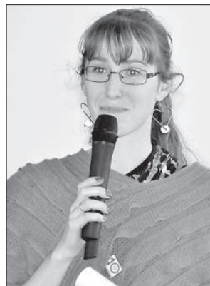
Лига Моркане участвовала в создании газеты «Zinu. Varu. Daru.»