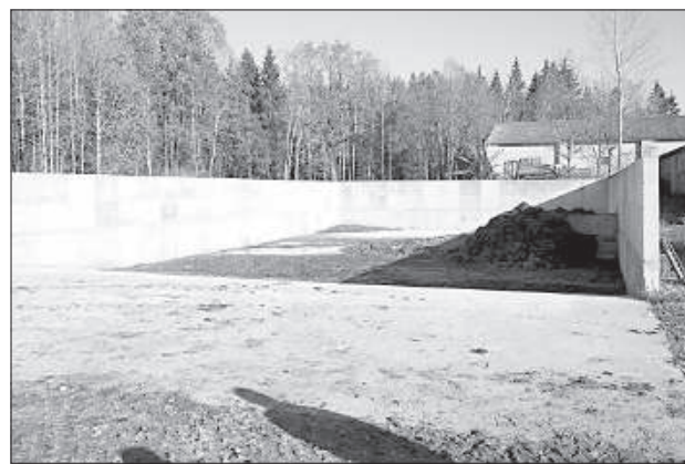
Новое хранилище для навоза.

— Проектов написано было немало, даже сложно вспомнить, сколько было, а требования с каждым годом растут. С самого начала легко не было. Пока переходный период — готовим бумаги. Когда он завершится, будем планировать, что делать дальше.