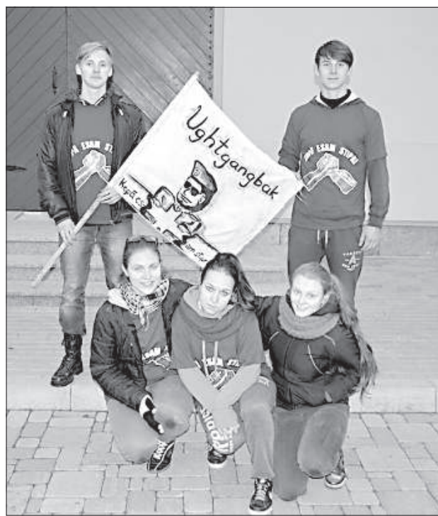
Победители даугавпилского этапа — команда польской гимназии «Ughtgangbak».

морское путешествие от «Tallink» в Стокгольм выиграла команда Даугавпилской польской гимназии «Ughtgangbak», которая участвовала в игре уже второй год. Под руко-