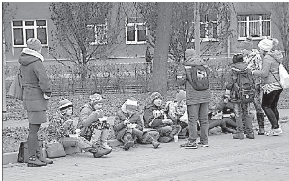
Горячая каша на свежем воздухе вкуснее родительской утренней манки.

Образы Рембо и Арнольда Шварценеггера из фильма «Хищник» прочно вошли в сознание не одного поколения мальчишек. Однако вживую взять оружие, как герои кинофильмов, в реальности оказывается не так просто. У большинства пулемёт болтало так, как будто на улице шторм. Попытки прихватить два «ствола» и сделать боевую стойку с изобретением стрельбы из двух рук наглядно продемонстрировало, что только