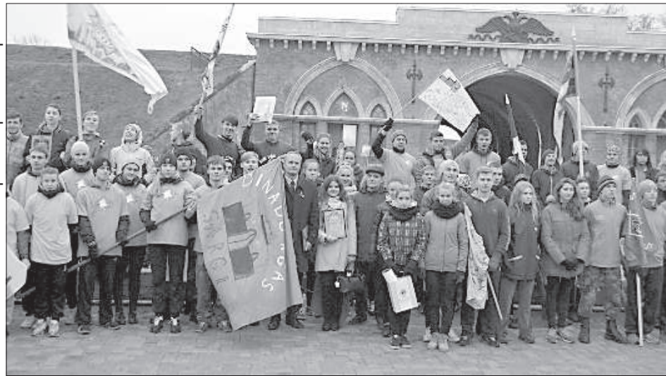
Команда 12-й ср. школы «Dinaburgas sargi» (слева) будет участвовать в финале.