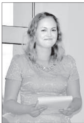
Лига Лиепиня активно работает в центре.