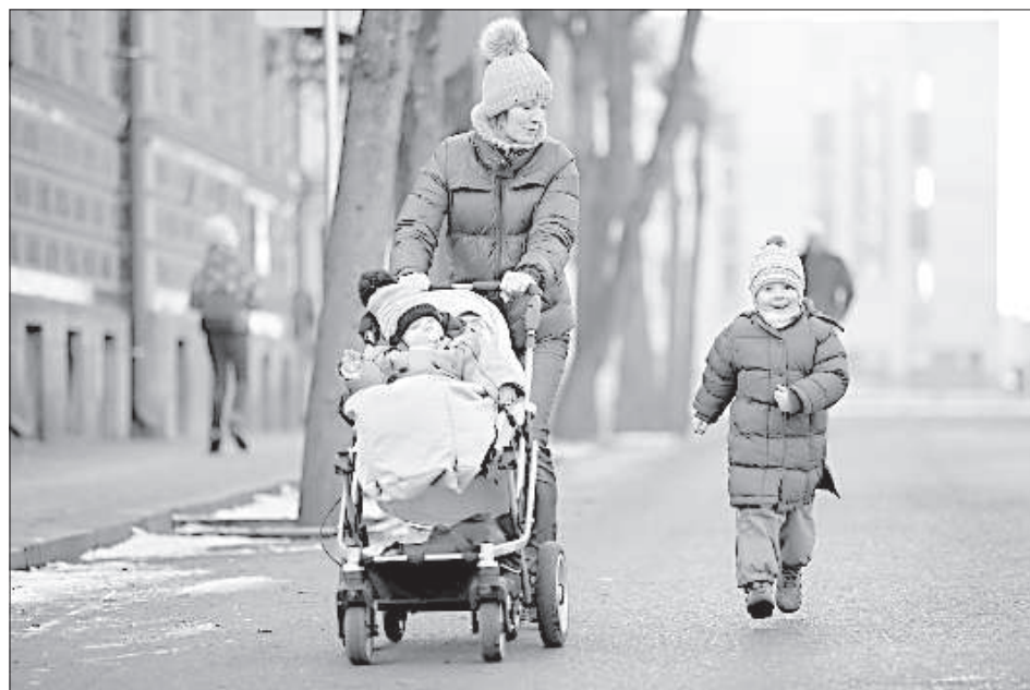
Пробежка за компанию.

Погода для бодрящей пробежки благоприятствовала. Лёгкий морозец разогнал осеннюю хмурию, хотя кого-то, воз-