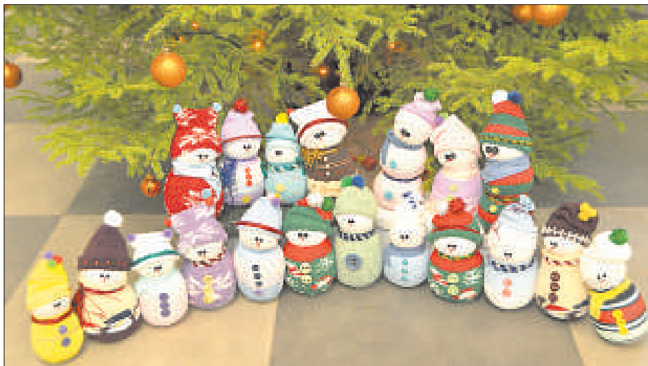
Снеговики расселись под елочкой.