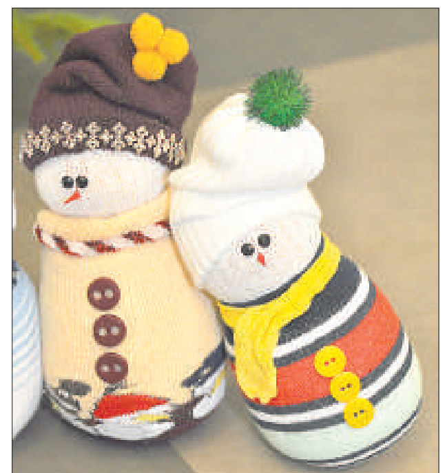
У каждого снеговика свое настроение.