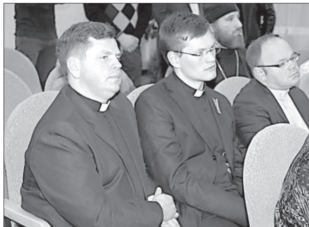
В презентации книги участвовали представители духовенства.

лет назад территориальную реформу, авторы книги проводили исследование в пределах границ бывших исторических районов. «Краславский район не только красивый и легко воспринимаемый, но и очень важен с исторической точки зрения, потому что здесь сохранилась единственная в Латвии деревянная церковь 17-го века — построенный графом Плятером деревянный костел в Индрице. Здесь есть прекрасные памятники архитектуры барокко, например, Краславский костел, который в свое время строился как Латгальский собор. Из храмов стиля барокко очень ценен Пиедруйский костел на берегу Даугавы, он особенный и принадлежит к позднему барокко или к стилю рококо. Он приближен к высокосортным строениям, какие были в древних польских землях. Третье строение эпохи барокко — Дагдский костел, который, так же, как и Краславский костел, строил один из итальян-