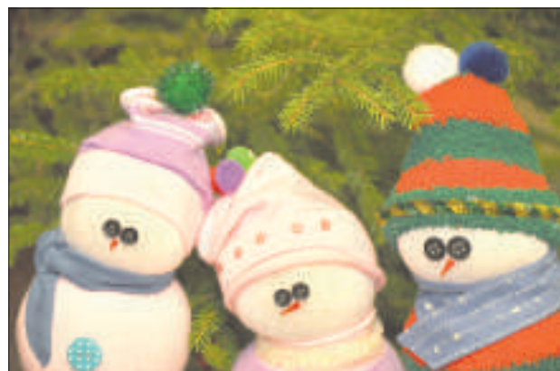
Маленькие пуговицы могут стать выразительными глазами.