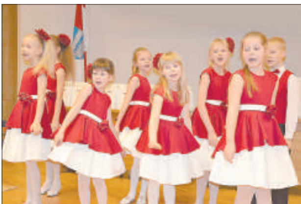
Выступает средняя группа коллектива «Vālodzīte».