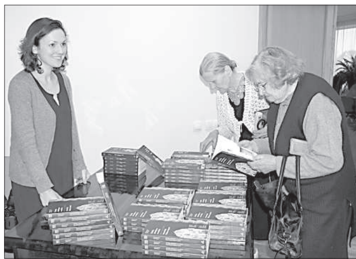
Присутствующие могли приобрести новое издание.

жизни, и опыт, говорит автор книги. Работу осложняло то, что не хватало документов, их приходилось искать в других странах, но многих фактов вообще нет, поскольку проводимые работы и ремонты не документировались. Сложнее всего было со староверскими и православными храмами, которые много где были разграблены, старинные иконы утеряны, и ничего нельзя было изменить к лучшему. Этот процесс начался еще в советское время, когда не было почтения к сакральному наследию, а было стремление к материальным вещам. Негативным последствием советского времени было также стремление