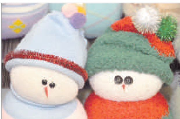
Голова у куклы подвижна.