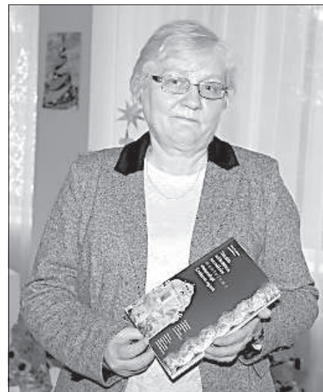
Автор книги Рута Каминская.