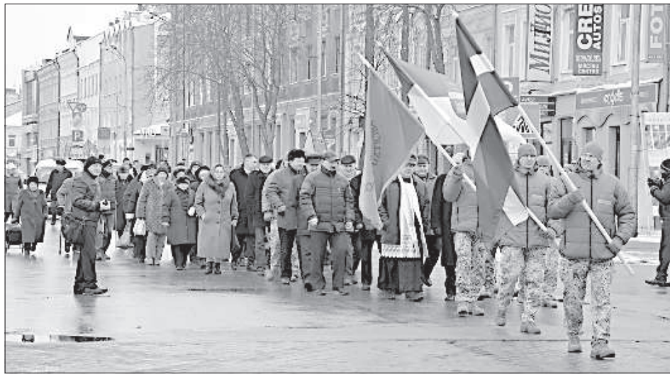
Шествие от собора до площади Виенибас.

В контексте мировой истории срок в 25 лет слишком маленький срок, но для Латвии этот отрезок времени стал судьбоносным. Участники памятного мероприятия в честь 25-й годовщины баррикад и сегодня часто думают о том, как жила бы Латвия, если бы тогда события разворачивались иначе. «Никто не знал, чем все закончит-