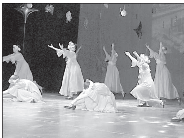
Выступление ансамбля «Ивушка».

Праздник начался с «разогревающего» концерта на втором этаже дворца, зрители в это время могли угоститься перед основным концертом чаем и пирожками с капустой и повидлом. Концертная программа фольклорного праздника была посвящена зимней тематике. ■