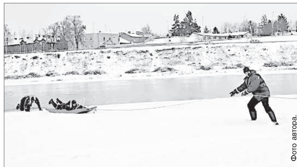
С помощью веревок и доски людей вытаскивают на лед.

ратуру до -40 градусов, он себя чувствует как в бане. Костюм изнутри нагревается до температуры человеческого тела. «Если человек зимой попадает в воду, он продержится 5-10 минут. Не нужно впадать в панику, это отнимет энергию, нужно звать на помощь и пытаться удержаться на поверхности воды. Проходим, которые видят тонущего, нужно позвонить по номеру 112 или нам и дожидаться спасателей, а не лезть самим в воду. И не снимайте на телефоны! К сожалению, сейчас в моде делать это даже тогда, когда произошло несчастие. Если человек упадет в Даугаву