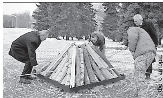
В память о защитниках баррикад зажигают костер.

Своих земляков латгальцы поддерживали и на мес-