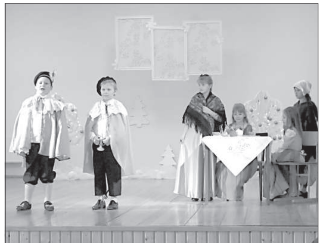
Дети показали сказку о Золушке.

В Бикерниежской волости проживает много староверов, поэтому неудивительно, что старшее поколение чтит и соблюдает свои старинные традиции.