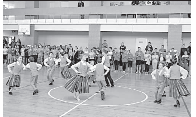
Выступают маленькие танцоры Свентской волости.

16 января в Свентской средней школе народные коллективы Даугавпилсского края провели день спорта и танцев «Зимние радости-2016».