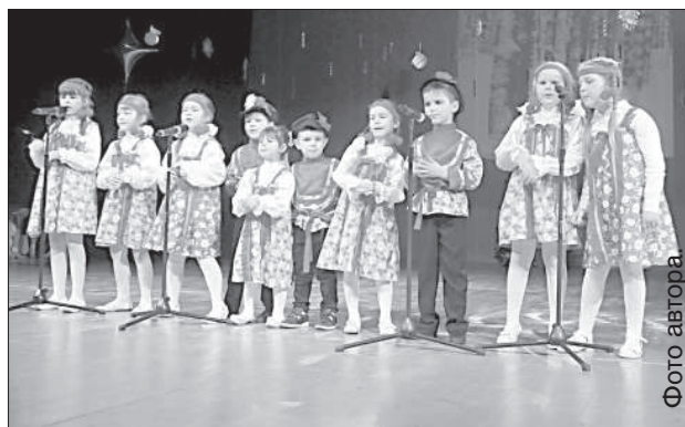
Юные артисты из ансамбля «Русские карагоды».

Выступить в Даугавпилсе приехали ансамбль народ-