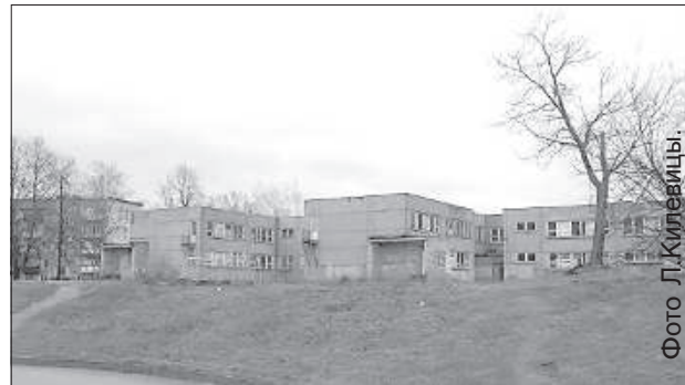
В помещениях бывшего детского сада может разместиться поликлиника.

В ходе окончательного обсуждения бюджета Даугавпилса на 2016 год председатель городской думы Янис Лачплесис сообщил, что у самоуправления есть идея в микрорайоне Новый Форштадт открыть поликлинику.