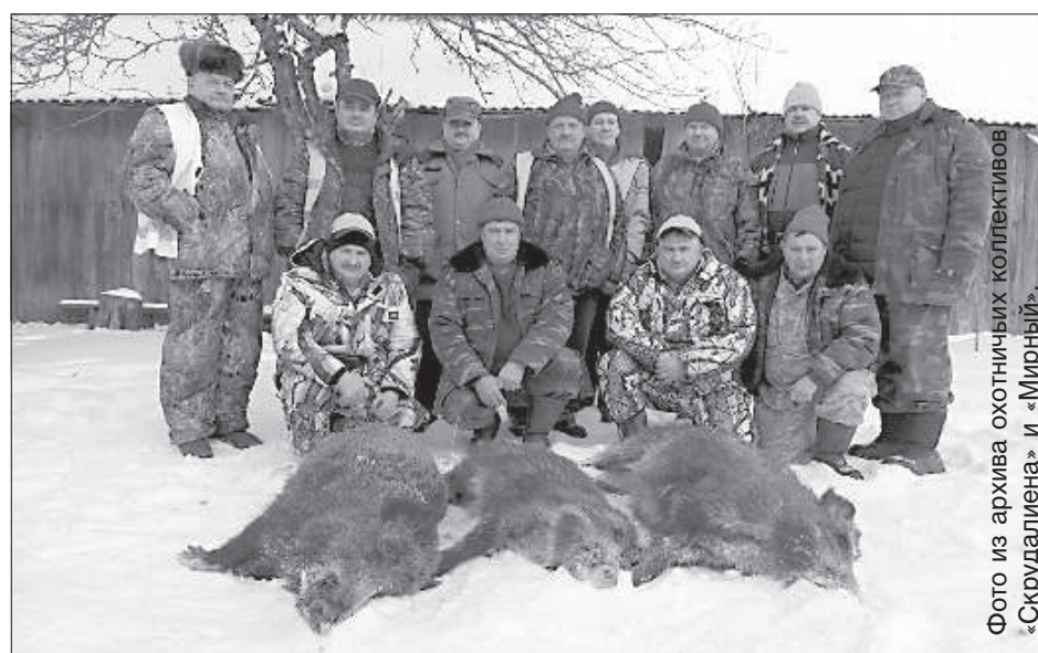
Три кабана за одну охоту – большая удача.