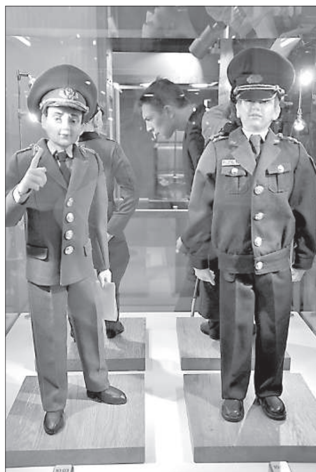
Советский милиционер и латвийский полицейский предупреждают.

В пока еще закрытый для посетителей музей шмаковки депутаты Даугавпилсской городской думы пошли, чтобы убедиться, что планируемая цена билета соответствует предложению. На экскурсию они позвали и журналистов.