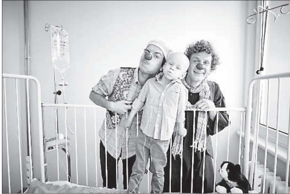
Доктора-клоуны уже 3 года успешно работают в больницах Латвии.