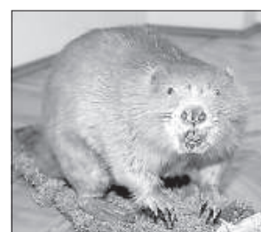
На выставке можно было осмотреть и чучела животных.