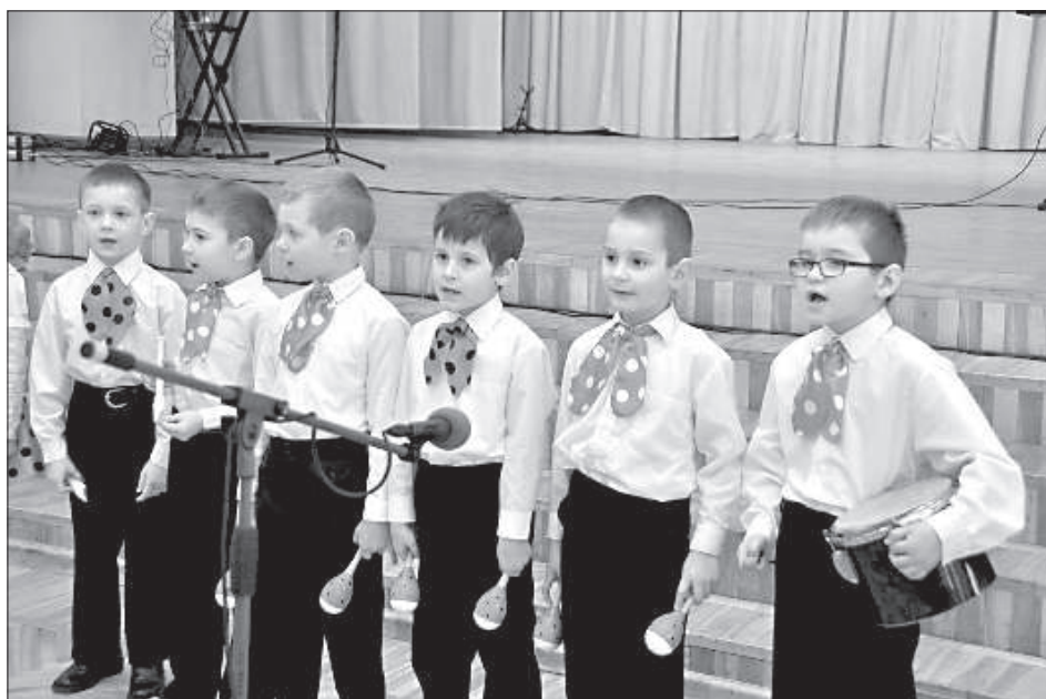
Воспитанники детского сада «Званиньш» приветствуют бабушек и дедушек.

за разговорами, пили чай и танцевали на балу под аккомпанемент группы «Двинские музыканты». ■