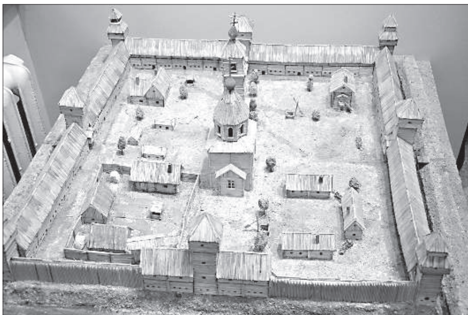
Макет Симбирского кремля.