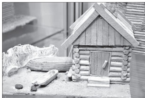
Дом рыбака, 2009 год.