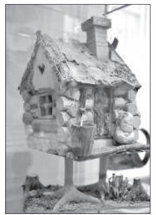
Избушка на курьих ножках.