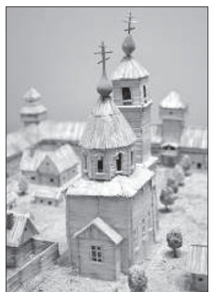
Макет деревянной церкви.