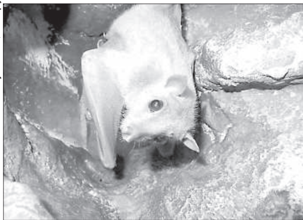
Египетских летающих собак можно осмотреть в Латгальском зоосаде.