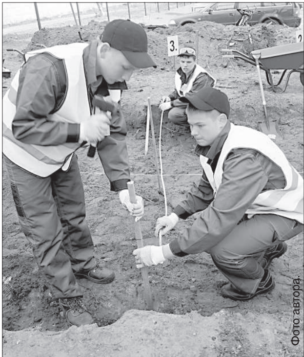
Будущие строители из Даугавпилса делают дорожку.

Сама дорожка полностью не была уложена: ее планируется закончить на занятиях силами самих воспитанников.