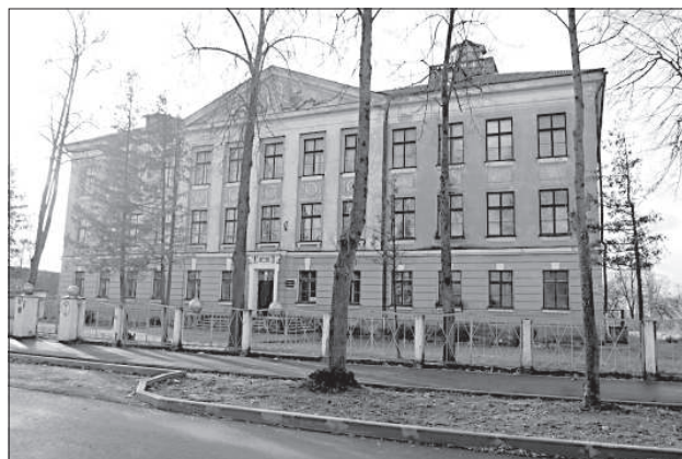
Здание Даугавпилсской основной школы № 8 давно опустело.