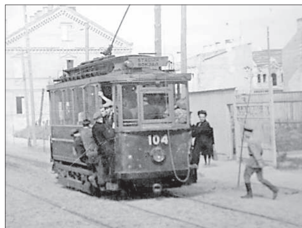
Трамвай на ул. 5 августа (теперь Виенибас), конец 40-х годов.

Гости вагона ведут себя прилично, не шумят, даже если и выпивают. «Только курить нельзя!» – предупреждает водитель, который следит за порядком в вагоне. В трамваях отмечают дни рождения, выпускные, последние звонки и даже свадьбы.