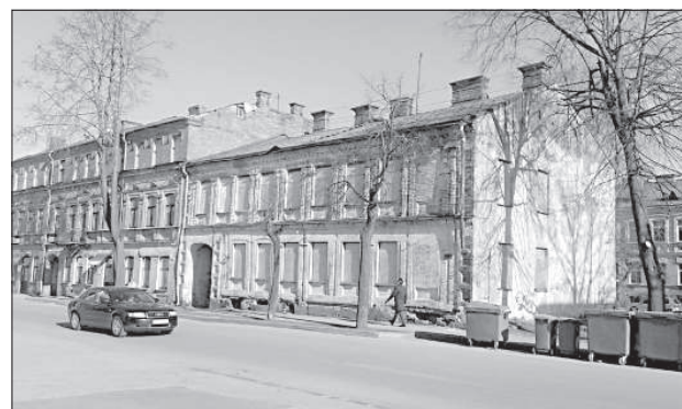
Владелец здания на ул. Сакню намерен заниматься своей недвижимостью.