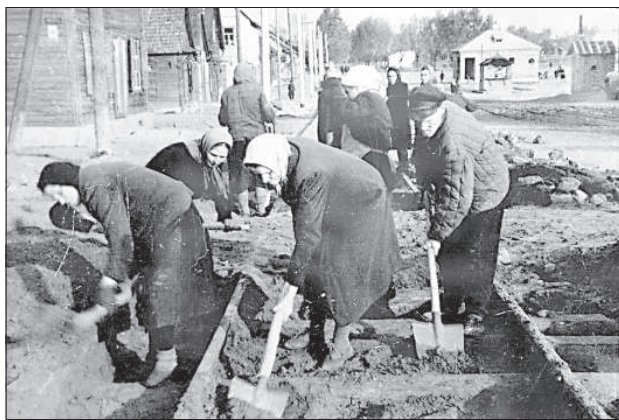
Строительство трамвайной линии в 1947 году.

праздниками и экскурсиями на «борту». Ретро-вагон чаще заказывают иностранцы или школы из разных уголков Латгалии, а новый вагон пользуется популярностью у местных жителей. В последнее