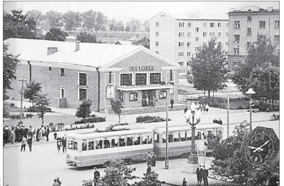
Трамвай на площади Виенибас, 70-е годы.

время заказов от школ особенно много. Чаще всего в трамваях отмечают девичники и мальчишники, говорит Гунар. Поездка длительно в час проходит весело, с музыкой и танцами.