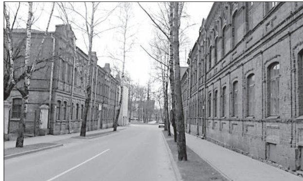
На ул. Института пустые здания смотрят друг на друга.

тех, которые построены из красного кирпича, архитектурного достояния города, которому в 2009 году был посвящен календарь городского самоуправления. «Приверженцами этого стиля были многие выдающиеся архитекторы. В Даугавпилсе данный подвид эклектики шире всего представлен в зданиях, спроектированных архитектором немецкого происхождения Вильгельмом Нейманом, который с 1878 по 1895 год был главным архитектором города», — говорится на сайте Центра туристической информации. «Ярким примером кирпичной архитектуры являются здания на ул. Саулес, 1/3», — отмечается в информации для туристов. Большое красивое здание, занимающее целый квартал в исторической части города, сегодня, увы, пустует, а еще несколько лет назад здесь была научная библиотека Даугавпилсского университета. На здании есть табличка, сообщающая о том, что в 1944-1945 годах здесь на-