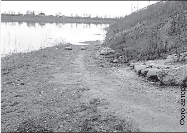
Берег Даугавы в арке недавно был очищен от гор мусора, но здесь снова бьют бутылки.

Коммунальное управление Даугавпилсской городской думы 13 апреля начало прием заявок на участие в Большой толоке, которая в этом году пройдет 23 апреля.