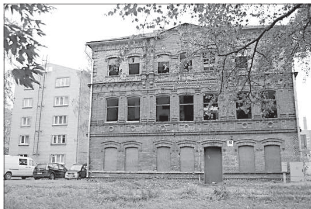
Здание по ул. 18 ноября, 96.

Среди опустевших зданий Даугавпилса немало