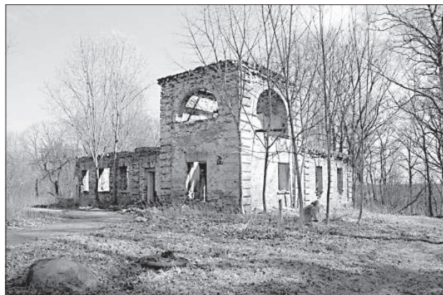
Разрушенное здание усадьбы.

Метрах в ста от края обрыва на пригорке находится 5-этажный жилой дом. С трудом верится, что берег опадет настолько далеко, но на территории парка в так называемом «Шанхае» частная застройка находится намного ближе к краю обрыва. К счастью, в последние 2 года больше нет таких паводков, которые вместе с повышением уровня воды вымывают уже и так нестабильный берег.