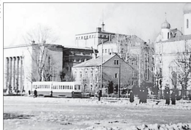
И городской пейзаж, и облик трамвая изменились.