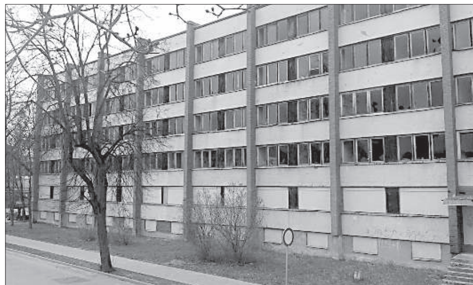
Бывшее общежитие давно портит облик города.