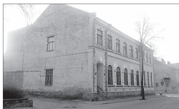
Здание бывшей почты продано фирме.

этих зданий, чтобы развивать в них какие-либо проекты», — сообщил он.