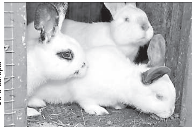
В «Индини» также разводят и кроликов.