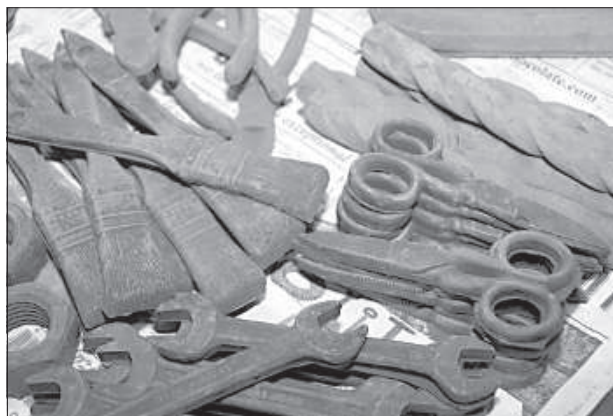
Шоколадные инструменты – хороший подарок настоящему мастеру.

нишу. Продукция предприятия – 100% естественное удобрение, на основе которого приготавливается почвенный субстрат. Для саженцев предлагается универсальная биоземля, которую Каспар назвал продуктом для горожан, пото-