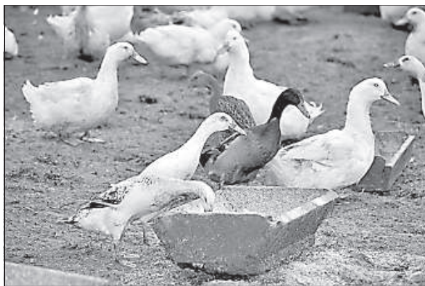
Индийские беговые утки и пекинские утки.