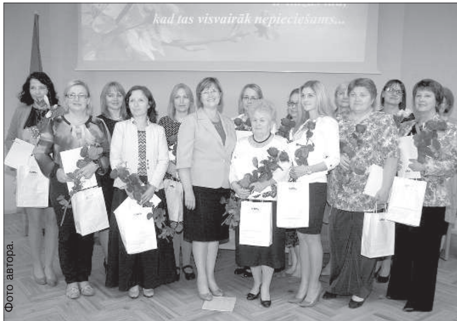
Учителей наградили за достижения воспитанников.

С музыкальным приветствием выступили доценты и студенты факультета музыки и искусств Даугавпилсского университета.