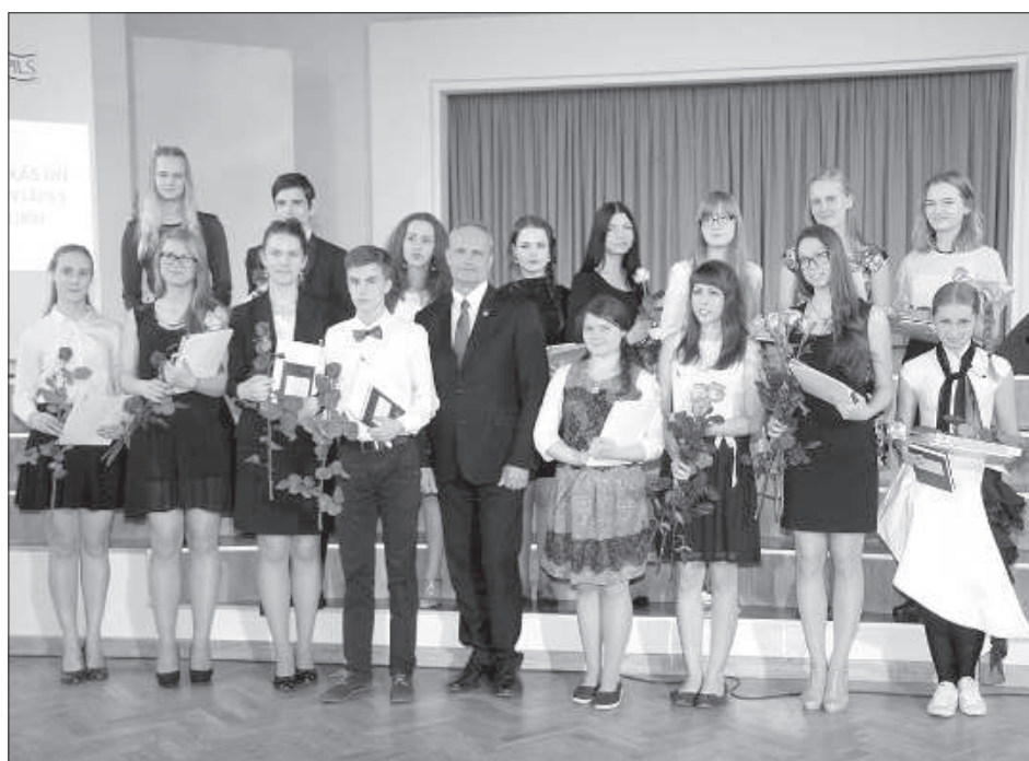
Школьников чествуют за успехи в учебном году.