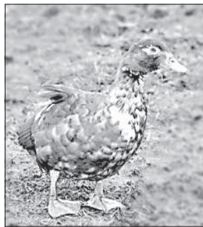
Мускусную утку нужно веса растят 2-2,5 месяца.

Друзья и соседи, узнав, что Рита и Каспарс занимаются птицеводством, стали спрашивать, особенно перед Рождеством, можно ли купить мясо утки или кур. Об этом ста-