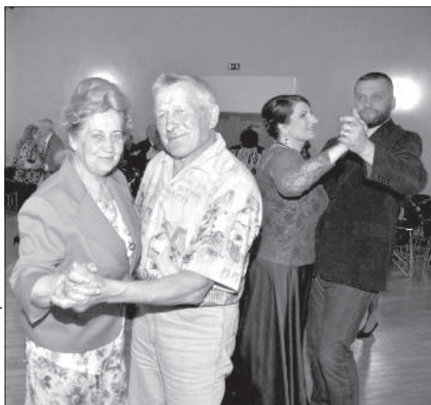
Супруги Аудзери разногласия сглаживают юмором.