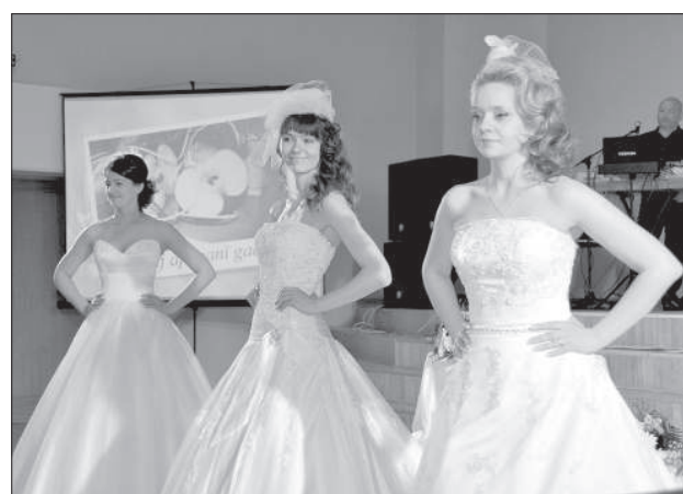
Парад свадебных платьев.