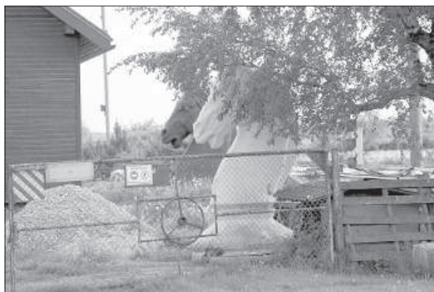
«Кони» во дворе.

Поселок жил и развивался за счет ферм, а потом все закончилось. Народу становится меньше, а на фоне летнего зноя и заброшенных построек