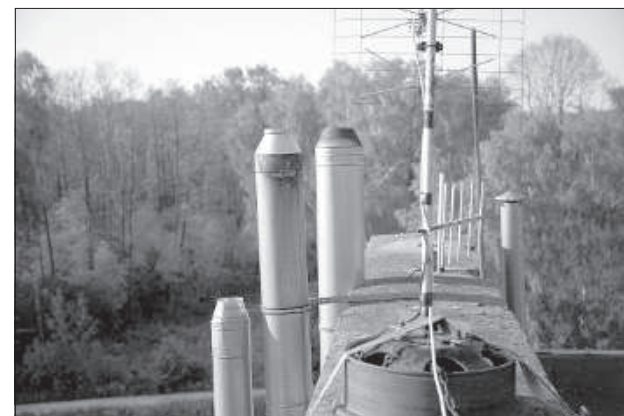
Жители активно переходят на печное отопление.

честно отработывала свой хлеб, хозяин не вышел, и пришлось уйти с множеством вопросов в голове.