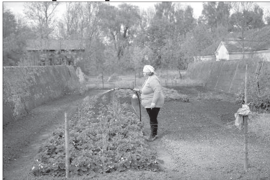
Полив клубники в секции силосной ямы.

В тихих захолустных местах необычные вещи особенно бросаются в глаза. В одном дворе стоят две шахматные фигуры метра два в высоту: кони черный и белый. Собака