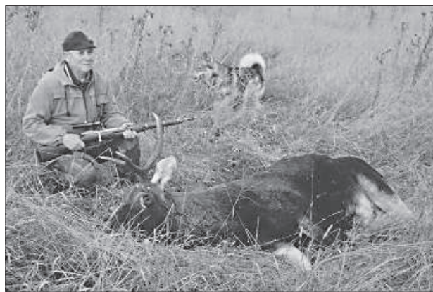
Охота много лет была увлечением.