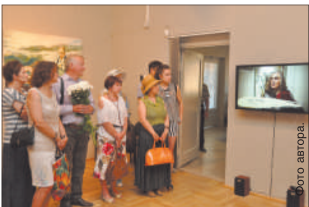
Монитор создает иллюзию присутствия художницы.