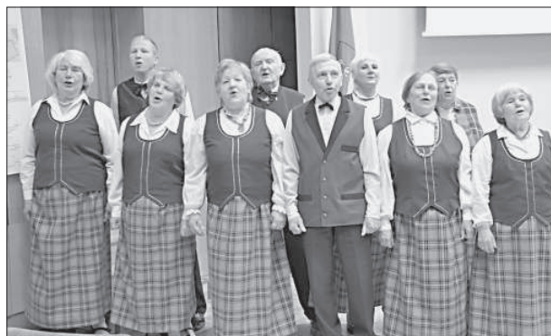
Ансамбль «Цериба» дневного центра поет о Даугавпилсе.

уже произведен перерасчет 90% пенсий, которые будут выплачиваться с августа. Речь идет о пенсиях, начисленных в 2010 году, подчеркнула Д. Рациня, и пенсионерам следует учесть, что четверть упомянутых пенсий не уве-