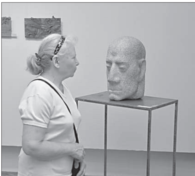
На выставке есть скульптурные работы.