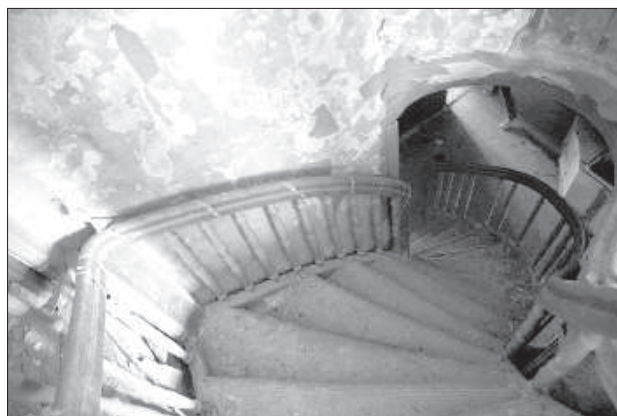
Внутри здания школы.

В трех многоэтажных домах большинство квартир обжились персональным печным отоплением. Дымоходы, как органые