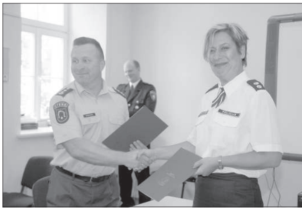
Государственный колледж полиции подписал договор с главным комиссариатом утенской полиции.