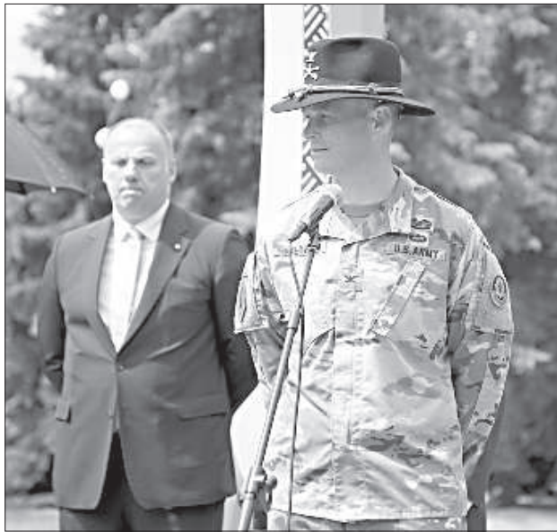
Командующий вторым кавалерийским полком полковник Джон Мейер.

Первый марш «Draagoon Ride» проходил в марте 2015 года, когда второй кавалерийский полк в рамках