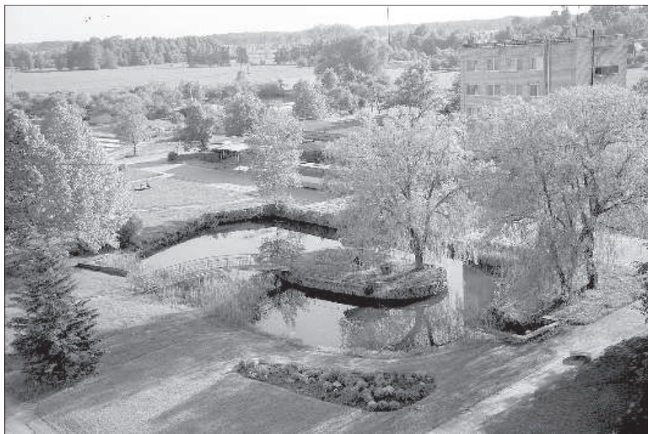
Вид на поселок сверху.

Депрессия, безработица, всеобщая заброшенность – это ассоциативный ряд в первую очередь связывают с латгальской глубинкой. Однако заблуждение, что периферия Латгалии является воплощением социальных и экономических проблем, развеивается после посещения любого другого дальнего уголка Латвии.