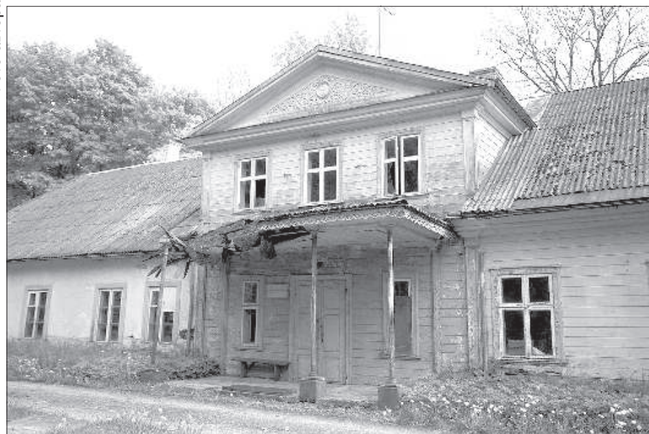
Охотничий домик графа П. фон дер Палена.