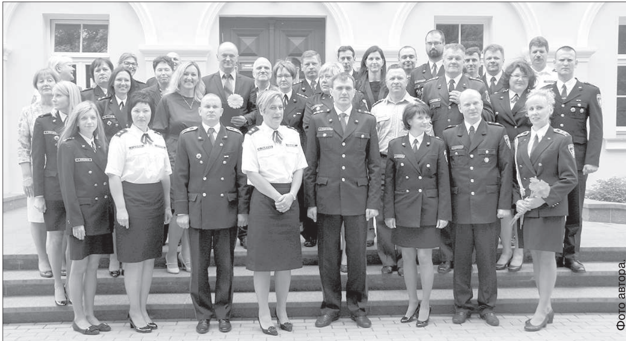
Прибывшие на торжество гости.