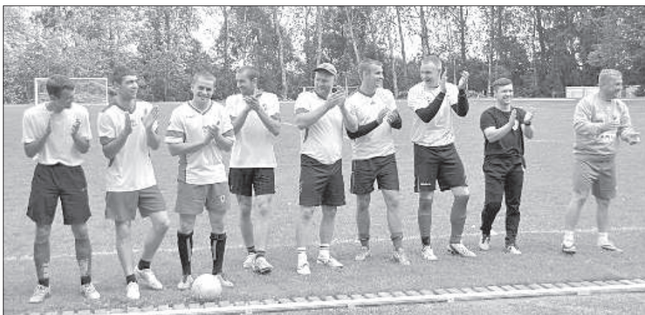
Зарасайская команда в розыгрыше кубка участвует впервые.