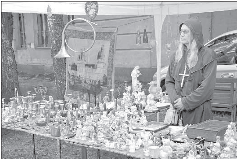
На блошином рынке внимание привлекают и товар, и торговцы.

Чтобы участвовать в бою за крепость, в Даугавпилс съехалось более сотни представителей клубов исторической реконструкции из Латвии, Литвы, Белоруссии, Великобритании, Польши и России. Сражение возле крепостного люнета, в котором «французы» атаковали «русскую армию», выглядело впечатляюще, была задействована даже кавалерия, у зрителей, собравшихся на валу, от пушечных выстрелов закладывало уши. Сражение, в котором не обошлось без «раненых» и «убитых», сопровождалось историческим комментарием. В финале зрители устроили отважным армиям овацию. Среди зрителей было много иностранцев, приехавших в Даугавпилс