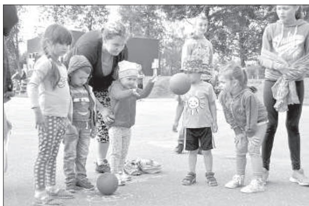
Дети занимаются спортом.

«На празднике мы показали, что умеем молиться, работать и отдыхать», – после этих слов председателя краевой думы в небе засверкал праздничный салют. ■