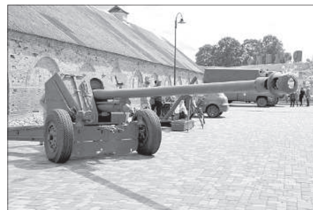
Выставка военной техники.