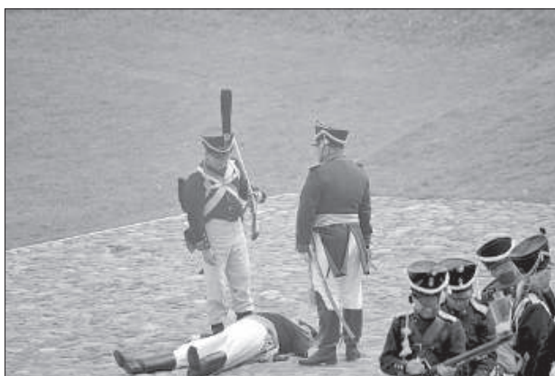
Без потерь не обошлось.

Вечером в субботу во дворе Центра искусств Марка Ротко выступила латвийская этнографическая группа «Auļi», после чего состоялось огненное и пиротехническое шоу. В воскресенье на фестивале был день спорта.