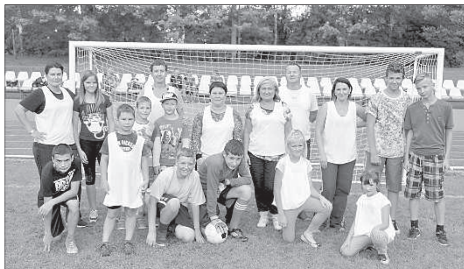
Дружеская встреча команд Вишек и «Латгалес Лайкс».