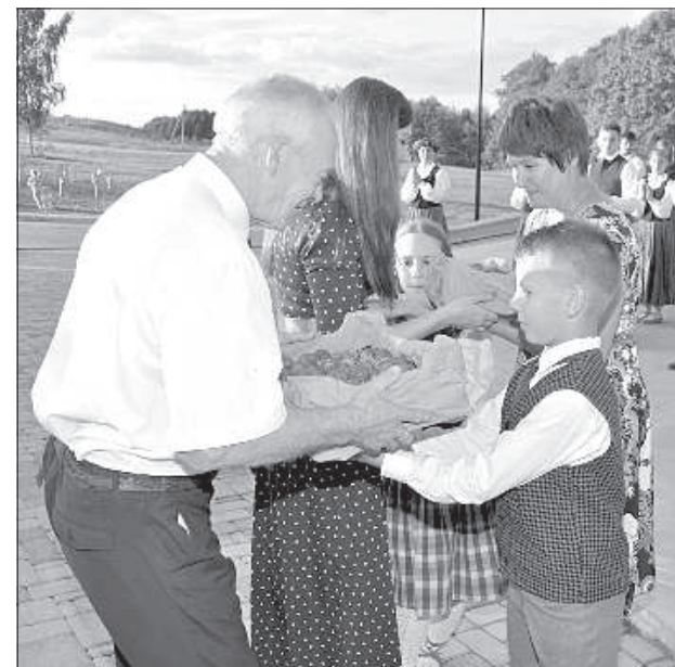
С. Разна благодарит участников праздника.