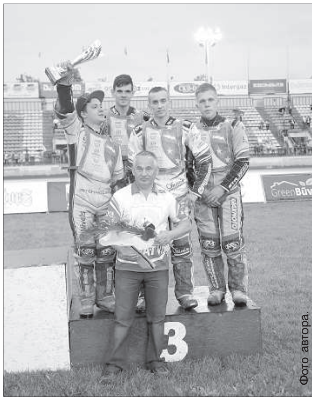
Сборная Латвии завершила полуфинал на третьем месте.