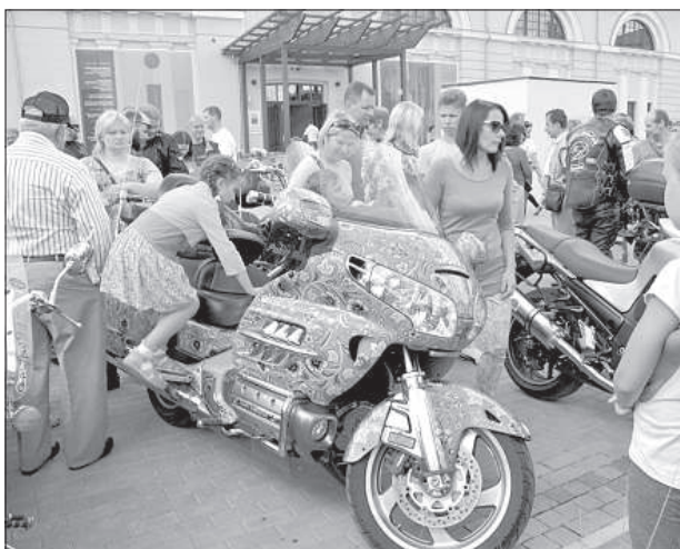
Мотоцикл в народном стиле был популярным объектом для фотографирования.

на биеналле керамиков, и для них фестиваль стал очень необычным и интересным событием.