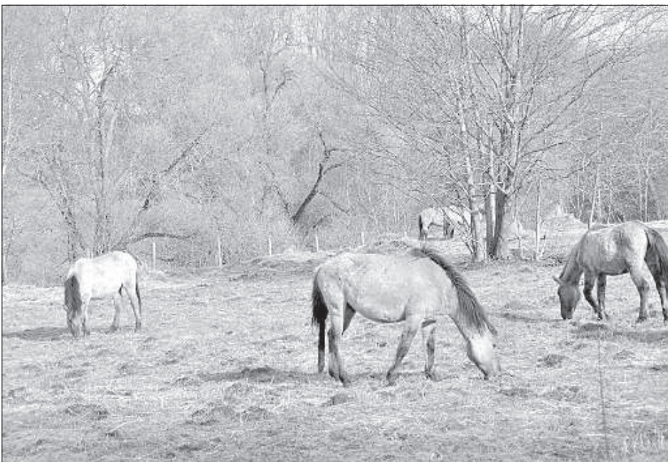
Выпас скота – наиболее щадящий способ хозяйствования на ценных лугах.