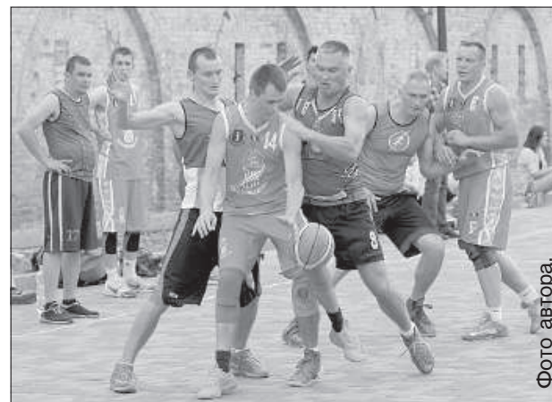
«Чуча-чуча» второй этап подряд — вторые.

Впервые этап чемпионата Даугавпилса по стритболу проходил в крепостных стенах. Рядом с пороховым складом развернулась битва за звание лучших на втором этапе.