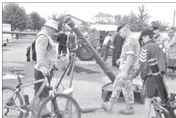
Показательные выступления земессардзе.