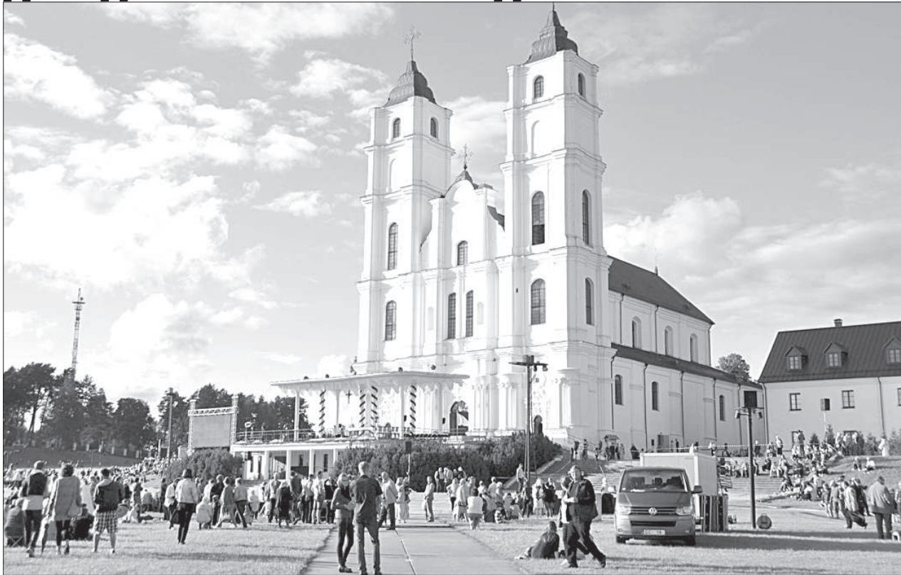
Праздник Аглонской Богоматери начали отмечать в 1989 году.