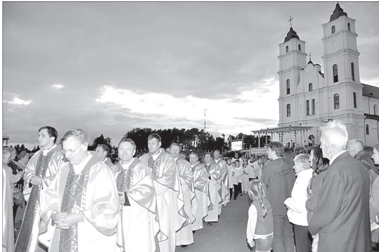
Праздничная процессия чествования Богоматери.

В празднике Вознесения Девы Марии, который начался 11 августа с Дня больных и кульминации достиг 13-15 августа праздниками Святого Мейнарта и Богоматери, участвовала 31 паломническая группа. Только одна группа приехала на велосипедах, остальные шли в Аглону пешком.