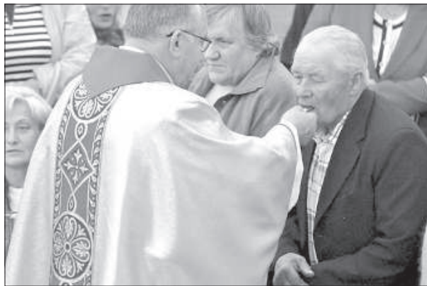
Десятки тысяч верующих приняли святую коммунию.

Чтобы поздравить верующих и отдать Аглонской Богоматери свои просьбы, 15 августа у папского ал-