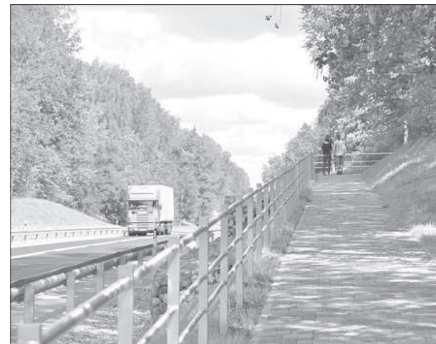
До староверского кладбища ведет тротуар из плитки.