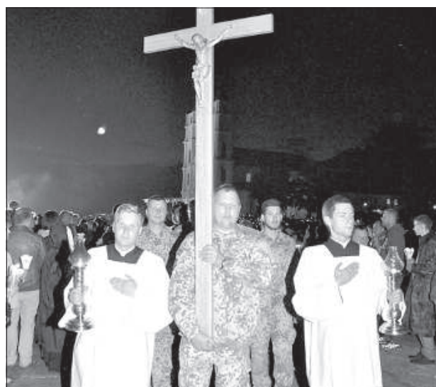
Крест во время молитвы народного крестного пути несут солдаты.

Самая большая группа (90 человек) была из Бебрене, она до Аглоны прошла 180 км. В Аглону также пришли солдаты Национальных вооруженных сил. Более 200 верующих приняли святое причастие, к тому же длинные очереди к исповедальням 14 августа иссякли только после ночной мессы.