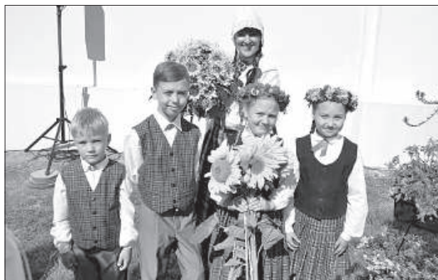
Дети из крустпилской воскресной школы подарят Богоматери цветы.

таря собрались также президент Латвии Раймонд Вейонис с супругой, председатель Сейма Инара Мурниеце, премьер-министр Марис Кучинский, архиепископ рижский и всея Латвии Латвийской православной церкви Александр, многие министры, дипломаты, руководители латгалских самоуправлений, депутаты Сейма и самоуправления.