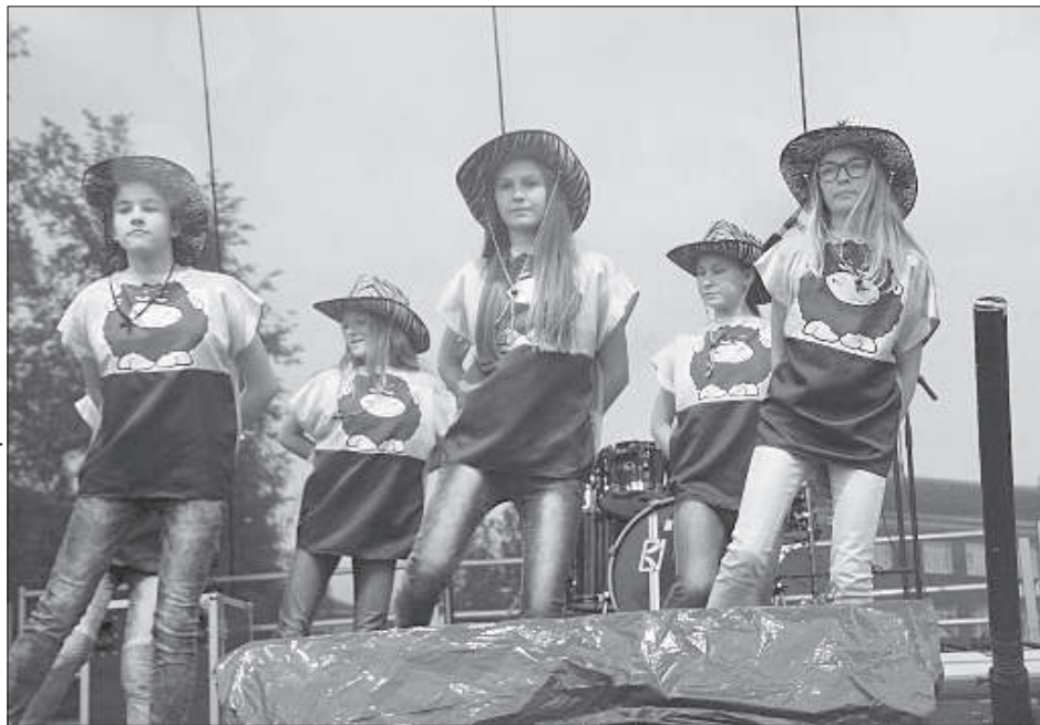
Танцевальная студия «Алисе» из Краславы.

Присутствующие могли не только наблюдать за тем, что происходит на сцене, в мастерских и спортивных площадках, но и сами участвовать: петь, танцевать, соревноваться в спортивных играх, преодолевать полосы препятствий, заниматься в творческих мастерских и узнать о возможностях неформального образования. Устроители фестиваля позаботились о грандиозном завершении праздника: перед молодежью выступил гость мероприятия, попу-