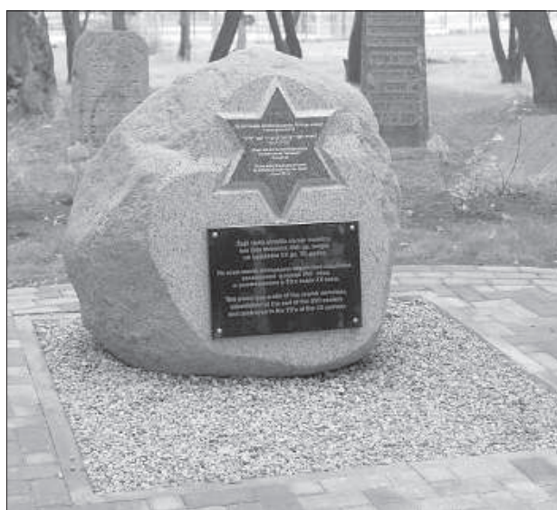
Памятный камень на месте бывшего кладбища.

Первым гостей встретил детский специальный сад № 2, расположенный в доме Соломона Михоэлса на одноименной улице. Здесь размещена экспозиция, посвященная деятельности режиссера и актера, родившегося в Динабурге в 1890 году. В прошлом году садику подарили уникальную пластинку с голосом Михоэлса, которая заняла почетное место на выставке. Несколькими годами назад дом и родной город отца посетил Нина Михоэлс.