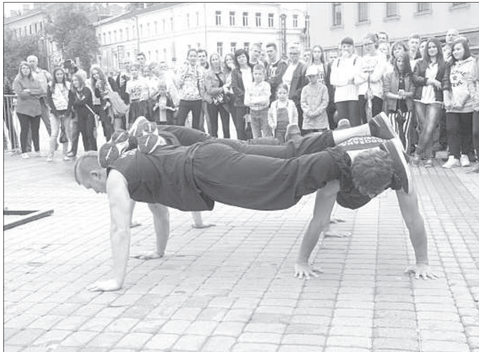
Уличные гимнасты привлекли большое количество зрителей.

лярный латвийский музыкант и ди-джей Маркус Рива.