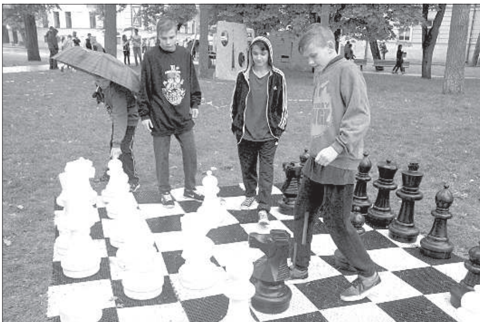
Дождливая шахматная партия.

вать свои идеи, начав свой бизнес, участвовать в какой-либо музыкальной группе, развивать свои спортивные или культурные таланты и т.д. На фестивале «Артишок» есть возможность ознакомиться со всеми этими сферами, найти нужных людей, освоить что-нибудь новое и хорошо провести время. ■