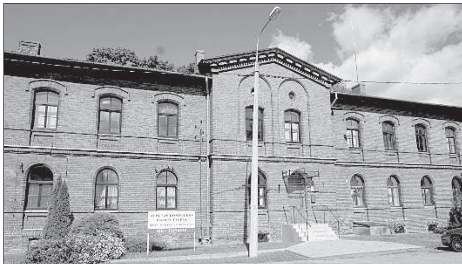
С сортировочной станции людей вывозили в Сибирь.