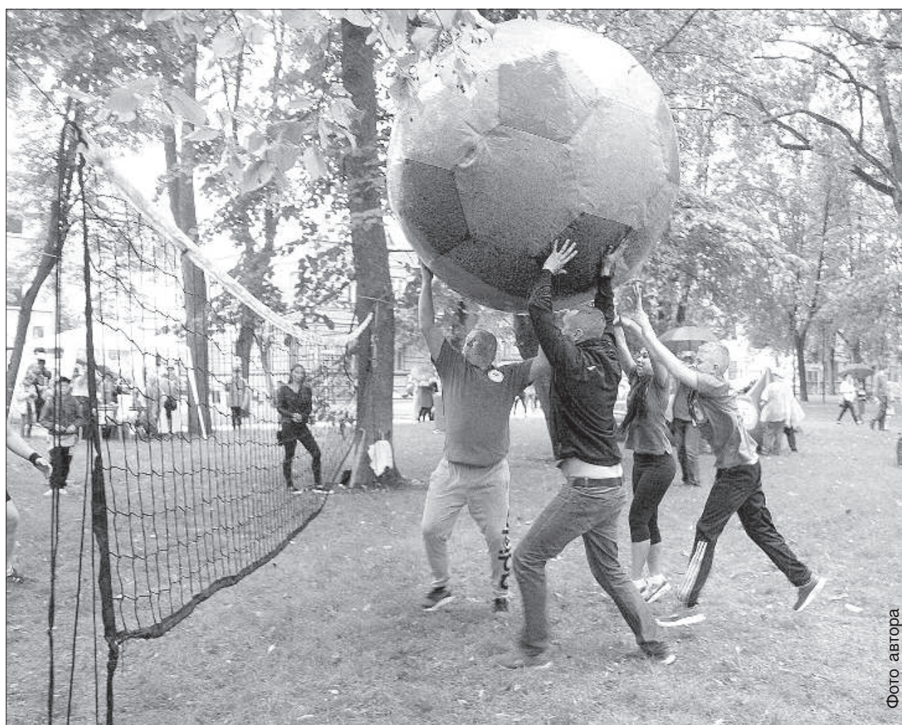
Веселый волейбольный матч.