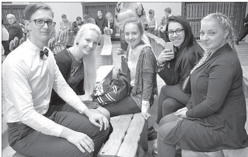
Двенадцатиклассники польской гимназии.