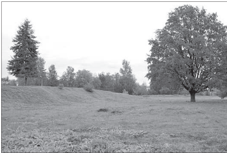
В центральном парке большая территория пустует давно.

тип о том, что после праздника города и Лиго больше ничего не происходит, был опровергнут, в разных местах Даугавпилса и в июле, и в августе проводились крупные тематические фестивали для массового посетителя.