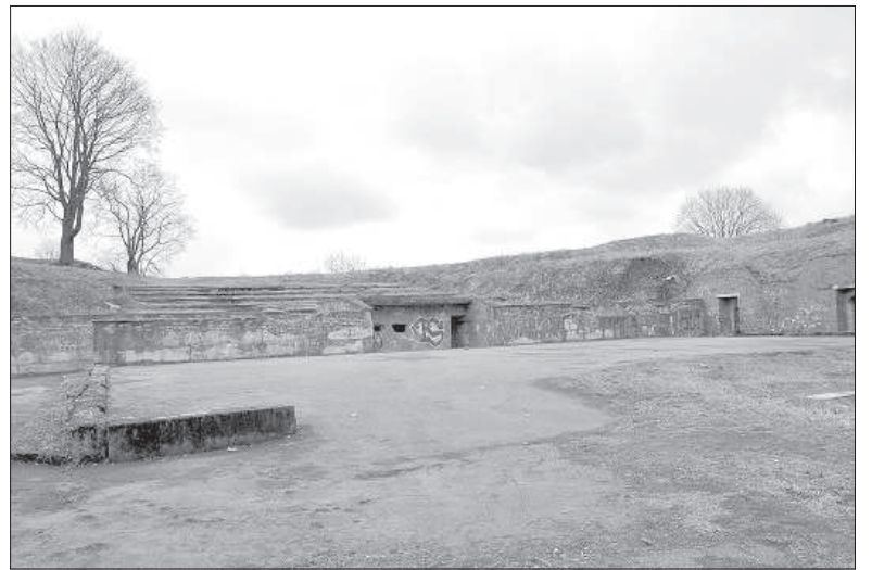
В 6-м бастионе в крепости когда-то уже была эстрада.