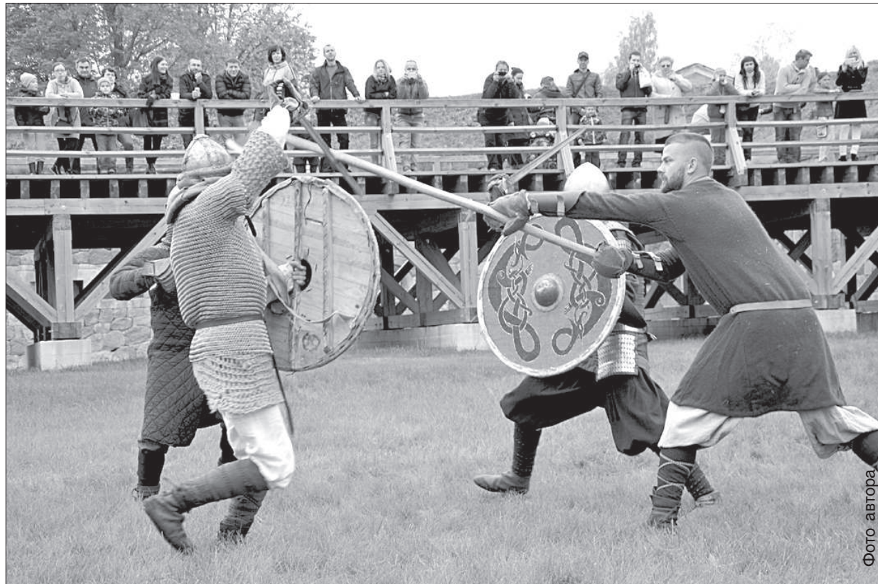
Бои были зрелищными.