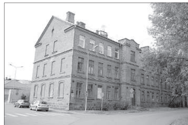
Дом №99 на ул. А. Пумпура.