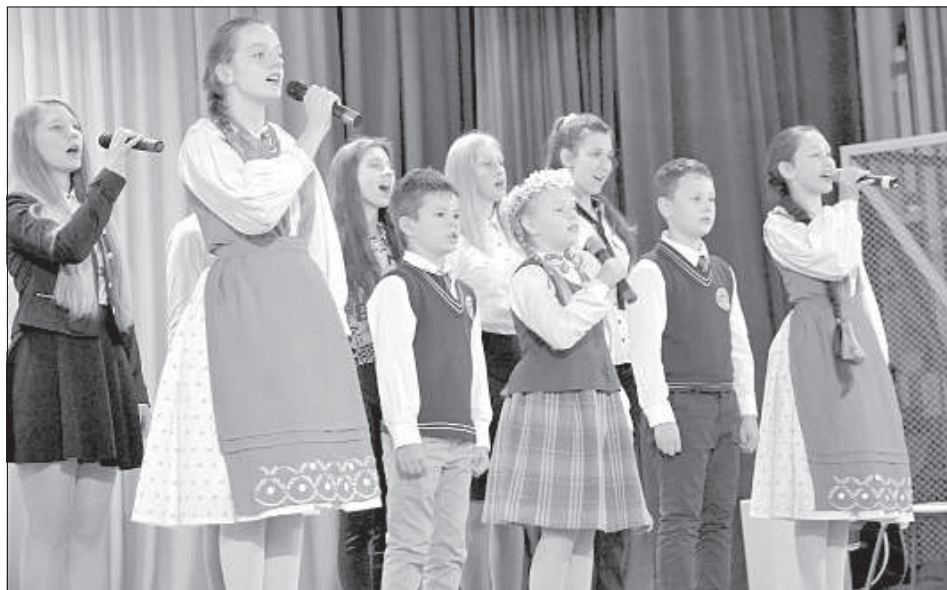
Дети поют гимн гимназии.