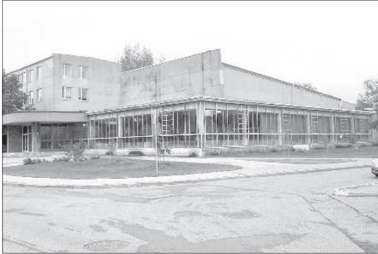
Концертный зал музыкальной школы можно было бы реконструировать.

Это лето в Даугавпилсе стало богатым на культурные мероприятия. Стерео-