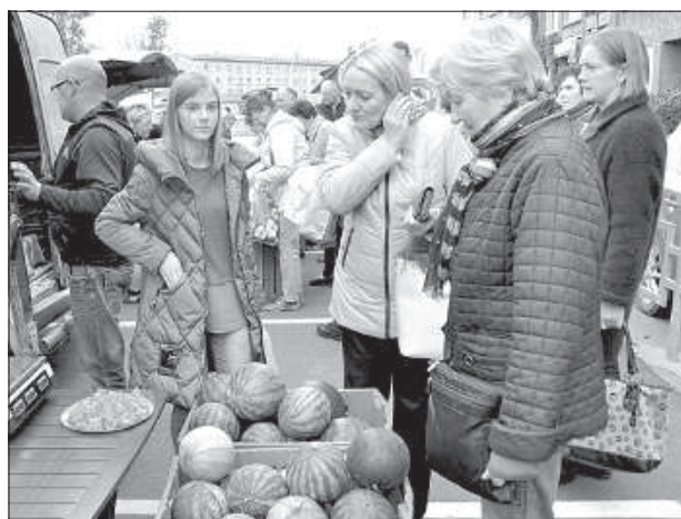
Даугавпилчане говорят, что соскучились по местным арбузам.