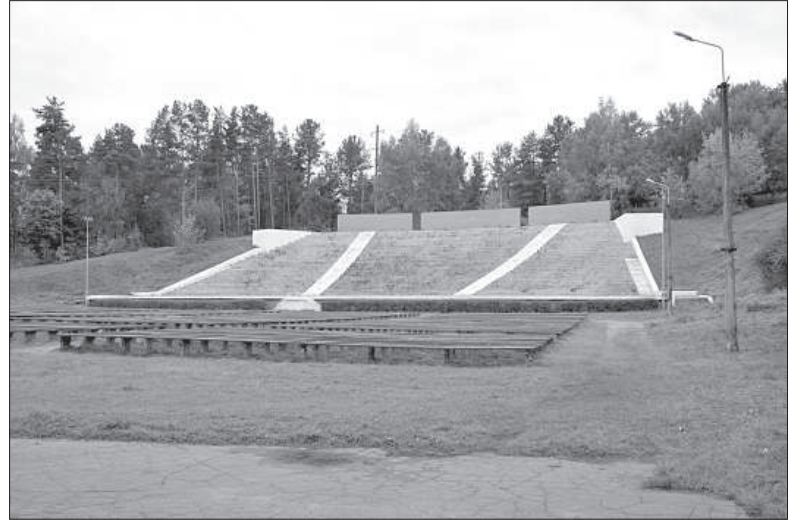
Стропская эстрада почти не задействована в культурной жизни города.