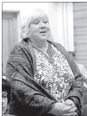
Руководитель отдела образования дагдского самоуправления.

стно разрабатывать концепцию развития сети учебных заведений.