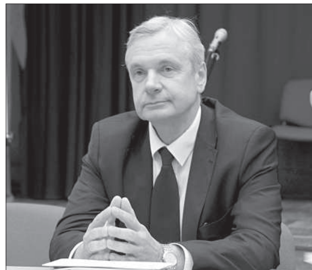
Карлиса Шадурскиса удивило недовольство педагогов зарплатами.

Отвечая на вопрос, как в больших школах смогут проследить за успеваемостью учащегося и пропусками уроков, министр подчеркнул, что это зависит от самой школы, так как существует множество возможностей обеспечить обратную связь, хотя бы посредством э-класса, в который родителям также следовало бы заглядывать почаще. «Если нашлось время сделать ребенка, то нужно найти его и для его воспитания», — строго сказал министр. Он подчеркнул, что школы в Латвии немного грешат: если что-то не успевают сделать во время урока, дети перегружаются чрезмерными домашними заданиями. Министр подчеркнул, что в новом стандарте образования, который начнут внедрять в 2018/2019 учебном году, боль-