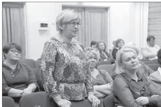
Педагогов интересовали многие вопросы.

Министр возразил, что мнение о зарплатах вызывает у него недоумение. «Большой частью все, что делает правительство, для нашего общества плохо. Думаю, что команда министерства этим летом хорошо поработала, и в 2017 году 47 миллионов евро поступят в систему оплаты труда педагогов», — сказал министр. Он считает, что реформу следовало провести, так как предыдущая модель зарплат педагогов предусматривала два территориальных коэффициента (городской и сельский): «Учитывая миграцию населения в Ригу и Рижский регион, мы обанкротились бы за пару лет: пришлось бы вложить дополнительные деньги». Министр подчеркнул, что в плане объема вложения денег Латвия занимает первое место в ЕС, а в плане зарплат — последнее. На вопрос, куда же деваются деньги, он ответил, что их «съедает» неупорядоченная система школьной сети, в которой отличается сумма, необходимая для содержания школьников. К. Шадурскис неоднократно подчеркнул, что не поддерживает систему «деньги следуют за учеником». Однако чтобы перейти на финансирование программ, государство должно сотрудничать с самоуправлениями и совме-