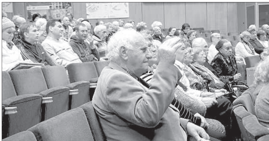
Пенсионеры активно задавали вопросы и вносили предложения.

Вторая встреча пенсионеров с экспертами была посвящена темам коммунального хозяйства, обслуживания домов и городской среде. Организации seniors заранее подготовили для специалистов более 100 вопросов. Беседа шла, в основном, в конструктивном ключе, некоторые выступающие, несмотря на просьбу не обращаться с частными вопросами по конкретному дому, все же вставали, потому что «наболело».