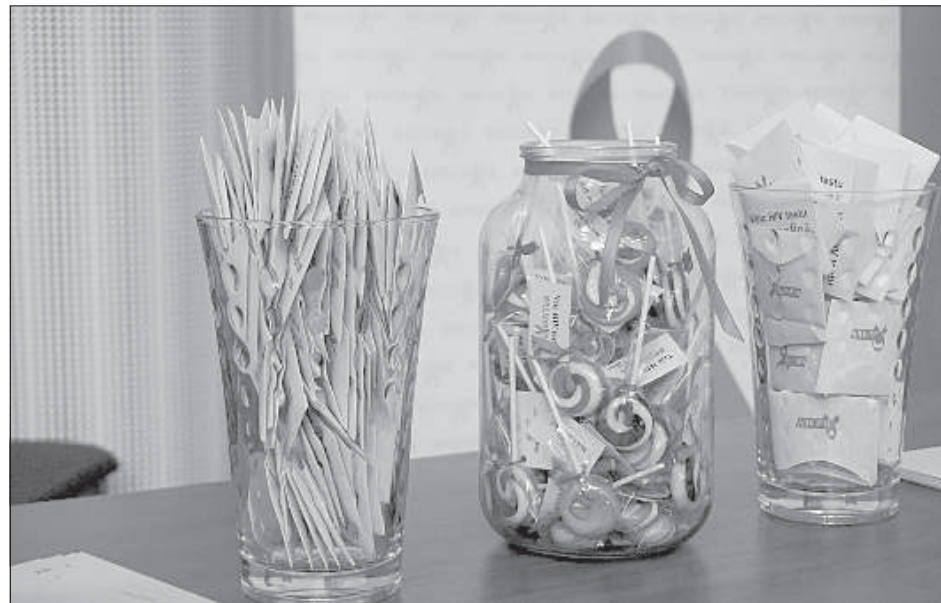
Раздаточный материал информационной кампании — презервативы и леденцы.

Коварность вируса ВИЧ в том, что он очень медленный, болезнь может проходить бессимптомно в течение 5-10 лет. Но если вирус однажды попал в организм человека, то он остается там на всю жизнь. Человек, который не знает о вирусе внутри себя, продолжает его распространять, заражая других. «Даже если вы приехали из отпуска, где «отдыхали на полную катушку», или у вас была связь на одну ночь, то, сдав анализ сразу после