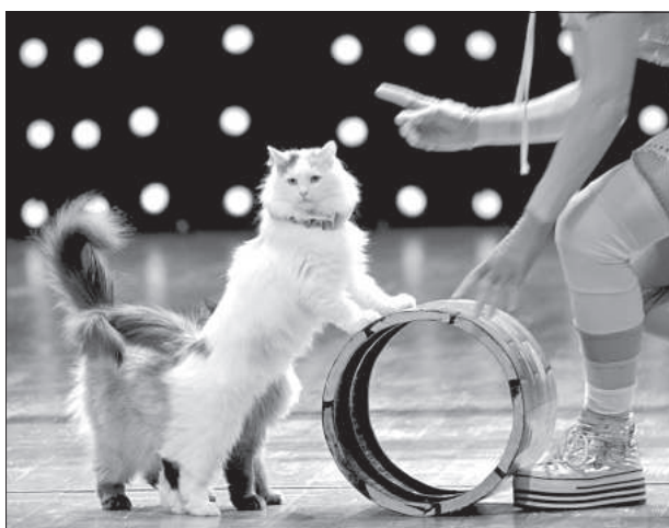
Котики красовались перед публикой.