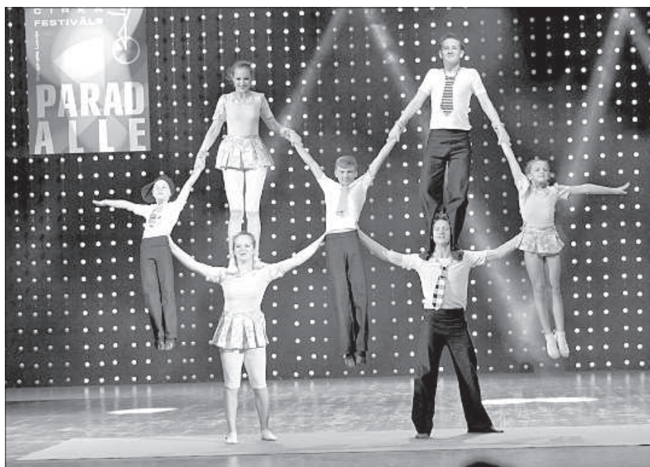
Акробаты из народного цирка «Гротеск».