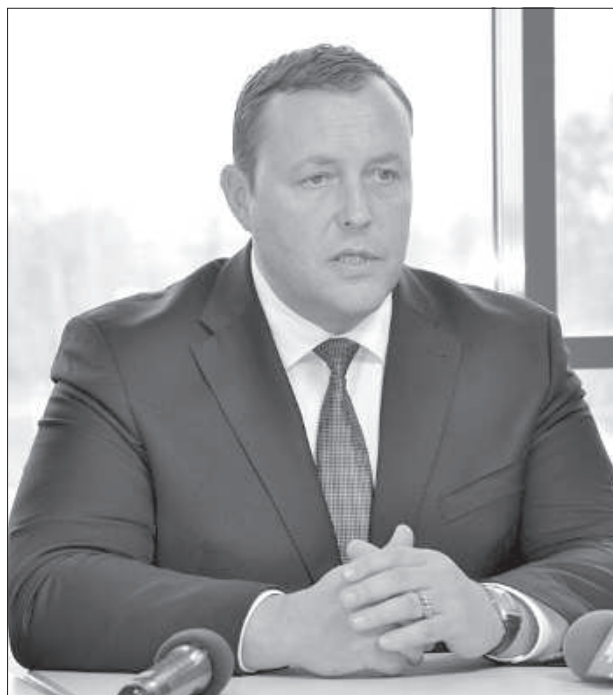
Рихард Козловский возглавляет МВД с 2011 года.