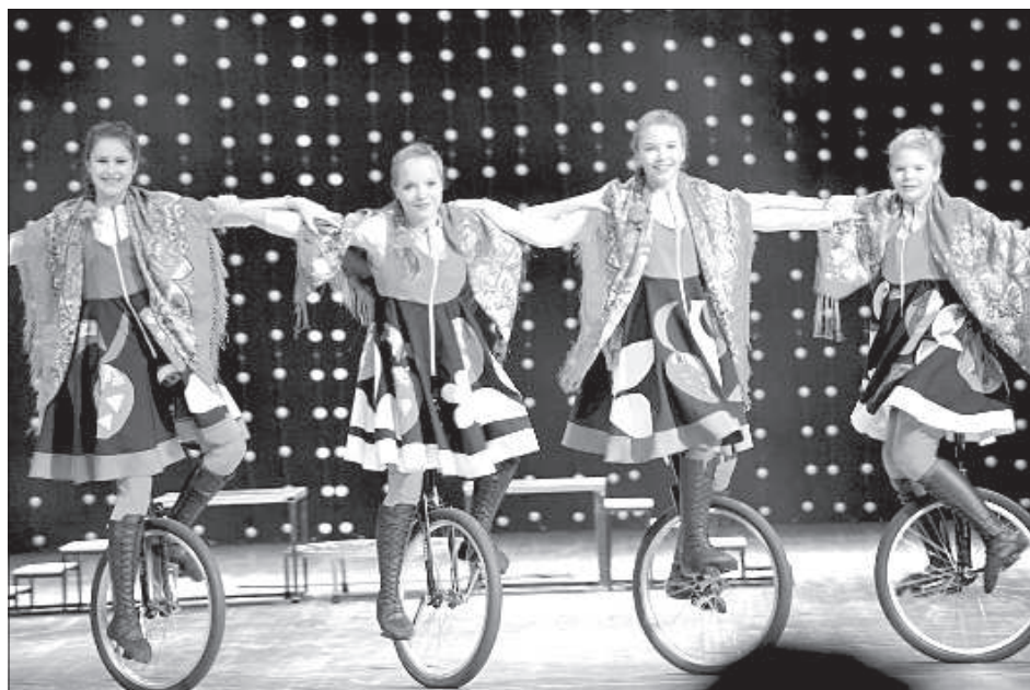
Зрелищный номер «Русские матрешки» от девушек из Санкт-Петербурга.