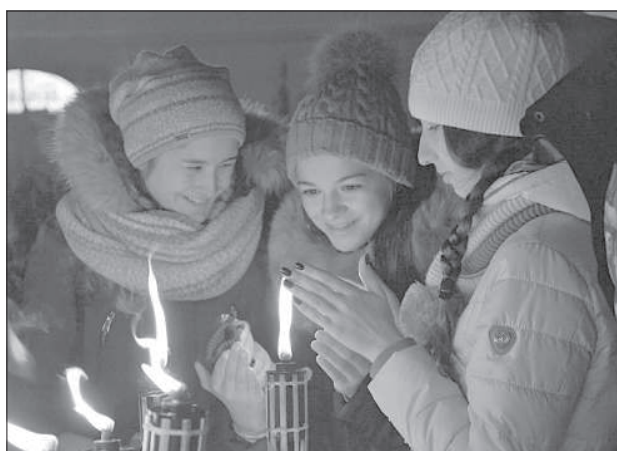
От пламени факелов можно было согреться.