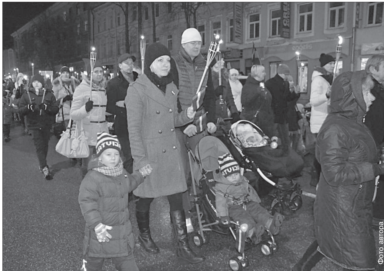
Многие жители участвовали в шествии целыми семьями.