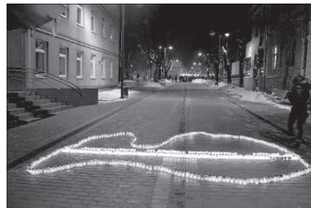
Возле основной школы «Сасканяс» выложен контур Латвии.