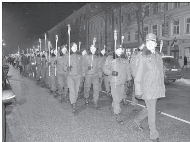
Пограничники в составе шествия.