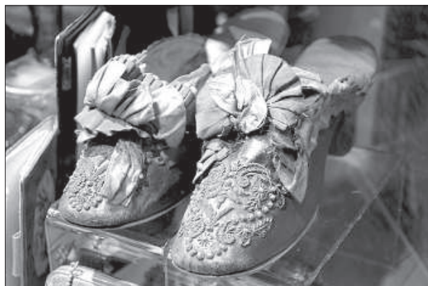
Женщины носили обувь 33-го и 34-го размеров.

Историк моды, искусствовед, коллекционер и популярный телеведущий Александр Васильев спустя 2 года вернулся в Даугавпилс, чтобы в Центре искусств Марка Ротко открыть выставку уникальных нарядов и аксессуаров «Шарм моды Викторианской эпохи».