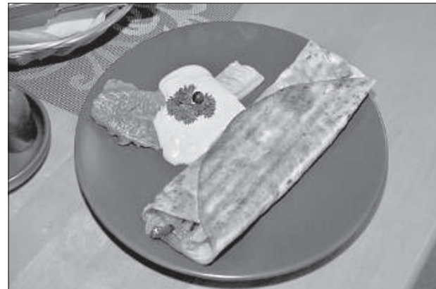
Кебаб из кукурузной муки полюбился дальнобойщикам.

Награждение лучших предпринимателей, работающих в сфере общественного питания на селе, состоится 24 ноября на конференции по оценке туристического сезона. В Даугавпилсском крае работает 17 предприятий общественного питания.