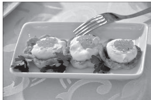
Маленькие картофельные блинчики.

ПОДПИШИСЬ СРАЗУ НА ВЕСЬ 2017 год со СКИДКОЙ!