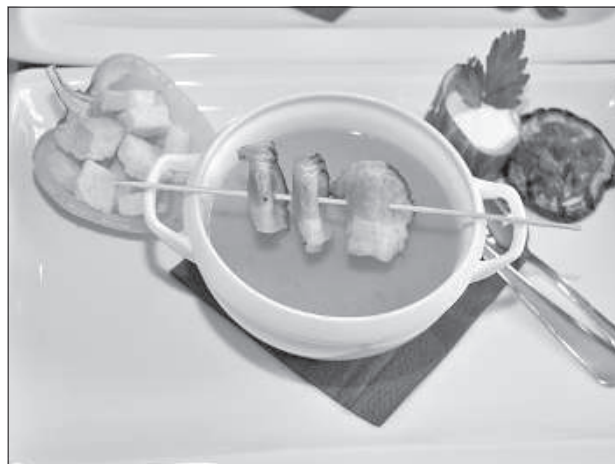
Суп из помидоров.