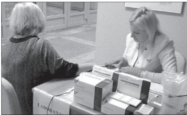
Перед сдачей крови донор сдает анализы.