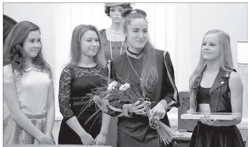
На открытии выставки выступила вокальная студия 13-й средней школы.

вые в Российской империи была основана звукозаписывающая фабрика «Пишущий Амур».