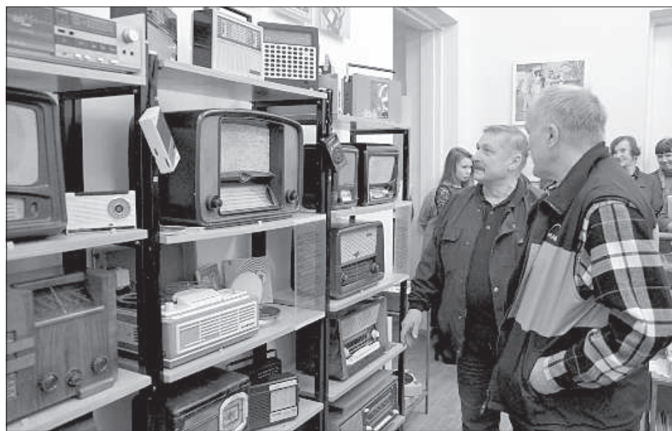
На выставке можно погрузиться в ностальгические воспоминания.