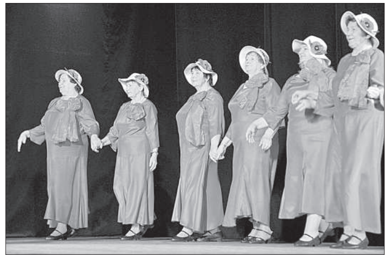
Танцевальный коллектив сениоров Вишкской волости «Магонес».