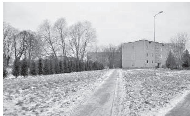
Новая пешеходная дорожка в Калкунах.

го фонда самоуправления Калкунскому волостному управлению в месяц выделяют 2200 евро на содержание дорог и улиц. Это средства не только на топливо, но и на зарплату работников. Но как-то обходится. Из средств программы сельских дорог в 2017 году перестроим 1,4 км дороги Палабишки — Бурас», – сказал управляющий. Он считает, что так называемый бе-