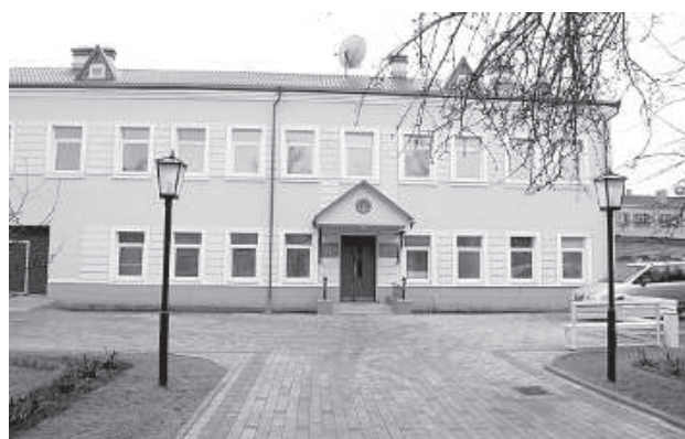
Здание консульства возродили к жизни 20 лет назад.

Можно прогнозировать, что в скором будущем количество туристов и желающих въехать в Беларусь значительно увеличится. С 1 января вступила в силу новая редакция Налогового кодекса РБ, устанавливающая единую ставку консульского сбора в размере 60 евро как для краткосрочных, так и для многократных виз. Более того, ставка консульского сбора для долгосрочной многократной визы устанавливается в размере 60 евро вместо прежних 150 евро. ■