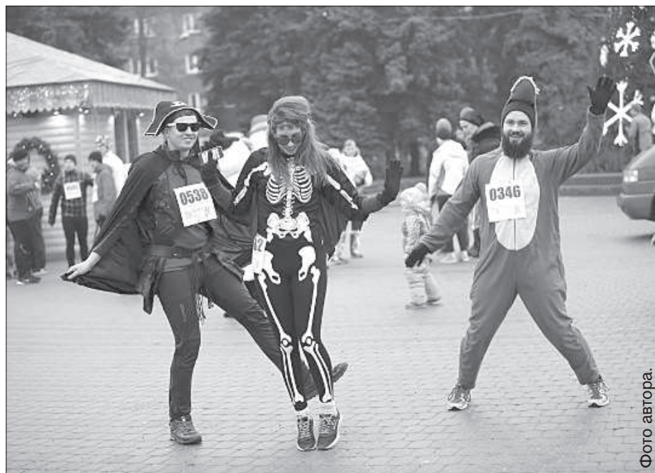
Предновогоднее настроение перед стартом.

Сергей Кузнецов Традиционно в последний день года в полдень на площади Виенибас стартовал «Новогодний забег». Вокруг Дубровинского парка участники преодолевали дистанцию в зависимости от настроения от одного до пяти километров. Забег прошел под знаком плюс: около 300 участников и не по-зимнему теплая погода.