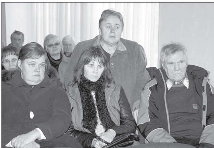
Жители Ликсны просят поддержку в асфальтировании двора.

Крестьяне волости просят вырубить старые деревья вдоль дороги от перекрестка до поселка, потому что они мешают ездить сельскохозяйственной