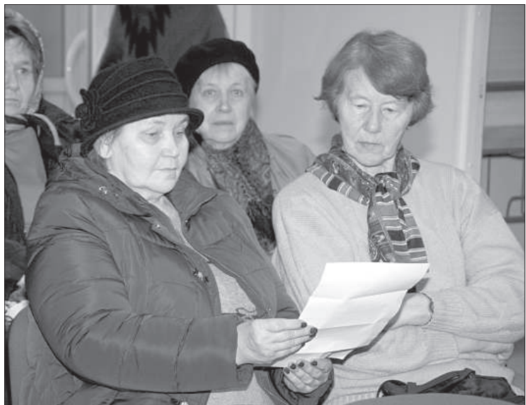
Жителей Ницгале до сих пор беспокоит грязная вода.