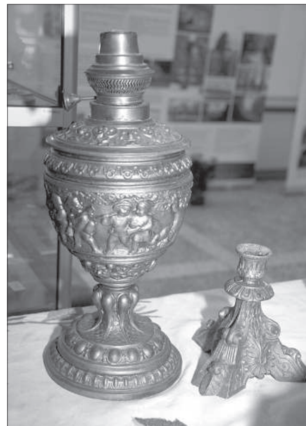
В музее рода Скринд хранятся керосиновая лампа и подсвечник графов Плятеров.

В прошлом году работники музеев Даугавпилсского края посетили места жизни легендарной графини Эмилии Плятер в Литве, а музей рода Скринд принимал литовских коллег, которые предложили дальнейшее сотрудничество в изучении рода Плятеров. Данная выставка — только одно из запланированных мероприятий о роде Плятеров в Даугавпилсском крае, где они жили.