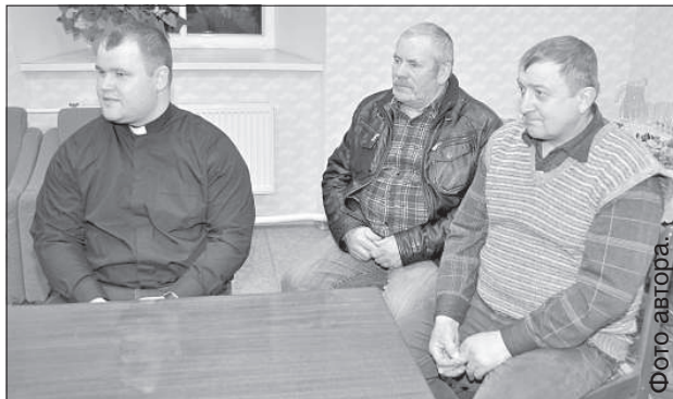
Жители Извалты говорят, что им необходима хорошая дорога.

В беседе с «Латгалес Лайкс» У. Аугулис расска-