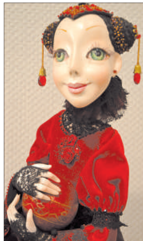
«Лаура» Ольги Флоринской.