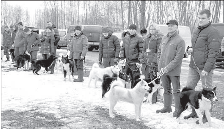
Парад собак охотничьих пород.

В Демене в центре обучения охотничьих собак 18 и 19 февраля проводилась выставка собак охотничьих пород и проверка-экзамен по загону кабанов. Заслужив награды и судейские записи в паспорта, собаки подтвердили, что они являются самыми ценными представителями своих пород и могут участвовать в охоте и впредь.