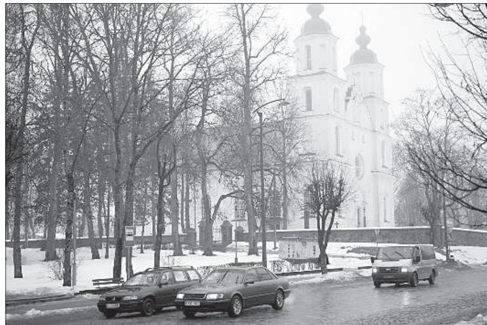
На улицах Зарасая.

Медумская волость находится в зоне природоохранной территории, что накладывает ограничения на ведение хозяйственной деятельности. Если кто-то и захочет разместить в поселке производство, то оно должно соответствовать