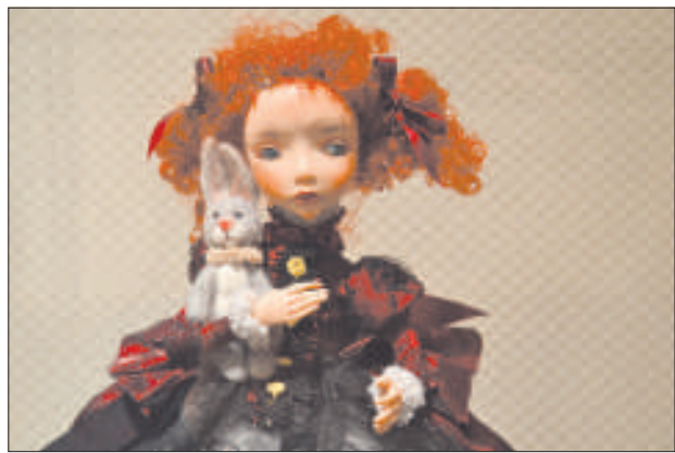
«Кукла с кроликом» Далии Гражиене.