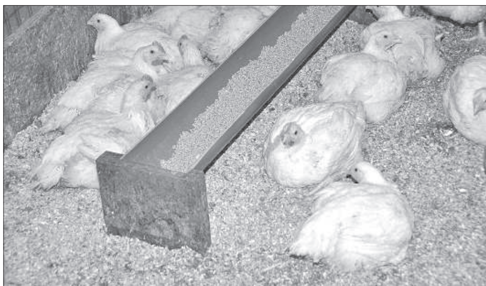
Несушек, как и других птиц, будут держать «в тюрьме» 3 месяца.