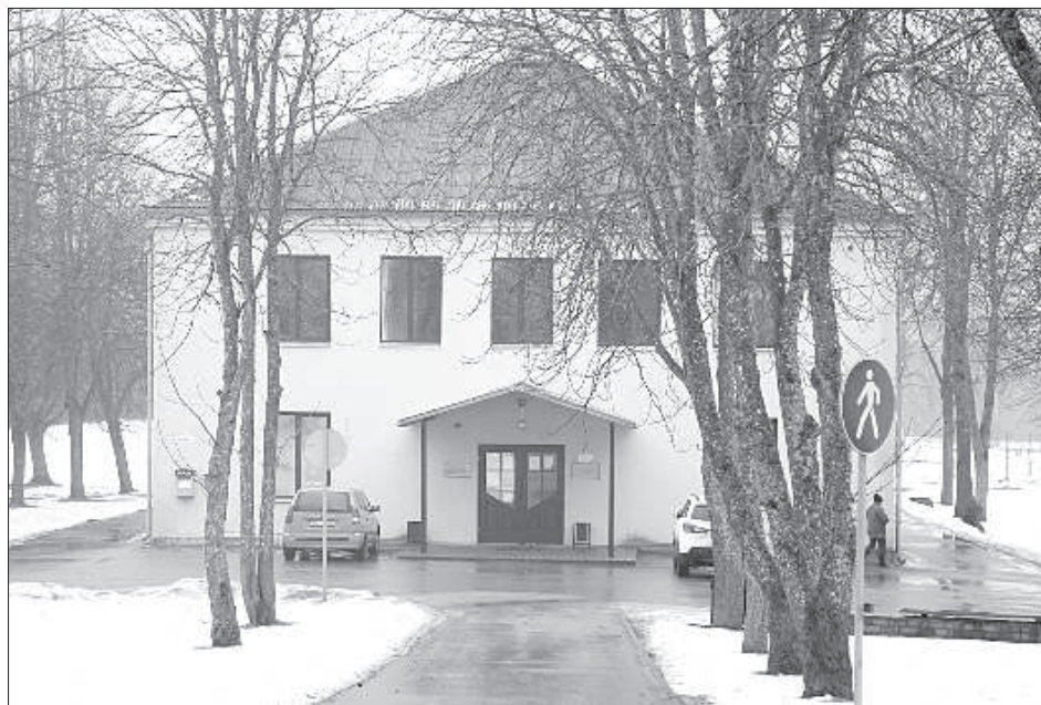
Медумское волостное управление.

Л. Божко отмечает, что в отсутствие необходимости стоять на границе можно в любой момент быстро съездить в Литву: «Бывает, и в обеденное время используем съездить туда и обратно. Дорога в одну сто-