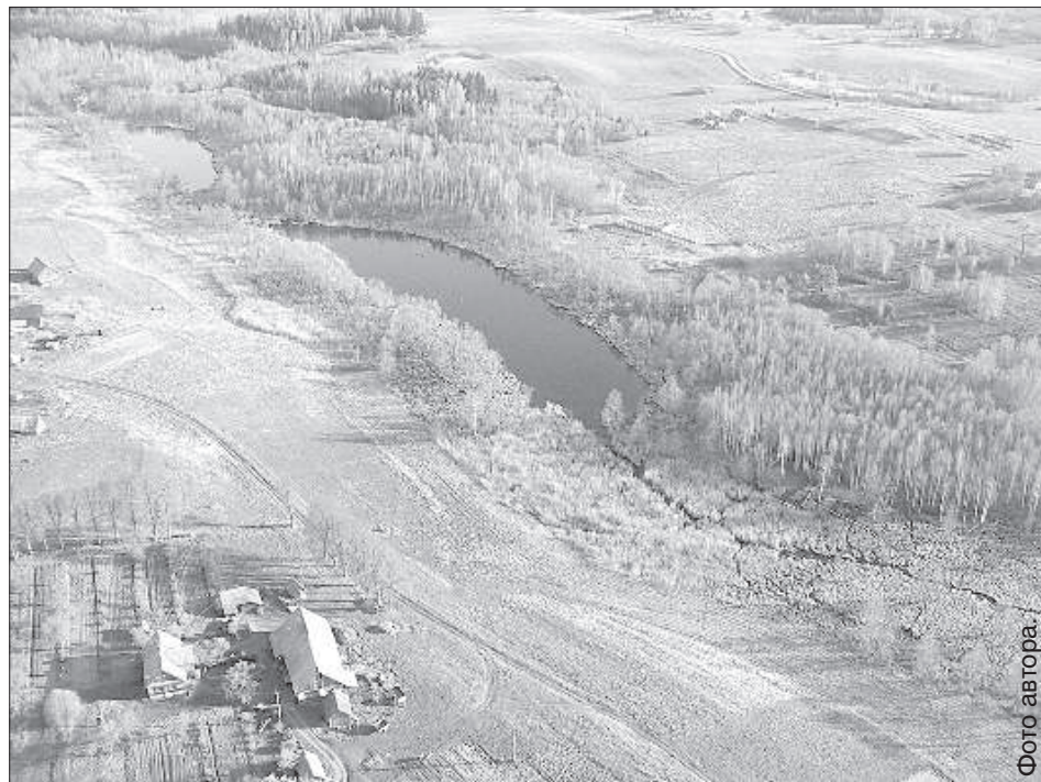
Вецсалиенская волость — одна из меньших по количеству жителей в Даугавпилском крае