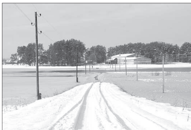
Вода отрезала от внешнего мира крестьянское хозяйство «Смилтаи».

повышаться. В течение дня в садоводческом кооперативе «Любисте» уровень воды поднялся на метр. Большинство подъездных дорожек в садоводческом кооперативе уже затоплены, садовые домики стоят в воде. Мы встретили пожилую пару, которая в резиновых сапогах брела по затопленной дороге. Они пытались спасти пару своих пчелиных семей, подняв выше улья. В соседнем дворе громко мяукала кошка, но в руки не давалась. «Жаль животинку», – грустно сказала женщина. Внутри их садового доми-