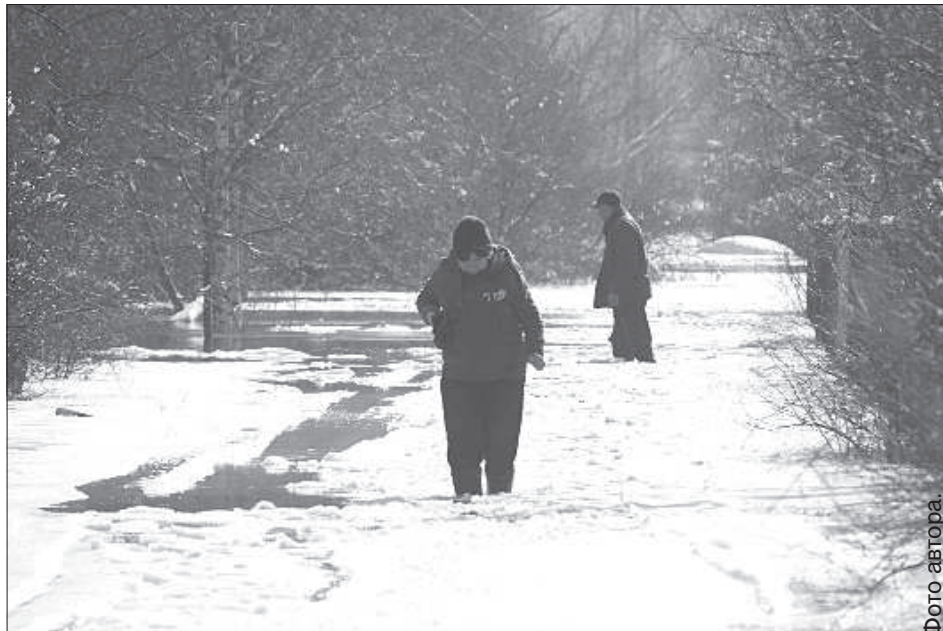
Жители «Любисте» спешат спасти своих пчел.

Управляющая Ликсненской волости Бирута Озолина также считает, что уровень воды еще будет