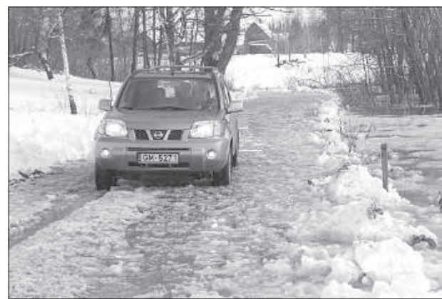
Из-за вышедшего из берегов озера Коша невозможно проехать и по соседней дороге.