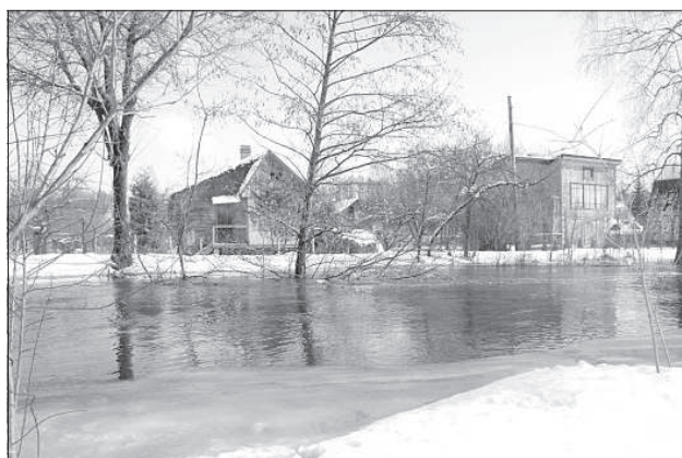
Постепенно затопляется садоводческий кооператив «Любисте».

Во вторник в Даугавпилском крае было создано заседание комиссии по гражданской обороне, на котором обсудили план мероприятий во время половодья. Все ответственные службы и волости края готовы к чрезвычайной ситуации во время половодья.