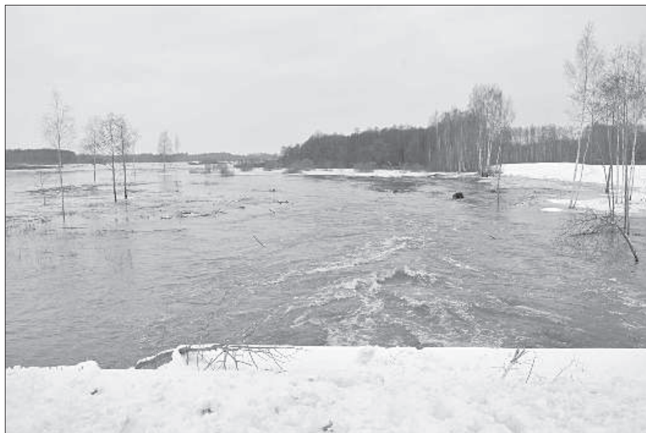
Паводок стремительно приближается к дороге Илуксте — Двиете.

Земессарги обещают помочь лодками, но хозяева домов говорят, что плавать на лодке пока опасно, поскольку около домов стоят горы острых льдин. Вода затопила и большие площади озимых, поля и 3 волостные дороги. «Мы каждый день объезжаем волость, звоним оставшимся на «островах». Если вода продолжит свое наступление, то будем просить помощи у земессаргов», — сказала И. Плоне.