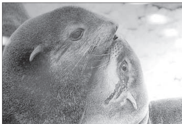
Морские котики на фотографии «Дружба».