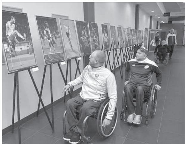
От каждой фотографии исходит мощная энергетика.

От всех фотографий исходит очень мощная энергетика, и смотреть на них равнодушно невозможно. Фотограф Юрис Берзиньш-Сомс очень тонко передал характеры людей, имеющих какие-либо физические ограничения, но бесконечно сильных и свободных, преодолевших боль, страх и удары судьбы.