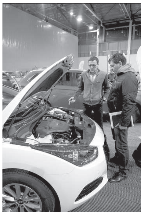
Машины можно было протестировать.