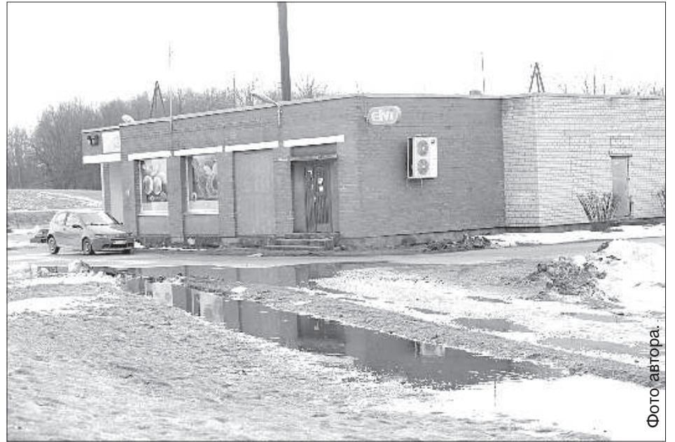
Добраться до магазина пожилым жителям Салиены непросто из-за образовавшихся луж.