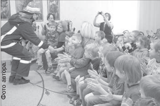
Дети с удовольствием угадывали профессии.

В Даугавпилсе состоялись традиционные Дни Михозлса в честь известного уроженца Двинска. Режиссер, актер, педагог и общественный деятель Соломон Михозлс родился 16 марта 1890 года.