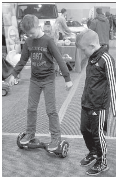
Дети тоже выбирали себе транспорт.