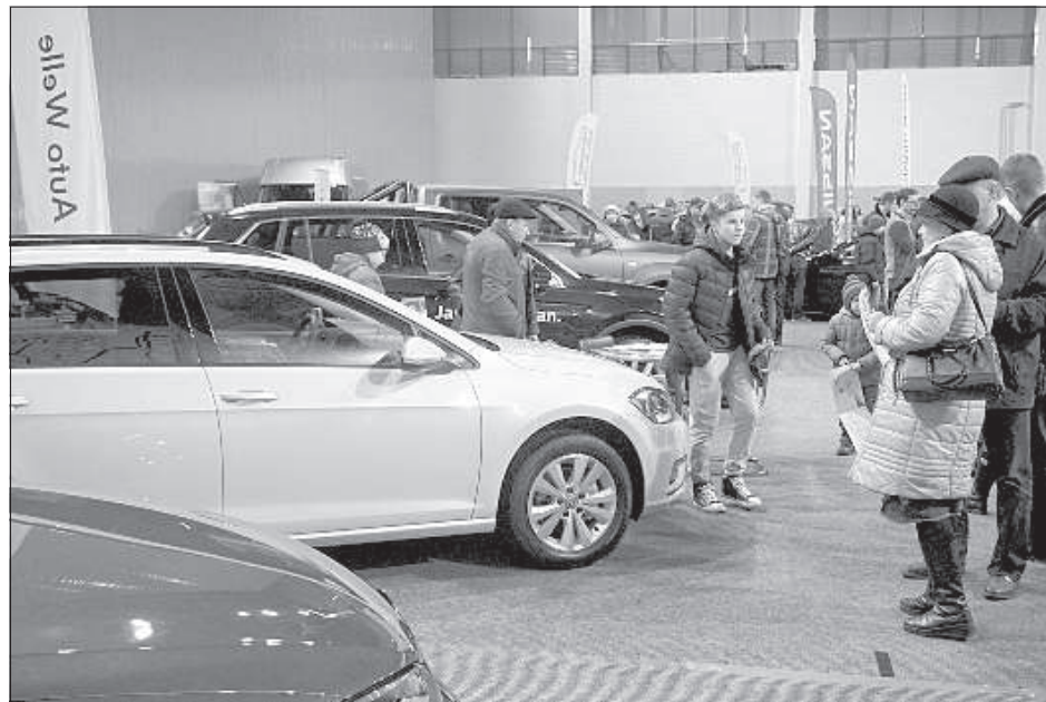
Автомобили разместились в помещениях Олимпийского центра и снаружи.

Как латвийцы покупают автомобили в условиях непростой экономической ситуации? Представители нескольких автосалонов рассказали «Латгалес Лайкс», что по их статистике, жители Латвии не стали покупать меньше машин. Тенденция последних лет — люди стали чаще менять машины, поездив на одной 3-4 года. Не