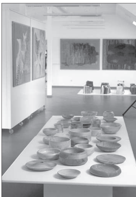
Работы, создаваемые в стенах школы, функциональны и красивы.