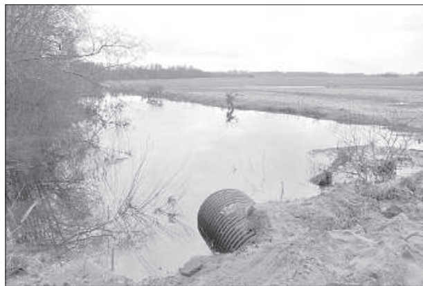
МС считает, что хватает уже имеющихся труб.

Тем временем в письме МС говорится, что под дорогой уже уложены трубы достаточно большого диаметра, поэтому дополнительно для отвода воды ничего строить не будет. ■