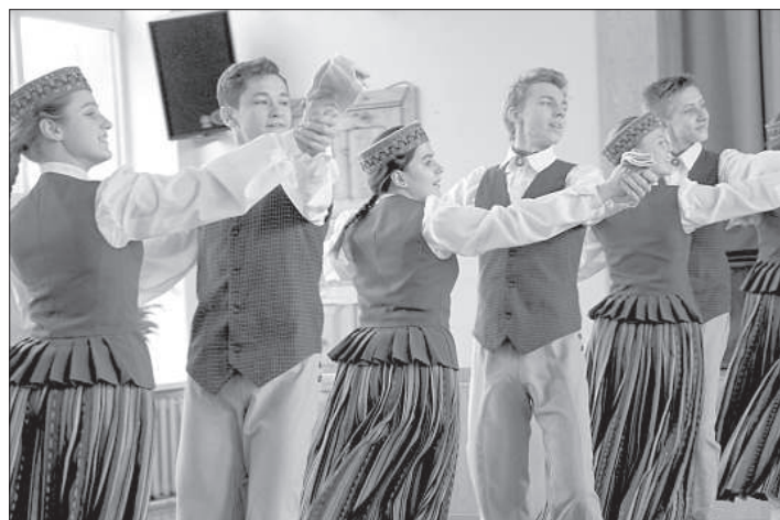
Коллектив Русского лицея «Балагуры» показал как слаженно работают в команде.

На данный момент МС собирает информацию от самоуправления, в которых государственные дороги находятся в критическом состоянии. Самоуправление Ливанского края подало заявки на 3 дороги: упомянутую рожупскую, где нужно отремонтировать более 25 км, дорогу Ерсика – Старес (первые 3 км) и дорогу Рожупе – Ванаги – Варкава, где не заасфальтированы 2 км.