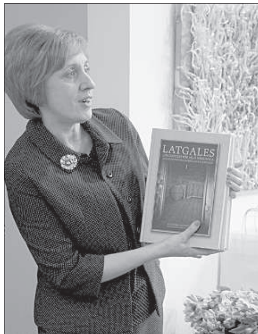
Все поздравляющие дарили школе книги для библиотеки.

В честь юбилея на третьем этаже исторического здания школы была открыта выставка «От ремесла до искусства» и презентован каталог «Ремесло. Искусство. Дизайн». На выставке представлены работы преподавателей и студентов школы разных лет. Подушки, ковры, гобелены, изделия из дерева — все эти авторские вещи функциональны и уникальны, поскольку созданы с большой любовью к своему