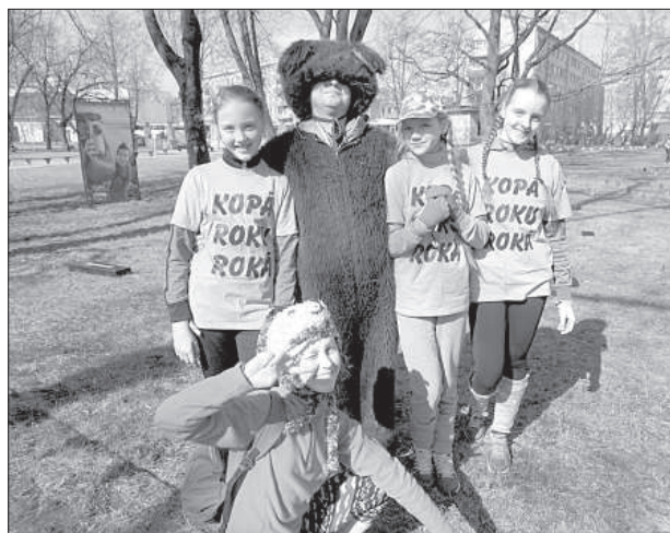
Ученики Даугавпилсской польской гимназии.

Школьники подошли к ответственному мероприятию нестандартно, многие придумали названия своим командам и нарядились в одежду одного цвета. Кто-то удачно обыграл тему холодной весны – так, школьники Плявиняской государственной гимназии оделись в снеговиков с носами-морковками. С приветственными словами и пожеланиями успешно выступить на соревнованиях школьникам