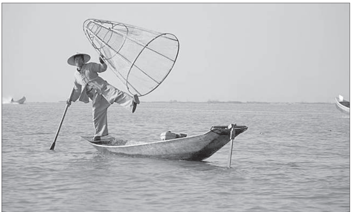
Озеро Инле включено в список Всемирного исторического наследия, поскольку на нем живут около 70 000 человек народности Инта, они получают продукты только из озера.

ные тексты или канон Пали, отражающий понимание жизни местными жителями. «Когда видишь один храм, кажется, что он самый красивый, но потом посещаешь второй, третий, десятый (они построены в XII-XIII столетии), и они все уникальны. Как я уже сказал, государство Мьянмы на самом деле учебник религии, но чтобы его «прочитать», одного путешествия не хватит. К тому же, в этой стране в воспоминаниях и в фотографиях можно собрать десятки восходов и закатов, и каждый из них особенный», – говорит Оскар. Он призывает людей путешествовать, потому что в путешествии каждый становится богаче знаниями, опытом и красивыми историями, которые можно рассказывать друзьям. ■