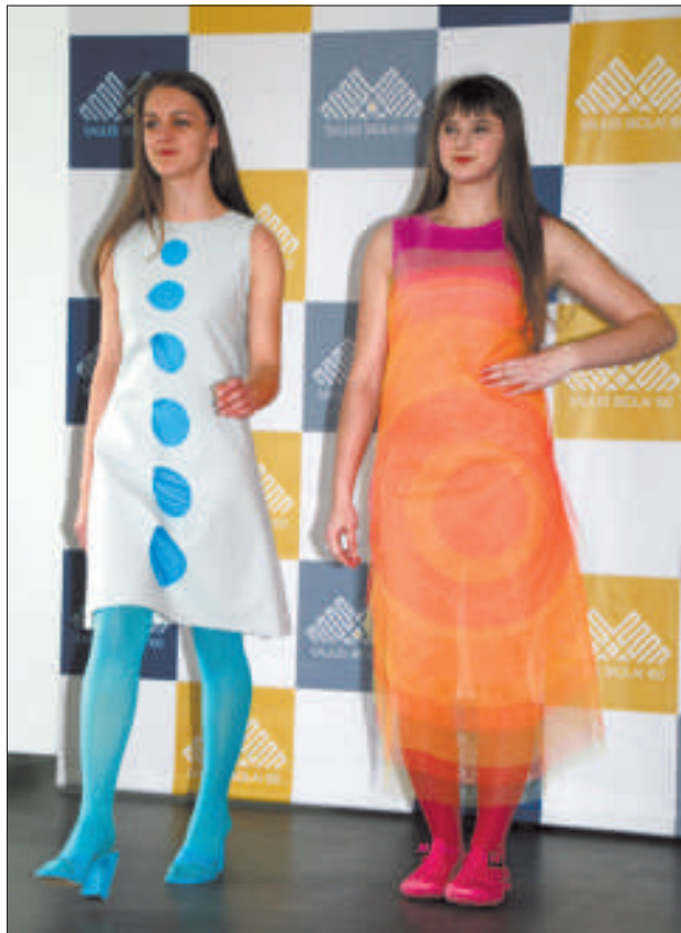
Модели из коллекции «Розовые круги + Адрия».

Традиционно прошел показ мод, посвященный Дню открытых дверей, где учащиеся отделения дизай-