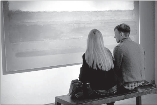
В центре Ротко можно побыть в тишине.

Свой 4-й день рождения Центр Ротко по традиции отметил открытием нового выставочного сезона. «Гвоздем» программы стала оригинальная картина норвежского художника Эдварда Мунка «Портрет адвоката Людвиг Мейера», которая впервые экспонируется в Латвии.