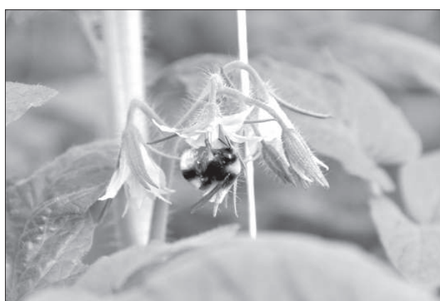
Шмели опыляют цветки ранних томатов.