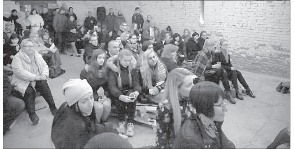
Второй сезон «Лавки» стартовал в крепости в малом пороховом складе.

Р. Спайде рассказывает, что вся организация строится за счет добровольных начал. Бюджет первого фестиваля в 2012 году составил 200 латов. «Нам этого было достаточно, тогда пришли