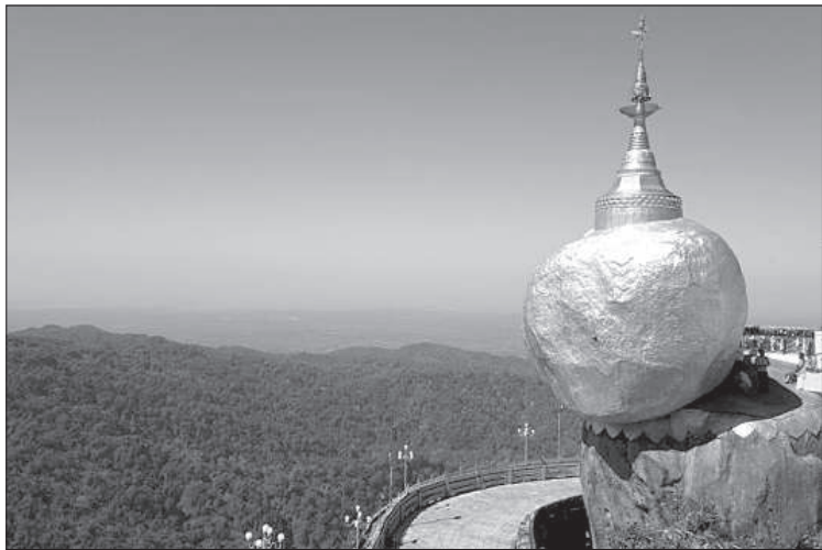
Третье по значимости святое место Мьянмы – золотая скала, очень популярное место паломничества.

придумали, что если они татуируют лицо, то не понравятся королю. И королю, естественно, женщины с такими лицами не казались красивыми. Но если сравнивать, то внешне жители Мьянмы – самые симпатичные из жителей Юго-Восточной Азии», – сказал Оскар.