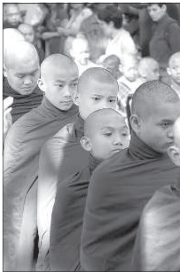
Буддистские монахи стоят в очереди за едой, пожертвованной людьми.

Благодаря буддизму в Мьянме тысячи храмов, большая часть – это шедевры искусства резьбы по дереву, которые уже восстановлены или их восстанавливают сейчас такими же инструментами, какими пользовались предки много столетий назад. В резьбе, в основном, изображены духи.