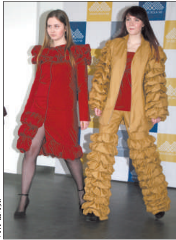
Коллекция «Полет пчелы».