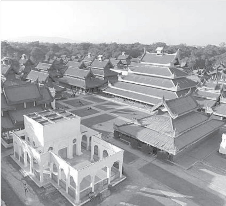
Последняя резиденция королей Мьянмы в Мандалае.

Мьянма граничит с Бангладешем, Тайванем и Китаем. В горах до сих пор живут племена, которые устраивают беспорядки, и, согласно легендам, там даже можно встретить людоедов. «У меня есть фотография женщины с татуированным лицом. Это древняя традиция, которая появилась тогда, когда король каждый год из каждого племени выбирал девушку для своего наслаждения. Тогда женщины, чтобы себя защитить,