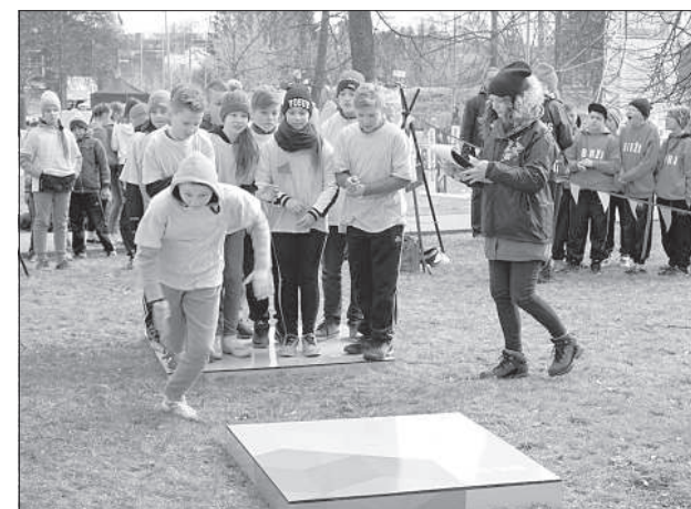
Только работая в команде можно добиться результата.

стов вошел 6а Дагдской средней школы, 6с класс 1-й Прейльсской основной школы и 5-й класс Риенбиньской средней школы. Среди 7-9-х классов в Юрмалу поедет 8-й класс Шпогской средней школы и 9-й класс 1-й Резекненской государственной гимназии. В группе старшеклассников повезло 10-му классу 1-й Резекненской государственной гимназии, 11-му классу Шпогской средней школы и 11-