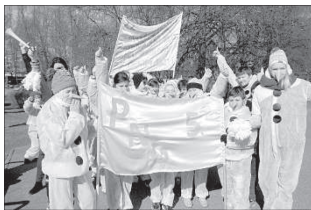
Снеговика из Плявиняса.

В течение двух дней Центральный парк Даугавпилса был заполнен детьми. Тысячи школьников съехались в город, чтобы участвовать в полуфинале чемпионата «ZZ» и побороться за выход в финал с небывалым призовым фондом – 50 000 евро. В этом году чемпионат ZZ проводится в 11-й раз, и Даугавпилс впервые принимал участников полуфинала.