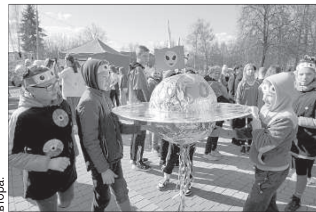
Дети изготовили для чемпионата летающую тарелку.

По результатам полуфинала в Даугавпилсе в финал в каждой из трех групп (5-6-е классы, 7-9-е классы и 10-12-е классы) отправятся по 14 команд из каждой. Среди группы 5-6-х классов в число финали-