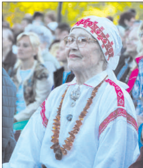
На праздник приехала главный дирижер Терезия Брока.