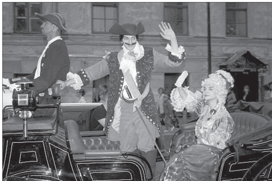
Петр I и Екатерина I открывают бал.

Во время международной акции «Ночь Музеев» в Даугавпилсе работали 11 крупных объектов. Помимо привычных экспозиций и экскурсий в этом году организаторы подготовили нечто особенное – Бал Марты в крепости.