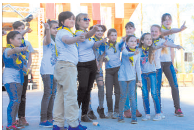
Творческая молодежь раскрасила праздник в цвета радуги.