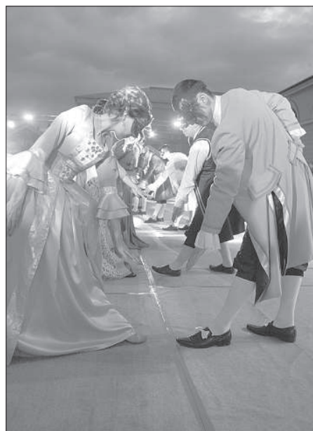
Участники праздника подготовили грандиозную танцевальную программу.