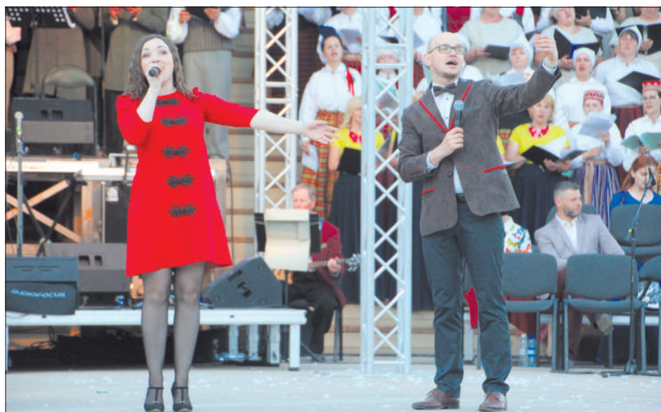
Группа «Borova MC» исполнила песню «Vysskaistuokū meitini».

Праздник латгальского искусства «Цвета на флаге» посвящен 100-летию