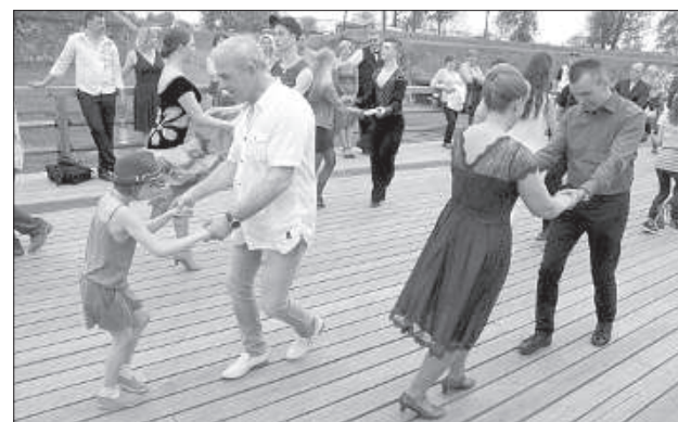
Обучение танцам проходило и на деревянном мосту.

Даугавпилсская городская дума – 800 Центр глиняного искусства – 1100 Крепость – 11400 Центр М. Ротко – 7000 Дроболитейный завод – 1300 Лютеранская кирха – 900 Музей шмаковки – 820