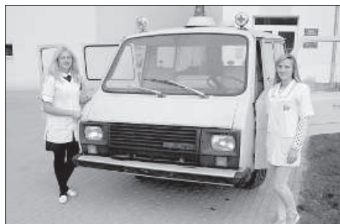
Даугавпилсский медицинский колледж впервые участвовал в «Ночи Музеев».