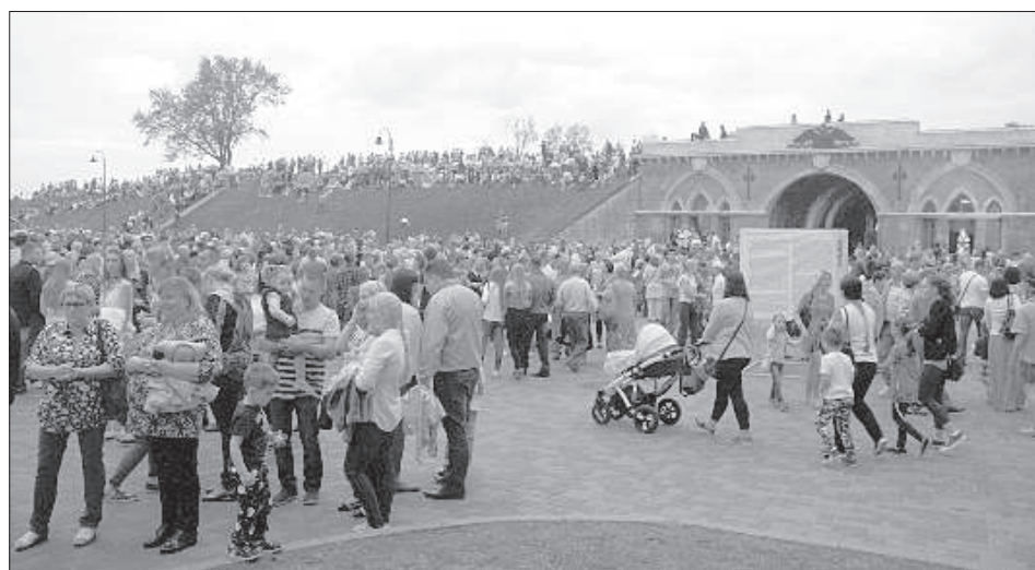
На «Балу Марты» в крепости был аншлаг.