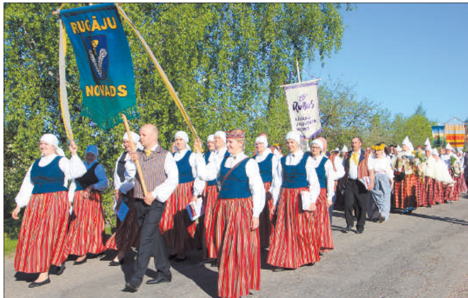
В шествии участвовали 70 латгальских коллективов.