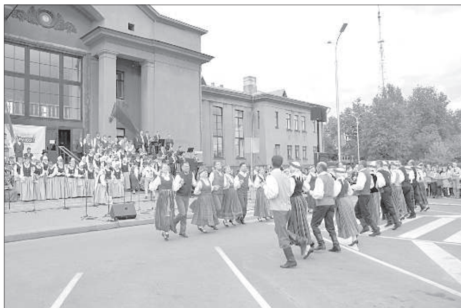
Площадь перед вокзалом оживила.