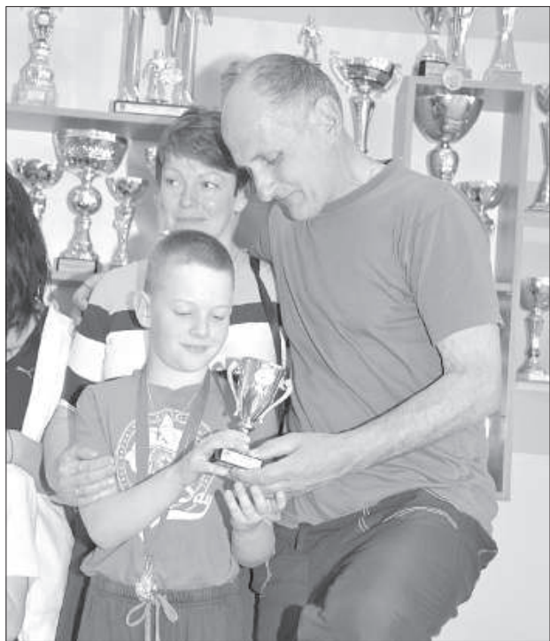
Семья Радзевич рада награде.