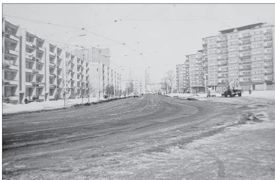
Снимок Л. Баулина, сделанный в микрорайоне химиков в 80-х годах.

Всего на выставке представлено два десятка фотографий, каждая из которых отражает виды Даугавпилса в 80-х годах прошлого столетия. Улицы, люди, заброшенные и населенные здания – все это оказалось в объективе эстета, который был не просто любителем, а серьезным знатоком фотоискусства и техники. Всего в арсенале Леонида Баулина насчитывалось 19 фотоаппаратов, самый особый из которых – «Москва-5». Каждая фотокамера использовалась для сво-