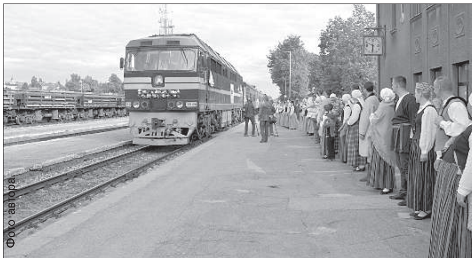
Даугавпилсские коллективы встречают праздничный поезд, прибывающий из Краславского края.

Даугавпилсский вокзал давно не видел столько гостей и встречающих – в пятницу, 26 мая, перрон заполнили танцевальные и песенные коллективы Латвии и Даугавпилса, а зрители собрались, чтобы встретить праздничный поезд-экспресс и насладиться народным творчеством.