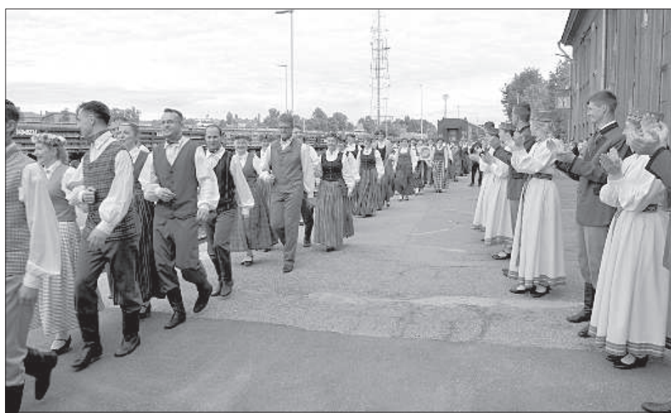
В Даугавпилс приехали рижские фольклорные коллективы.

духовой профессиональный оркестр «Даугава» и фольклорный коллектив «Svātra» Центра латышской культуры, а также ансамбль Даугавпилсского университета «Laima». На площади перед вокзалом они провели праздничный концерт, вместе спев и станцевав известные латышские произведения. Апогеем концерта стало исполнение песни «Saule. Pērkons. Daugava» на стихи Яниса Райниса и музыку Мартиньша Браунса. Ее зрители попросили повторить, что и было сделано. ■