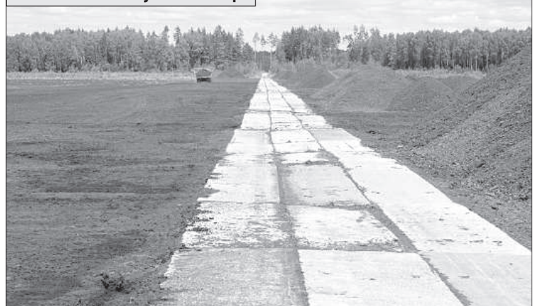
Подъездная бетонная дорога. По правой стороне дороги горки с готовым сырьем. Слева торфяное поле, на котором собирают фрезерный торф.

Болото, как бизнес-проект, имеет смысл, если глубина торфяного слоя составляет не менее 2 метров, а площадь территории выработки составляет минимум 25 гектар.