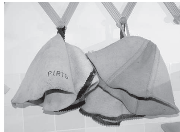
Идя в парилку, нужно обязательно надеть банную шапочку.