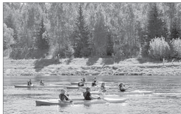
В этом году лодки-каное оказались стабильными и безопасными.