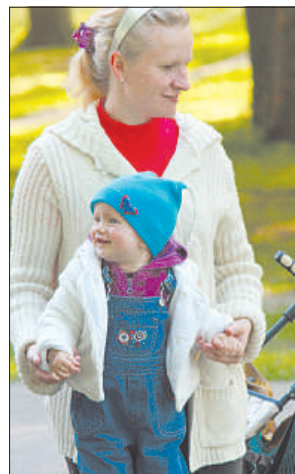
Концерт пришелся по душе как взрослым, так и детям.