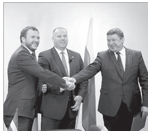
Министр обороны Эстонии Маргус Цакна, министр обороны Латвии Раймонд Бергманис и министр обороны Литвы Раймундас Кароблис.

Главный вопрос, который обсуждали министры — безопасность в регионе. «Одна из тем — как у нас происходит реализация принятых решений на саммите НАТО в Варшаве. Это очень важный вопрос для каждой из стран Балтии. Ясно, что это не просто сделать, но в короткие сроки мы провели большую работу. Также об-