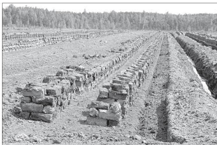
Ряды кускового торфа сушат на солнце. За сезон рабочие вручную перекалывают их 2-3 раза. После просушки сырье отправят в Германию, Италию или Нидерланды.

Латвийская ассоциация производителей торфа)