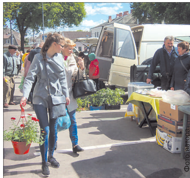
Покупатели приобретали овощи, зелень и саженцы.

Зато у нас очень богатый ассортимент, и в первую очередь, мы предлагаем необычные ягоды. По словам А. Зеляники, из-за превратностей погоды полакомиться дарами сада можно будет лишь через 3-4 недели. «У нас растет голубика, 20 сортов малины, шелковица, жимолость, гибридные земляники и клубники. Сейчас стараемся прикупить ягоду гуме, но вот в Латвии ее не найти», – рассказала хозяйка. Первые покупатели появились на рынке буквально через пару минут после его открытия. Основной интерес, конечно, представляла свежая зе-