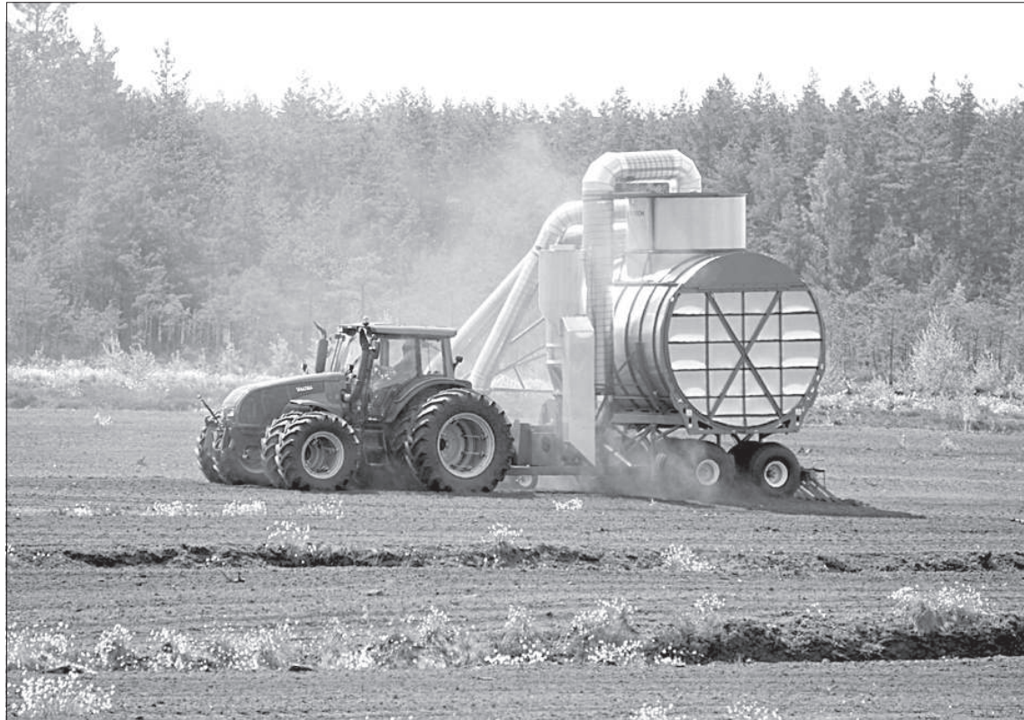
Специальный аппарат по сбору фрезерного торфа. Трактор тянет агрегат, приобретенный в Канаде, который, как пылесос, втягивает сырье в бункер, затем оно отгружается на край дороги.