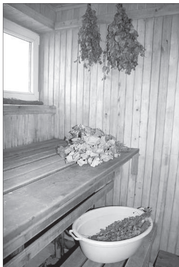
Для одних баня — это место отдыха, для других рабочий «кабинет».

раз в неделю, чаще — не рекомендуется, потому что потя организм теряет много нужных солей. Перед тем, как зайти в парилку, обязательно нужно надеть банную шапочку, чтобы не допустить перегрева головы. Дабы компенсировать потерянную в бане жидкость, банщик рекомендует пить различные травяные чаи или чистую воду. «Газированные и алкогольные напитки во время посещения бани употреблять нельзя, а вот после бани бокал пива не причинит вреда», — говорит банщик.