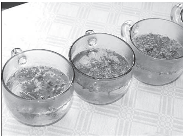
В банном ритуале пригодится травяной чай.