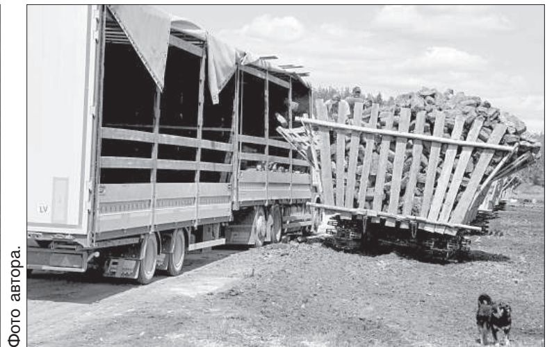
Рабочие загружают машину кусковым торфом. Груз затем отправится в одну из стран ЕС.

Торфяное поле – ровная гладь, которую каждые 20 метров разделяют специальные каналы до двух метров глубиной, они являются частью большой мелиорационной системы. Руководитель работ Михаил