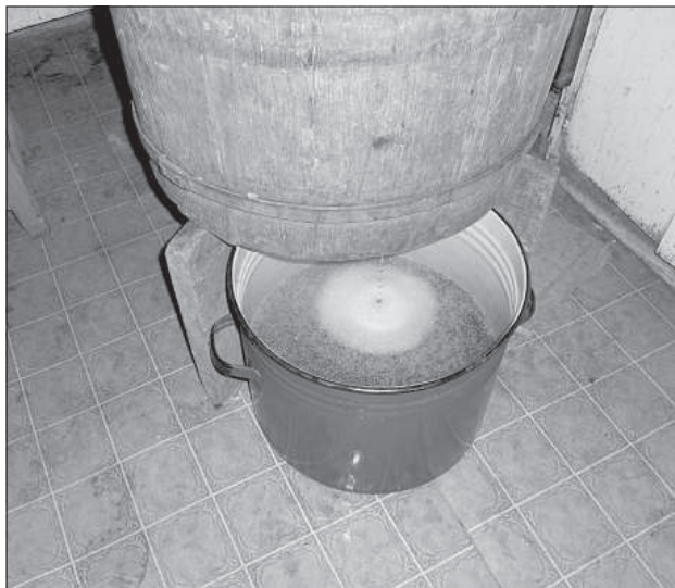
Когда пробка вытащена — течет первое вкусное пиво.

В этом году для Лиго хозяева пиво варят в три этапа. Напиток уже готов и пивовар потихоньку раздает его соседям, родствен-