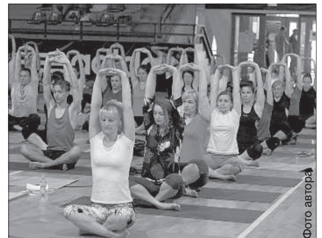
Все желающие могли попробовать свои силы.

Если взять сухую интернет-справку, то йога — это религиозно-философское учение Индии, разработавшее систему и методы самопознания человека, управление собственной психикой и физиологическими процессами организма, система физических упражнений, способствующая такому управлению. На самом же деле понятие йоги гораз-