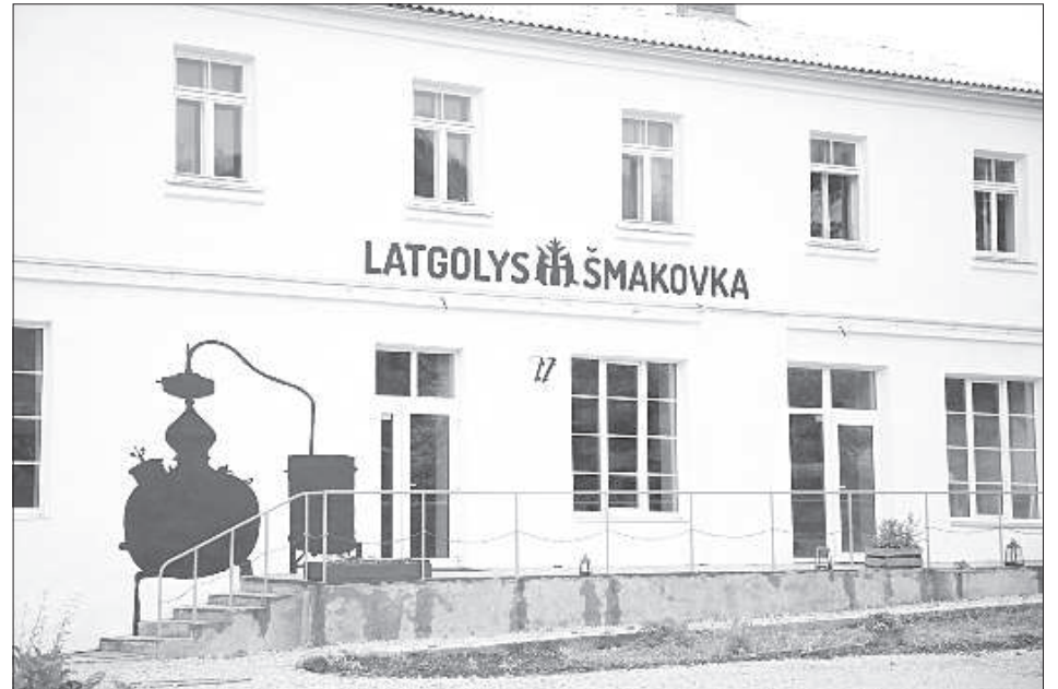
Вход в музей шмаковки.