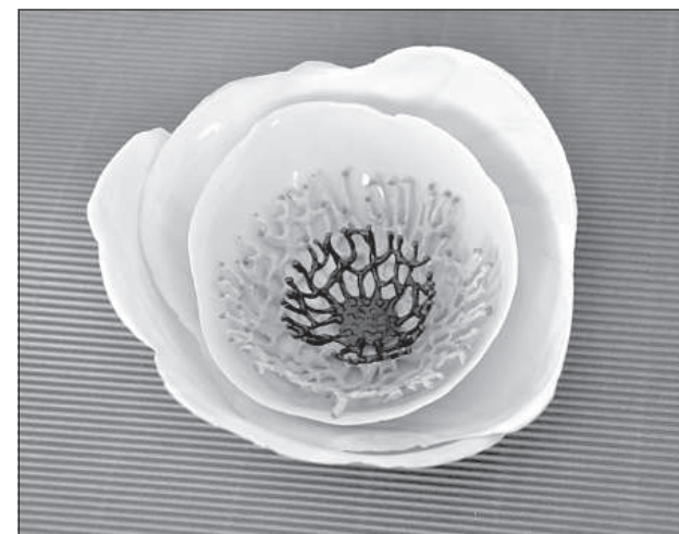
Толщина фарфоровых лепестков всего 3 мм.

В ответ на вопрос, отражает ли мастер в своих