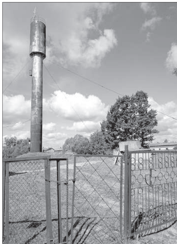
Станция водоснабжения Ницгале давно нуждается в обновлении.

«Уже 6 июля эти водяные фильтры должны быть установлены на станции, — рассказывает Ю. Кокарс. — Вместо старых фильтров с кварцевым песком мы получим эффективное современное оборудование. После этого качество воды точно должно будет измениться в лучшую сторону». ■