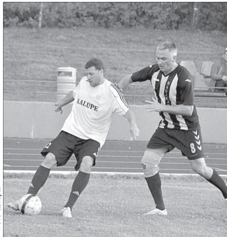
Игра команд из Калупе и Науене.