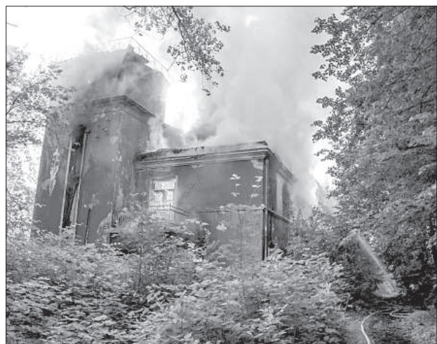
Горит здание бывшей столовой санатория «Межциемс».

Вечером 5 июля на улице Даугавас в микрорайоне Межциемс произошло сразу два серьезных пожара — горел одноэтажный жилой дом и столовая бывшего санатория. По информации старшего специалиста отдела превенции и информирования общестественности Государственной пожарно-спасательной службы Андрея Смирнова, площадь первого пожара составила 90 кв. м, а второго, который был классифицирован как пожар повышенной степени опасности, 650 кв. м.