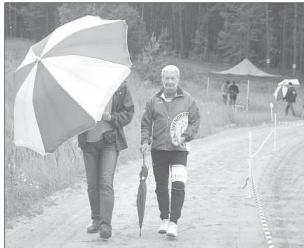
Участников по трассе сопровождает помощник с зонтом, чтобы скрыть расположение флагов.

С 7 по 9 июля в Даугавпилсе проходили соревнования международного класса — 5-й и 6-й этапы Кубка Европы и чемпионат Латвии по трейл-ориентированию. Данные соревнования собрали большое количество участников со всего мира, большинство из которых впервые приехали в Латвию.