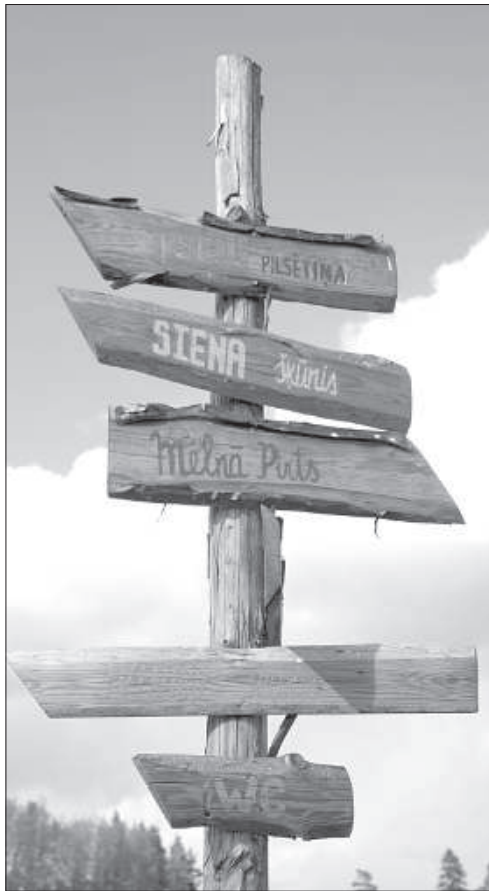
Указатели помогают не заблудиться в «Meža skuķi».