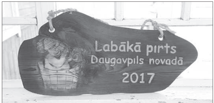
Награда в банном ралли.

варил пиво, в основном, на праздники. Сам пивовар уже умер, но о старинном ремесле свидетельствуют белые отметины в бане, обозначающие количество ведер с суслом.