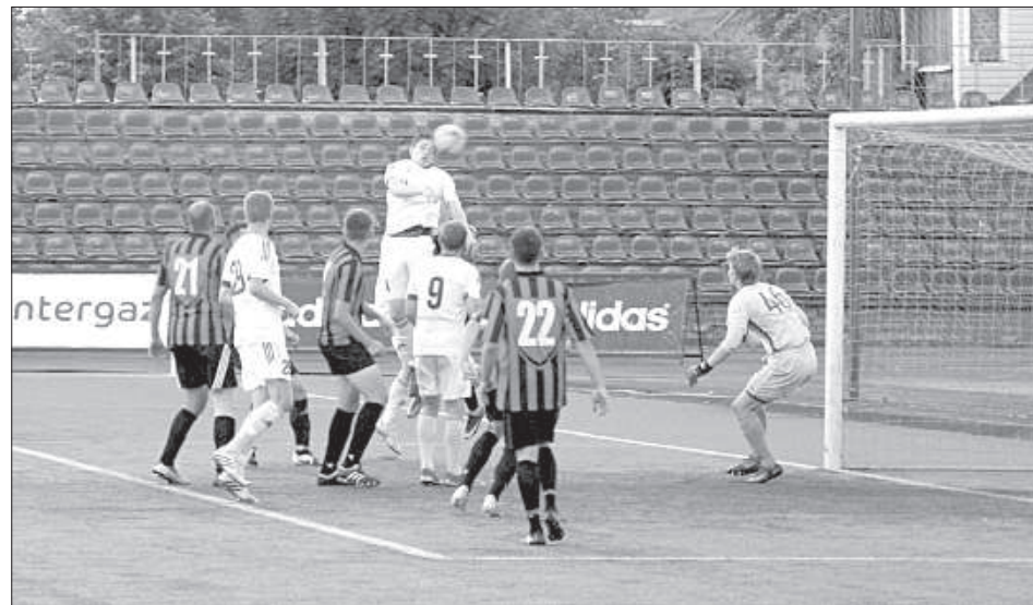
Успешная игра на «втором этаже» после углового — мяч в сетке.