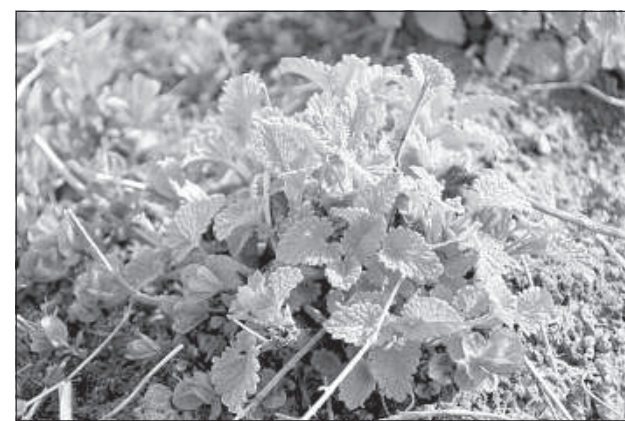
Мята для успокаивающего чая.

лях, растила детей. Навыки архитектора все же пригодились: для родителей спроектировала баню, а потом началось и ее новое увлечение. В эту баню сначала приезжали только друзья, а сейчас там постоянно кто-то есть. С тех пор,