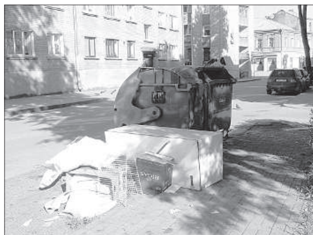
Проблема разбросанного мусора остается актуальной (контейнеры на ул. Краславас).