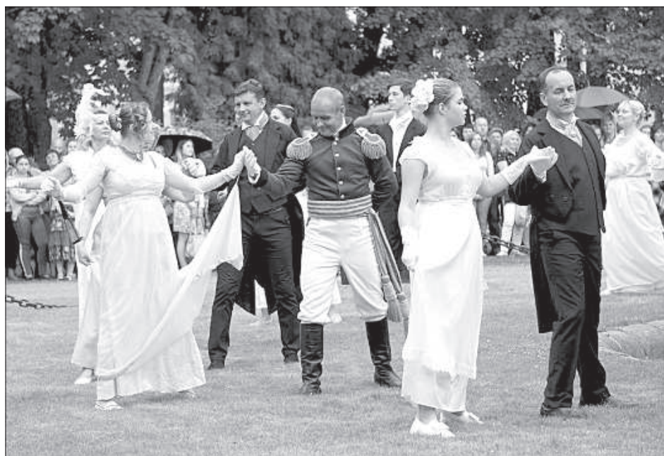
Бал Наташи Ростовой в крепостном саду.