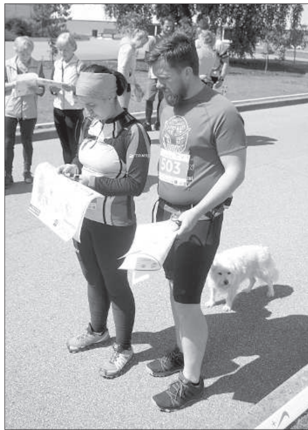
Участники знакомятся с картой соревнований.

Рогейн (рогайнинг) зародился в 40-х годах 20-го века в Австралии, но лишь в 70-х по нему начали проводить серьезные соревнования. Первый чемпионат мира по рогейну прошел в 1992 году. Этот командный вид спорта сочетает в себе стратегию и тактику, навигацию на пересеченной местности, а также физическую выносливость. Цель команд — набрать за установленное время максимальное количество очков, которые начисляются за посещение контрольных пунктов, установленных на местности и обозначенных в карте соревнований. Традиционная продолжительность соревнований по рогейнингу — 24 часа, но проводятся и более короткие состязания.