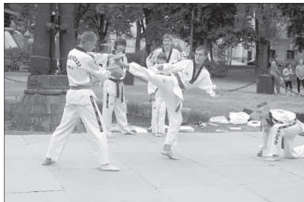
Показательные выступления Латгальского центра таэквондо «JITAE».

рнуть силу рук у Даугавпилсского спортивного клуба по пауэрлифтингу, а также остроту ума за шахматной доской. Многие участвовали в квесте, задания которого располагались в разных частях крепости и для их решения требовалось хорошенько подумать. Параллельно около Центра искусств Марка Ротко проходил праздничный концерт.