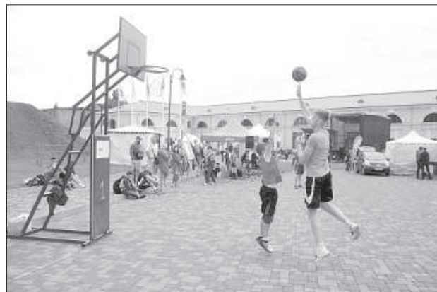
Соревнования по стритболу.