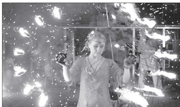
Огненный спектакль уличного театра «Pololo».