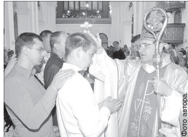
Епископ совершает таинство миропомазания.