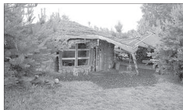
Дом из дерева и глины.