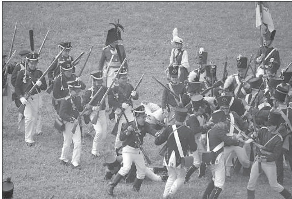
Реконструкторы сражались с улыбкой на устах.

Александр Рубе 15 июля в Даугавпилсской крепости состоялся третий фестиваль военно-исторической реконструкции «Динабург 1812». Участниками стали клубы из Латвии, Литвы, Польши, Белоруссии, России и Великобритании. Хотя общее число участников постановки оказалось меньше, чем планировалось, это не помешало устроить отличный показательный бой между Русской императорской армией и войсками Наполеона.