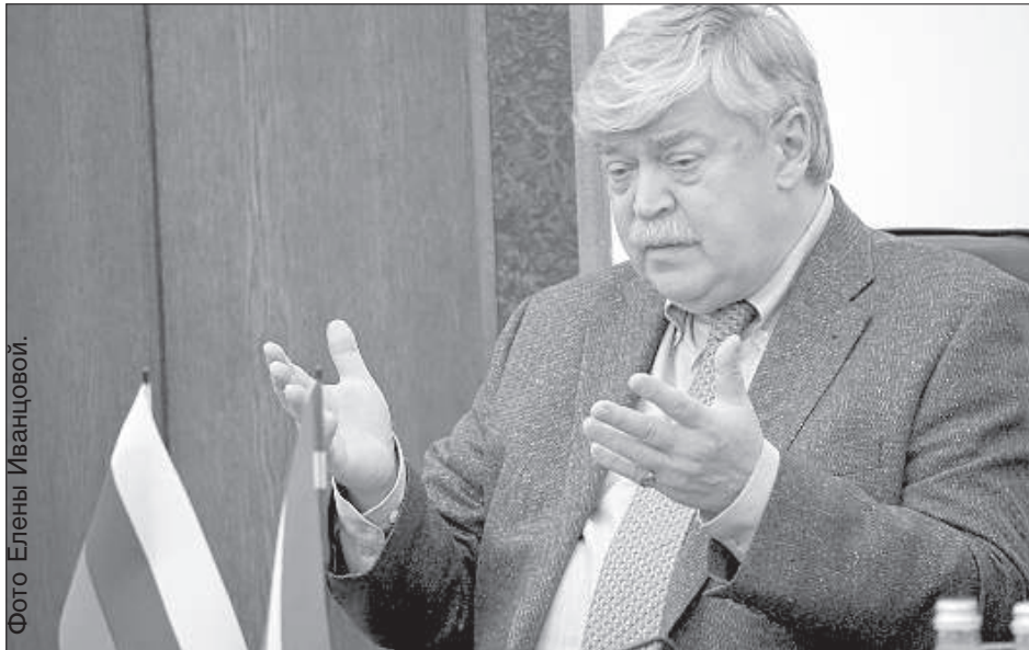
Посол России в Латвии Евгений Лукьянов.

На вопрос об общем характере развития дипломатических отношений