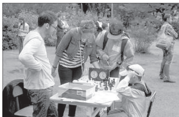
Шахматы — сложная игра.