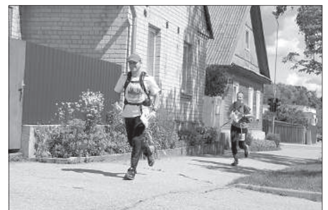
Спортсменам в поисках пунктов приходилось преодолевать большие расстояния.