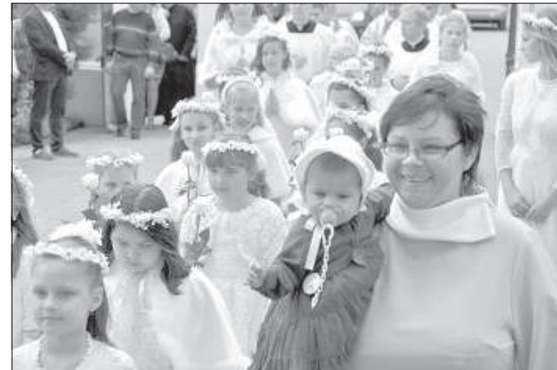
Епископа встретили десятки детей.

В проповеди епископ подчеркнул, что верующие должны читать Святое Писание, оно способно изменить сердце и жизнь каждого человека, и что молитва – это самый короткий и плодотворный разговор с Богом.