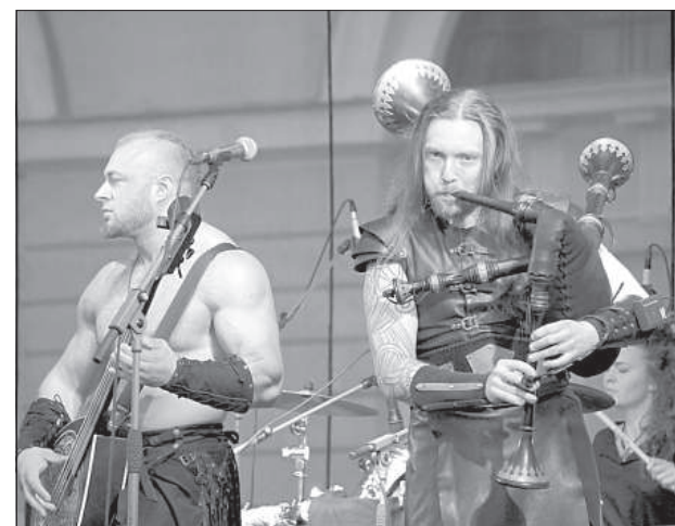
Выступает группа «Obscurus Orbis».