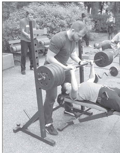
Все желающие могли попробовать свои силы в жиме штанги.

Артем Сталидзанс В рамках празднования фестиваля клубов исторической реконструкции «Динабург 1812» в Даугавпилсской крепости проходил день семьи, молодежи и спорта. Все желающие могли активно провести время, участвуя в разных соревнованиях и аттракционах и ближе знакомясь с деятельностью местных спортивных клубов.