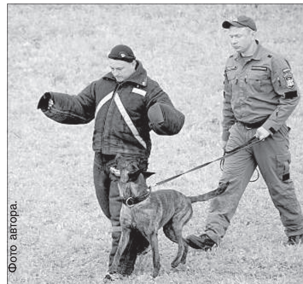
Показательные выступления кинологов.

По подсчетам Я. Островского, количество зрителей составило около 8000: «Скорее всего, в следующем году мы обеспечим прямую трансляцию боя во дворе Центра искусств Марка Ротко – это позволит разгрузить валы и будет удобным для сениоров». ■