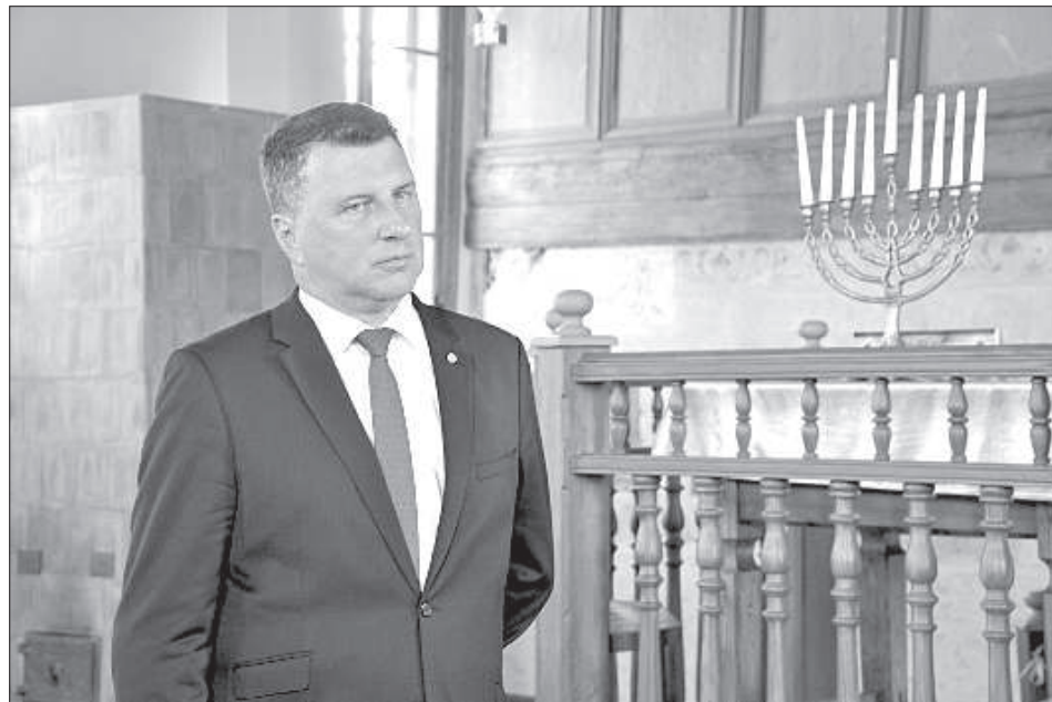
В Большой Лудзенской синагоге.