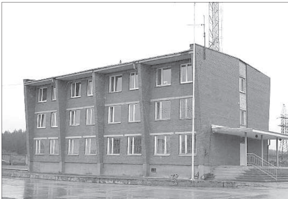
Жилое здание комплекса.