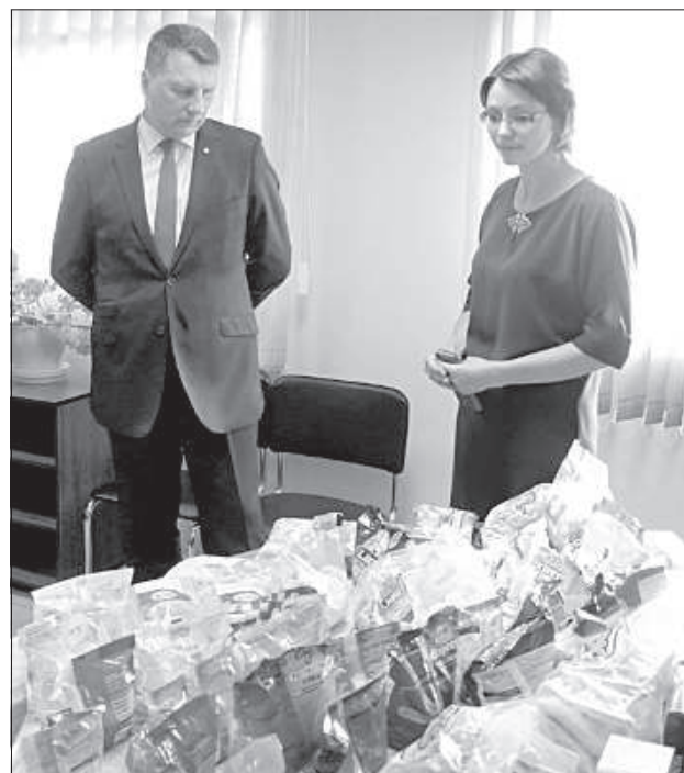
Предприятие «Ariols» — крупнейший налогоплательщик Лудзенского края.