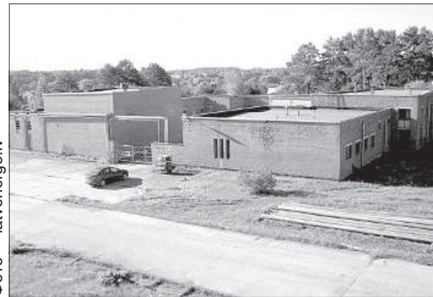
Хозяйственные помещения и гаражи базы «Latvenergo».