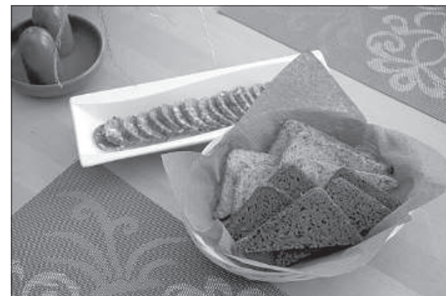
Вкусный хлеб из «Rudzuprūķes».

Всего можно получить призы в шести категориях: «Сельское хозяйство года», «Биологическое сельское хозяйство», «Домашнее производство года», «Семейный сельский двор», «Успешный молодой крестьянин» и «Проект LEADER года в местной группе». На конкурс «Хозяин 2017» заявлены еще четыре хозяйства. Комиссия тоже поедет к ним, чтобы осенью можно было торжественно чествовать победителей. ■