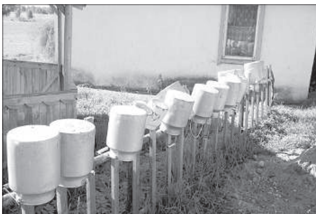
В приусадебном хозяйстве «Saulsstarti» бидоны для молока заодно являются элементом дизайна.

Особо строгие критерии нужно соблюдать хозяйствам, которые являются биологическими.