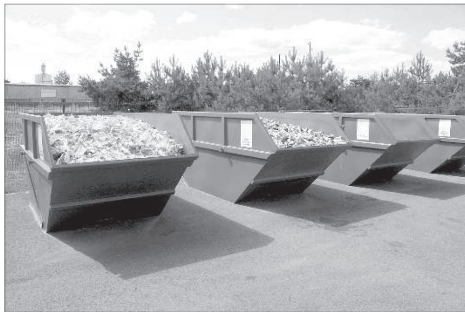
Контейнеры с отсортированным мусором.