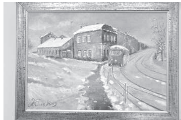
Красный трамвай курсировал в Даугавпилсе в 60-70-е годы.

Особенно хорошо получилась написанная в 70-е годы Храмовая горка, картина называется «1905-й год». «У меня часто спрашивают, как я мог написать начало прошлого века. Рассказываю исторические факты, что все три храма были построены в 1905 году. Если присмотреться внимательно, можно