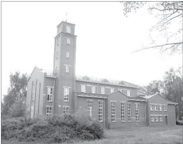
Строящийся храм Милосердия Божьего.

В основном, все церкви на территории Даугавпилса и Даугавпилсского края были построены век и более назад, и многие поколения рождались, росли и жили рядом с ними. Но в «электронном» и стремительном 21 веке храмы тоже возводятся, а это значит, что в них есть потребность.