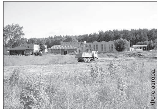
Напротив нефтебазы строятся первые частные дома.

«В настоящий момент ведется строительство пяти объектов, — объясняет руководитель строительного управления Валерий Лякса. — Процесс немного осложнен тем, что поблизости находятся затапливаем-