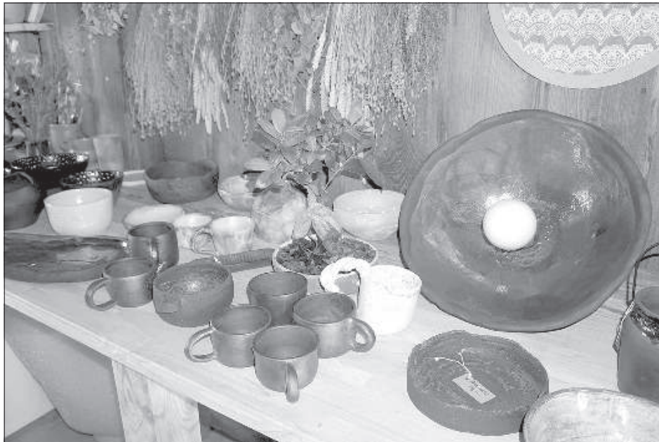
На данный момент мастерская «Jašas podi» полна изделий черной керамики.

С керамикой Кристине начала работать всего год назад. Сначала в одном журнале нашла инструкцию, как своими руками сделать посуду, и прочитала о возможности посетить курсы керамики в Даугавпилсе. Планы нарушило известие о будущей дочке, а поскольку бере-