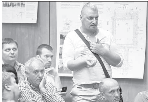
Слово было дано десятку жителей и старших по дому.

16 августа в Даугавпилсской думе состоялась встреча жильцов и старших многоквартирных домов с руководством города и представителями Предприятия жилищно-коммунального хозяйства. Пообщаться с политиками и ответственными лицами пришло более сотни человек.