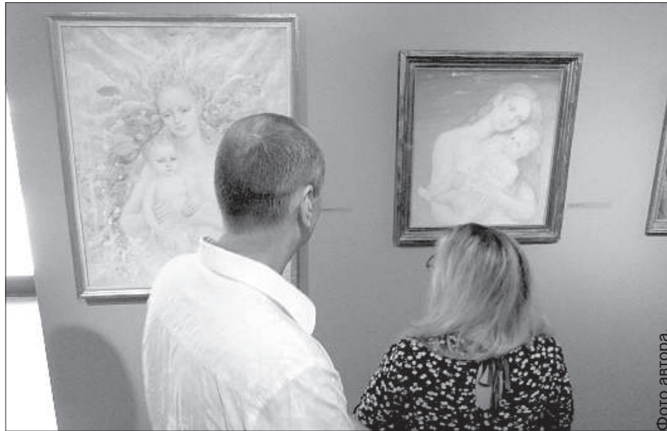
Работы белорусского живописца.