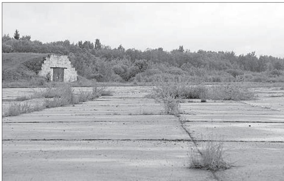
Взлетное поле зарастает травой и кустами.