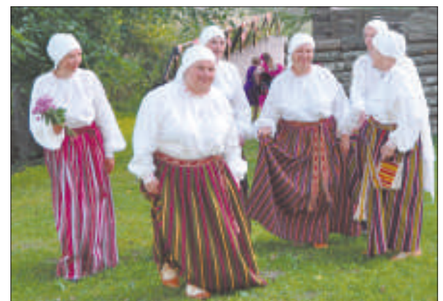
Индрские ткачихи в новых народных костюмах.

исполнили неофициальный гимн Индры – латгальскую народную песню «Rūžēņa» и обещали сделать головные уборы и жилеты.