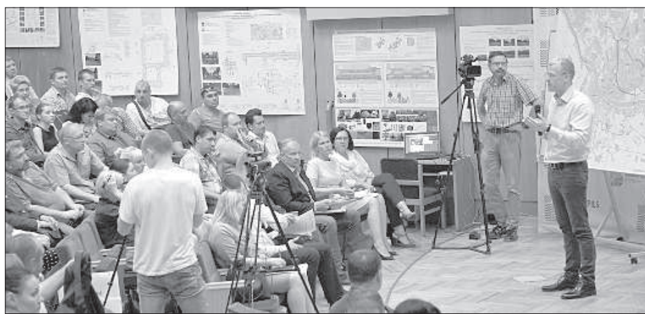
На встречу явилось более 100 жителей города.

Отдельной темой разговора стали бытовые отходы и их вывоз. Председатель думы рассказал аудитории о предприятии, которое заменит «Clean R». Муниципальное общество капитала SIA «AADSO» начнет выполнять свои обязанности с 1 октября. Тогда же должен будет снизиться и тариф за вывоз отходов – с 7,31 евро за куб. м до 7 евро. Но экономия продлится недолго – до 1 января 2018 года, когда вступит в силу новый налог на природные ресурсы. Городская дума надеется контролировать