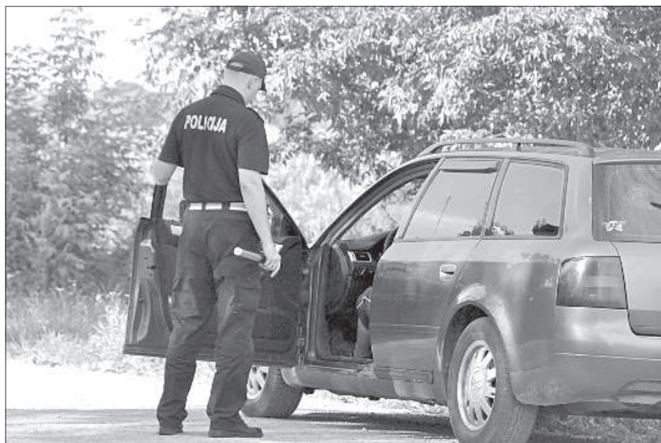
Полиция остановила машину, которая двигалась со скоростью более 70 км/ч.