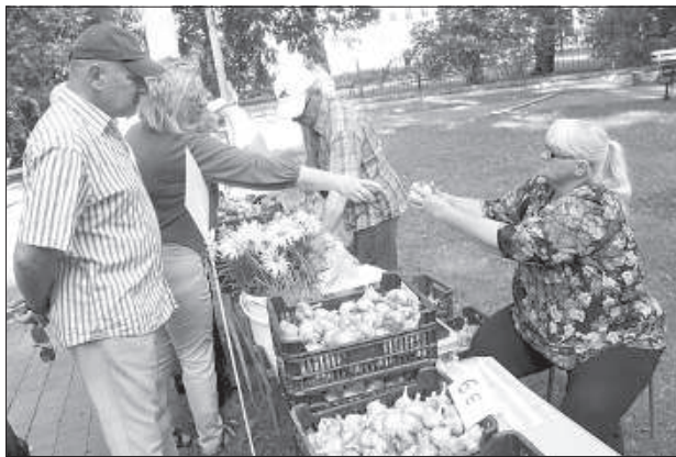
Торговцы интересно и подробно рассказывали о своей продукции.