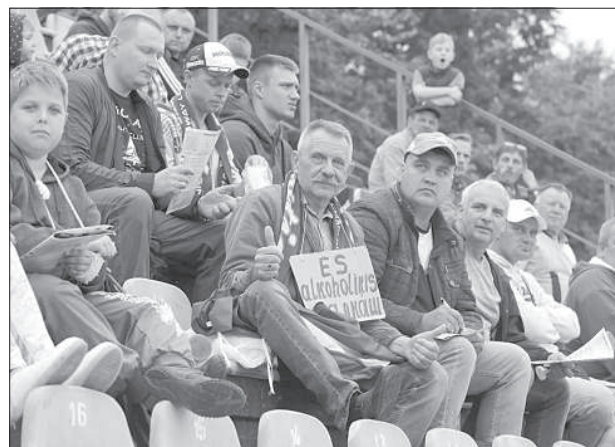
Болельщики не оставили без внимания тему о том, что «все фанаты спидвея - алкоголики».