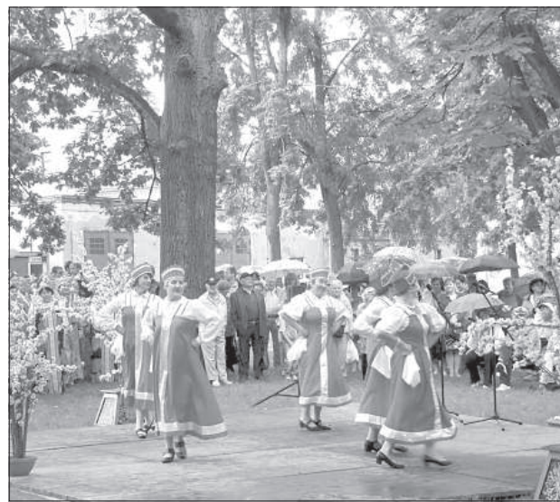
Танец ансамбля «Sapnis».

Второй фестиваль галереи современного искусства проводится бесплатно. ■