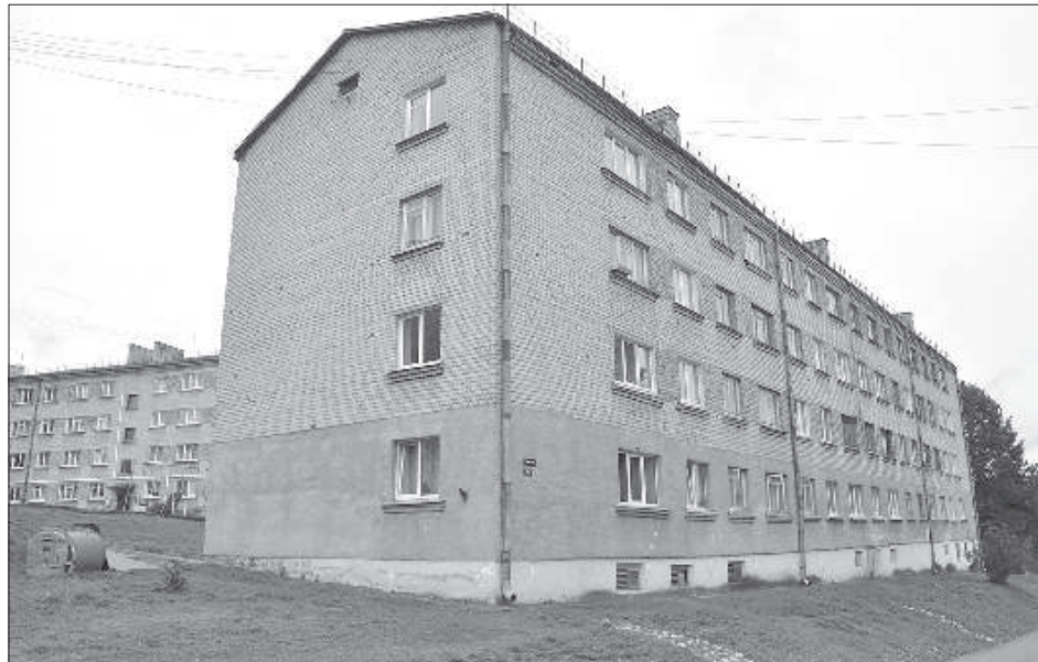
Многokвартирный дом на ул. Райня, 4 находится на холме, а не на твердом основании.