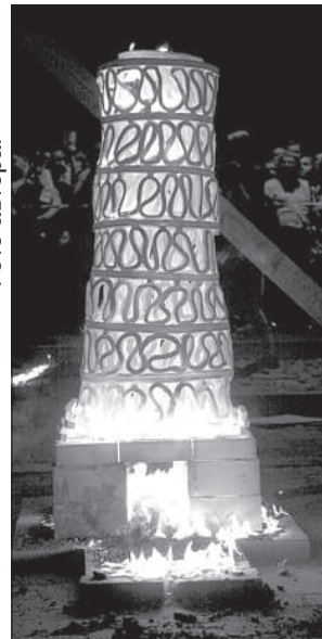
Только что «родившиеся» из печи скульптуры.

Планируется привлечь 5-7 больших и малых пивоваров из Даугавпилса, Резекне, Краславы и других мест. Ярмарка ремесленников в рамках этого события не предусмотрена, зато можно рассчитывать на широкий ассортимент закусок от местных сельских производителей. Ведутся переговоры с коллекционерами, собирающими кубки, этикетки, подставки, пробки и другие неотъемлемые элементы пивной культуры. Необходимо еще решить, каким образом коллекции будут защищены от посягательства воришек, однако собиратели с большим оптимизмом смотрят на свое присутствие на фестивале.