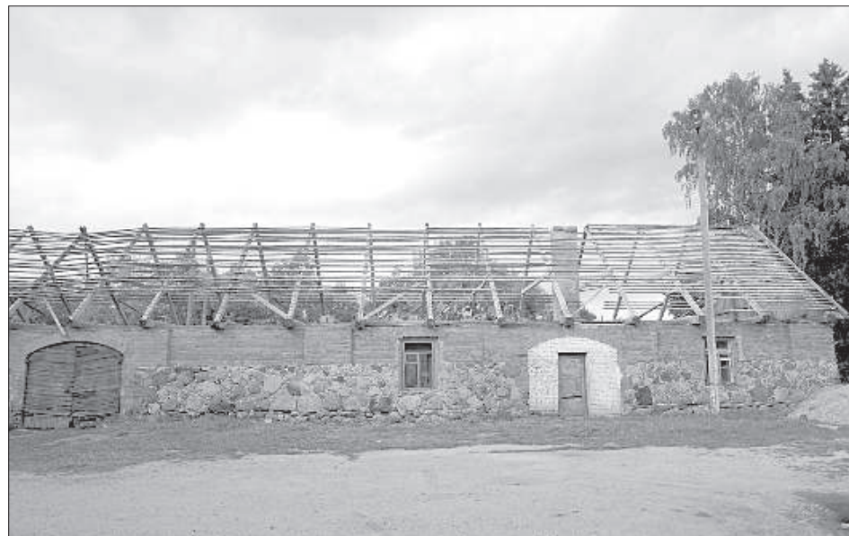
Когда у здания сняли крышу, обнаружилось, что придется менять некоторые балки.

на его осуществление. За выделенные деньги планируют отремонтировать пол, потолок, стены, сделать помещения для учебы и отдыха, кухню, выставочный зал для трофеев. Когда сняли крышу, обнаружили, что некоторые балки начали гнить, их придется менять за свои средства. В будущем планируют сделать помещения для первичной обработки охот-