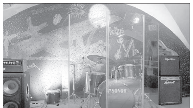
Сцена для музыкантов.