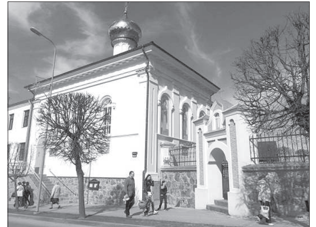
Храм стал жемчужиной туризма.

ходу пришлось согласовать с Государственной инспекцией по охране памятников культуры. Батюшка сказал: «На Рождество увидели, что осыпается краска с потолка, потом обнаружили другие проблемы, например, прогнивший пол. Со временем обветшали потолочные перекрытия, оконные рамы, входная дверь. Строители все восстановили и подарили нам новую дверь, отделяющую зал для молитвы от рабочего помещения. Войдя в храм, прихожане удивлялись красивому иконостасу и