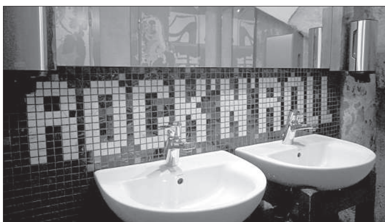
Даже туалеты – в стиле «рок-н-ролл».