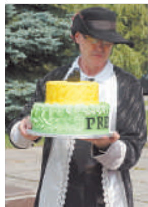
Местные предприниматели организаторам праздника подарили торт с символом города – вороном.

На фестиваль приехали мастера из 13 стран. «Отправлялись в Латвию,