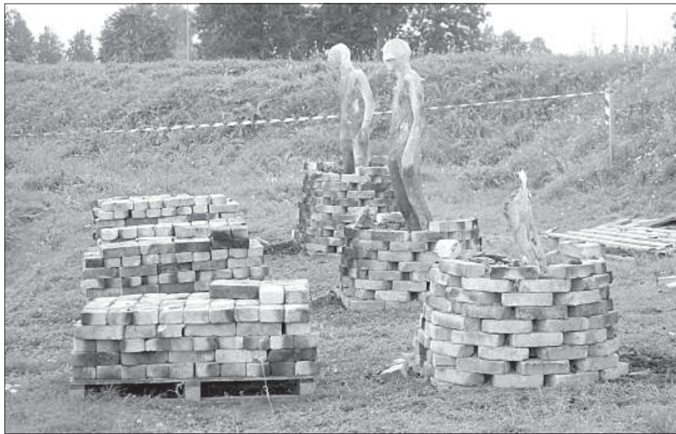
Результаты еще одного обжига скульптур в рамках фестиваля.

Кульминацией 5-го международного симпозиума керамического искусства «Ceramic Laboratory» и 1-го Латвийского международного фестиваля современной керамики стало открытие огненных скульптур, которые в ближайшем будущем украсят город.