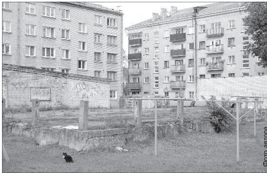
Развалины в центре города начнут сносить в ближайшее время.