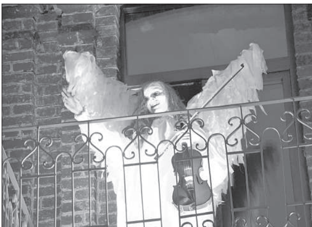
Ангел играл на скрипке на балконе.