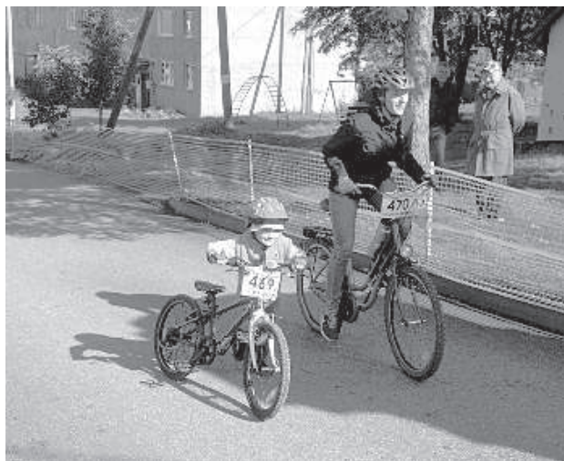
Финиш семейного заезда.

16 сентября в Свенте проходил МТВ веломарафон, который стал шестым этапом серии гонок «LiVelo Kauss kalnu rīteņbraukšanā 2017». Более 100 любителей активного образа жизни в этот день пожелали выйти на старт и бросить вызов латгальскому бездорожью и огромным лесным лужам с грязью.