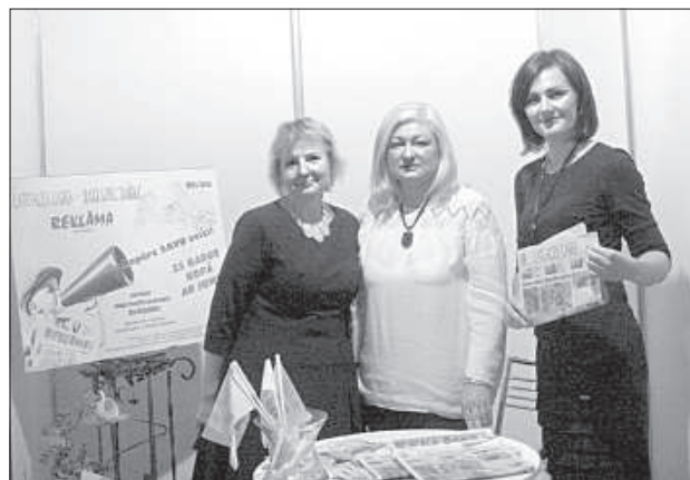
«Латгалес Лайкс» — подписка началась!