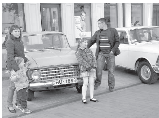
Фото на память с ретроавтомобилем.