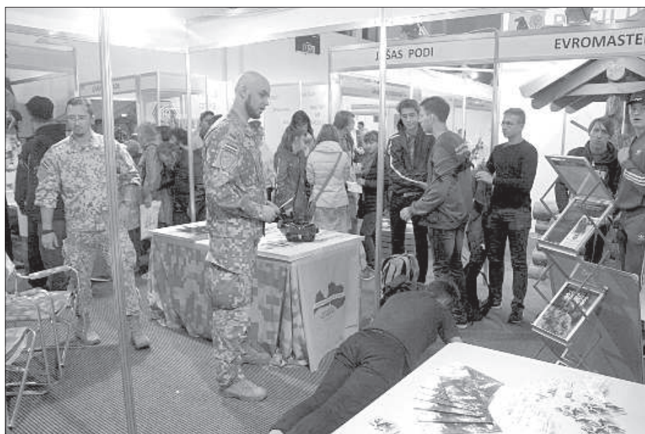
Отжимания — юноши проверяют свою пригодность для служения в НВС.

Обычные жители интересовались предложениями финансовой институции «Altum». Из-за недавних проливных дождей многое стали задаваться вопросом о смене