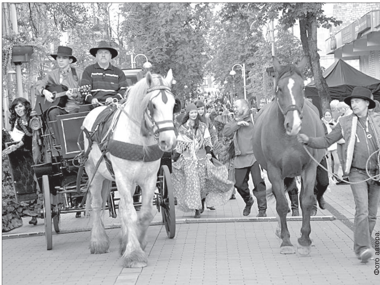
По улице ходил веселый цыганский табор.