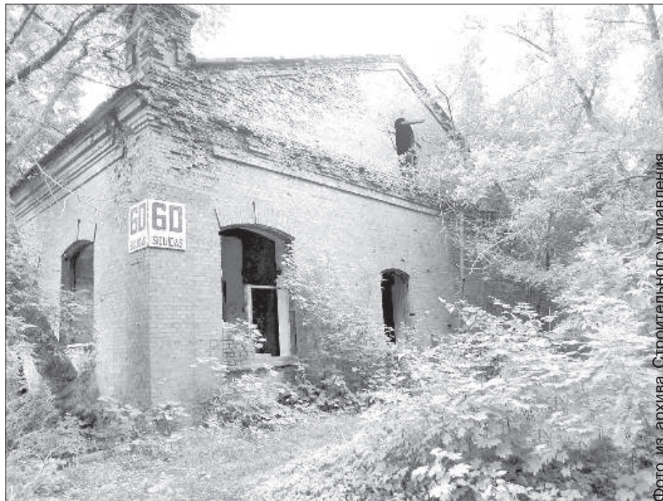
Здание из красного кирпича на ул. Сигулдас не заколочено.