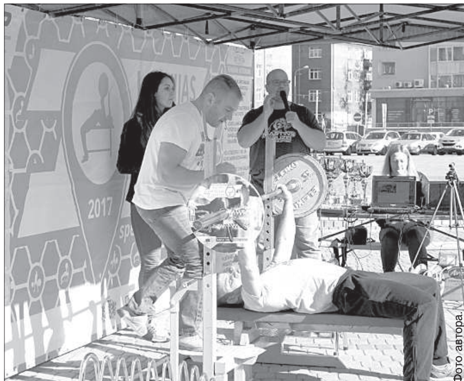
Все упражнения делались с подстраховкой.

Лудза, Дагда и Ливаны на этих соревнованиях оказались на 5-м, 13-м и 15-м местах соответственно. ■