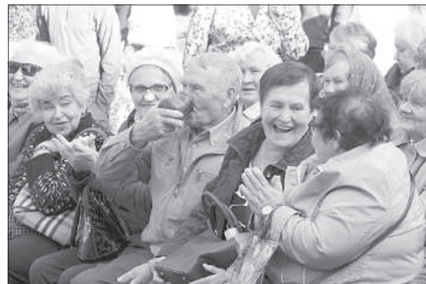
Зрители наслаждались концертом и угощением.