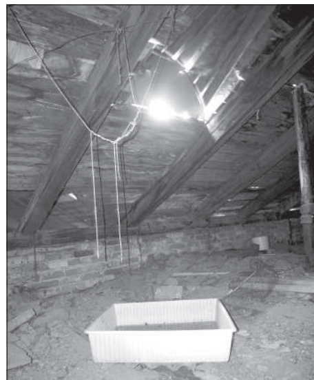
Один из тазиков на чердаке.