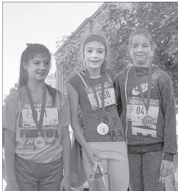
Девочки – медалистки дистанции на 800 метров.