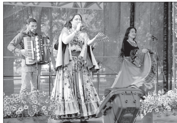
Выступление фольклорной цыганской шоу-группы «AME-ROMA»