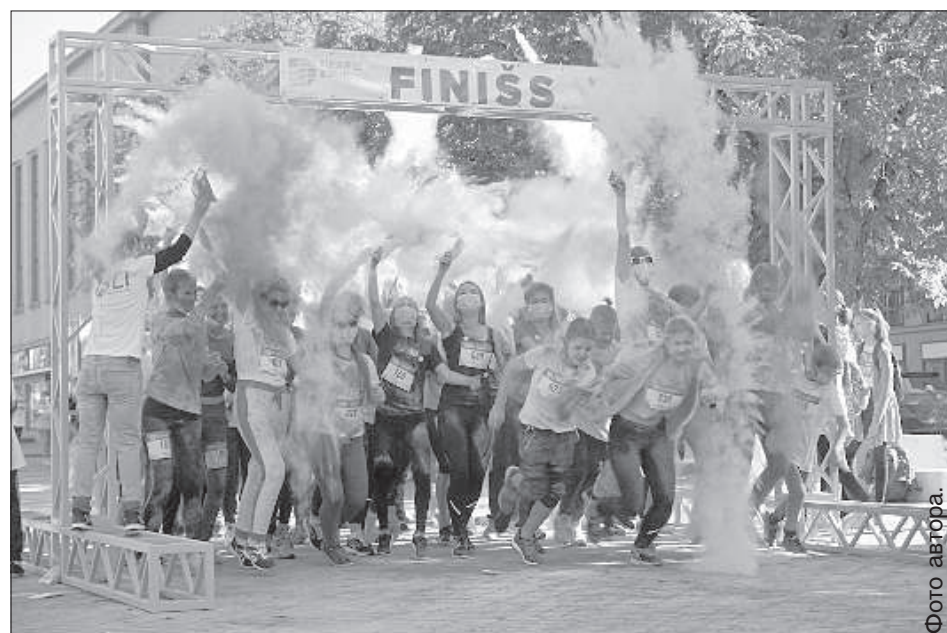
Старт семейного забега.

Большую часть работ по организации забега взял на себя департамент молодежи и спорта Даугавпилсской гордумы, в особенности кура-