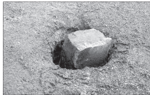
Провал ливневой канализации.