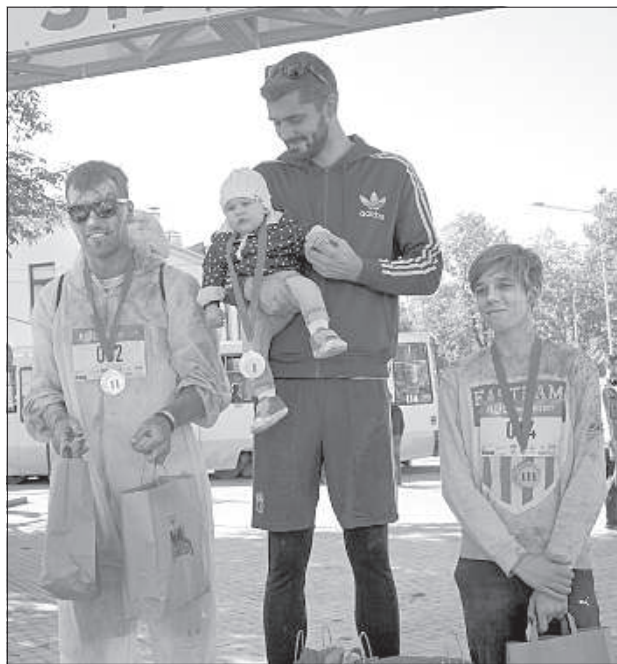
Победители семейного забега среди мужчин.

В воскресенье, 24 сентября, в Даугавпилсе во второй раз состоялся красочный забег «Holi Run», который собрал более двухсот бегунов. В этот раз дети оказались в большинстве – они с радостью красили себе волосы, валялись в красочной пыли и проносились сквозь цветные облака.