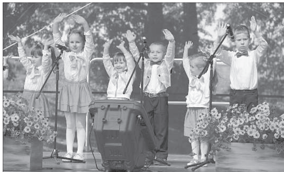
Выступлением радовали дети Даугавпилсского края.