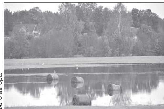
Воды реки Оша омывают луга и окружают пастбища.