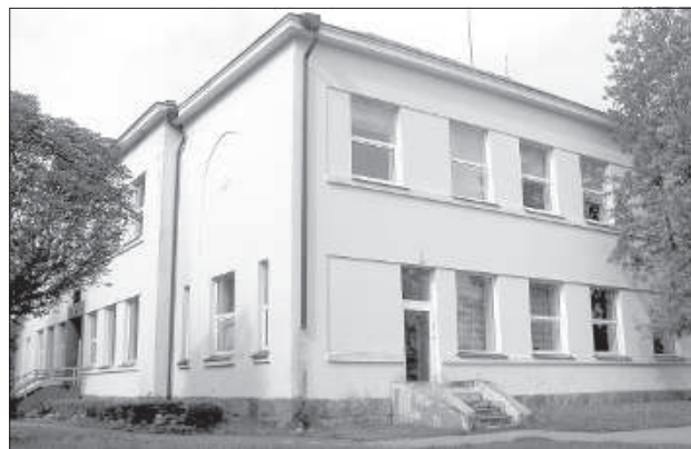
Здесь будет музей.

Не всегда закрытые школы стоят бесхозными и заброшенными, в Латгалии есть хоть и немногочисленные, но положительные примеры возрождения зданий к жизни, один из них — бывшая Калниешская основная школа Краславского края.