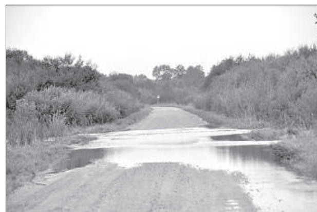
Восстановление дорог самоуправления будет стоить по крайней мере, 100 000 евро.