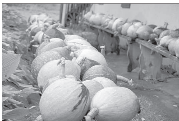
Убран урожай тыкв.

В хозяйстве акцент ставился на мясное животноводство, производство зерна и выращивание тыкв. «Сначала тыквы мы выращивали для производства детского питания, но в данный момент это уже не так выгодно», — хозяин поясняет, что это связано с высокими требованиями качества для сырья этого специфического питания. Теперь хозяйство переориентировалось на выращивание тыкв, предназначенных для продажи и получения тыквенных семечек. «Выращиваем тыквы специальной породы, которые сразу же перемалывают на поле, и семена отделяют от остальной массы», говорит хозяин. «К сожалению, это пустой год, выросла примерно только