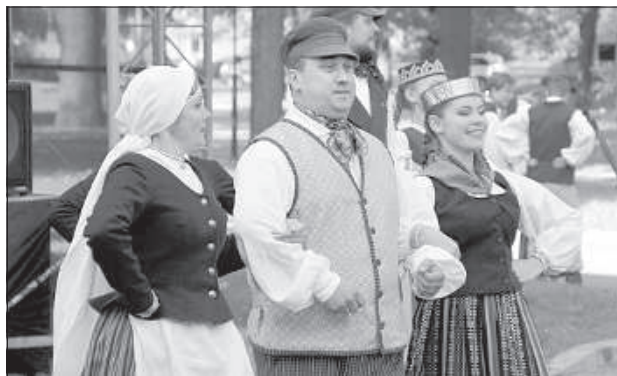
Коллектив Даугавпилсского края «Liksme».

На протяжении всего мероприятия посетители развлекались творческие коллективы из Амбельской, Бикерниекской и Науенской волостей, гости из Белоруссии, центра культуры «Vāgra». А выступление фольклорной цыганской шоу-группы «AME-ROMA» стало ярким финалом всего мероприятия. ■