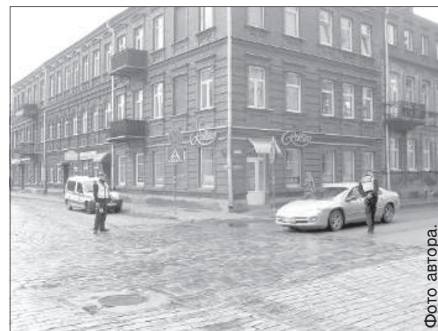
Полиция самоуправления следит за движением на улице Лачплеша.