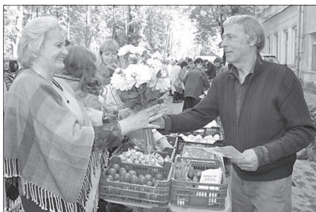
Фото думы Даугавпилсского края.