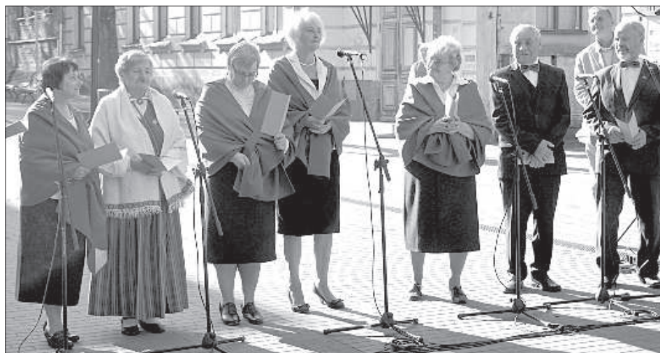
Творческий коллектив из Науене «Dzejpurs».