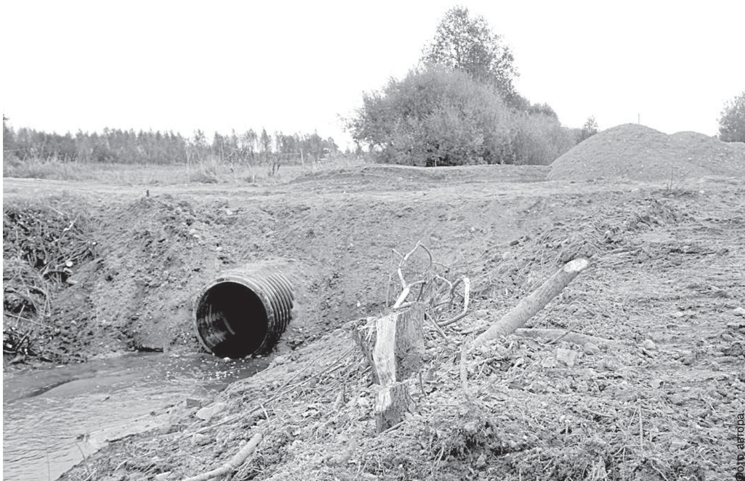
Работы у реки Вейжалки Науенской волости почти закончены – труба заменена.