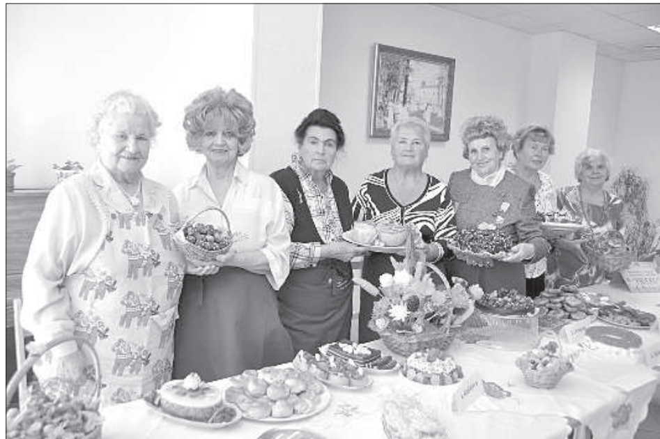
Участницы клуба «Умелые хозяйки» приготовили праздничные блюда.

Двухэтажное здание на улице Лиепаяс в Даугавпилсе с вывеской «Дневной центр социального обслуживания и реабилитации «Saskarsme» – словно улей, поскольку сенiores и люди с инвалидностью, занимаясь в различных кружках, рисуют, поют, пекут пироги, играют в шахматы и шашки, занимаются гимнастикой, посещают библиотеку, плетут из лозы, занимаются спортом, отмечают дни рождения и танцуют. В конце сентября целую неделю они все это показывали на мероприятиях, посвященных 15-летию центра «Saskarsme».