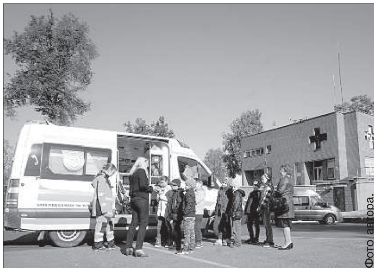
В машине «скорой помощи» поместились все дети.