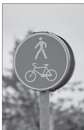
Общая протяженность всех велодорожек Даугавпилса составляет 17,5 км.

бы добраться до работы (3-5 км), однако, если работа находится слишком далеко, то для этой цели пользуются легковыми авто или общественным