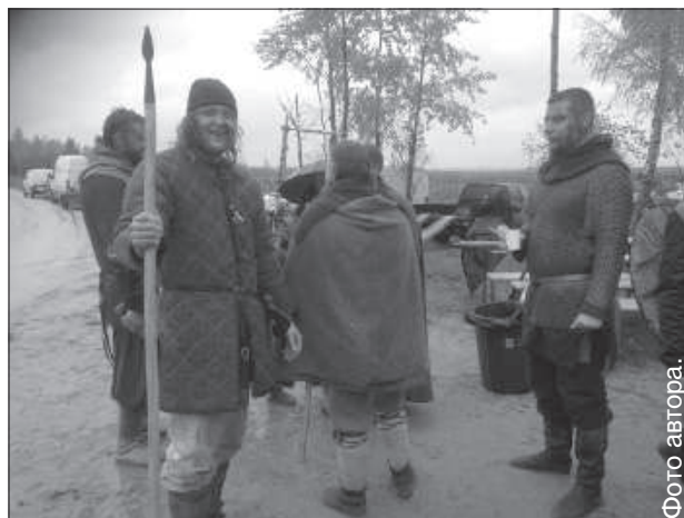
Съемки в лагере меченосцев.

конструкции из Латвии, Эстонии и Литвы. Для даугавпилсского клуба «Рубеж» это не первые съемки — еще в прошлом году они принимали участие в данном фильме.