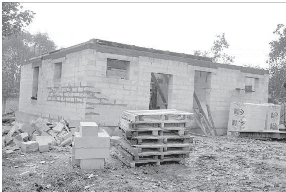
Несмотря на дождь, работы над строительством здания не останавливаются.