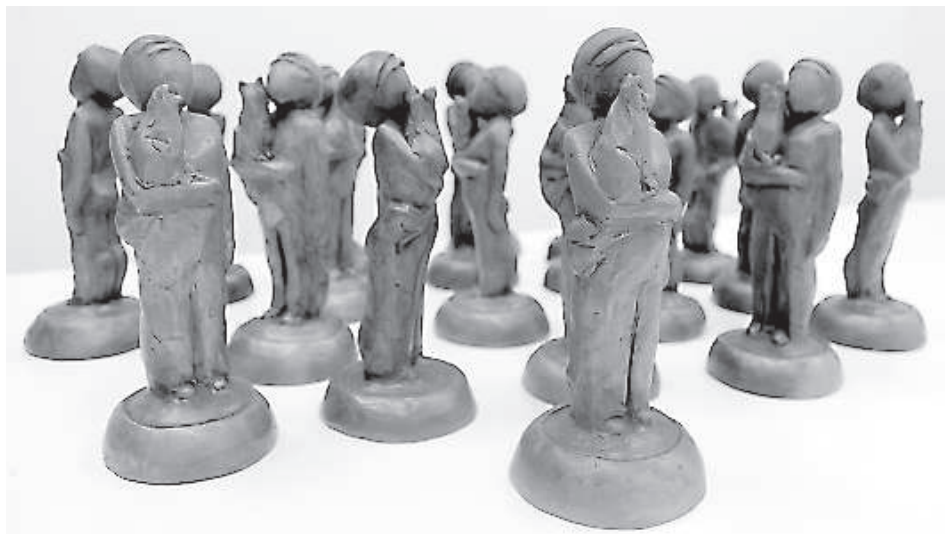
«Бонюкс» — глиняный мальчик с собачкой.