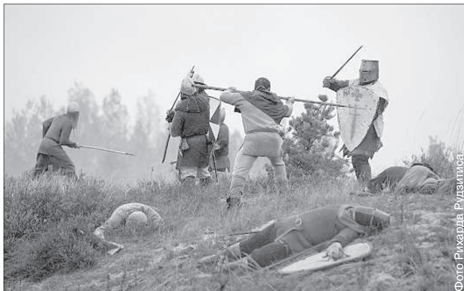
Клуб «Рубеж» на съемках (до гримирования).

8 октября на Адажском полигоне собралось более сотни человек. Здесь режиссеры запланировали снять главную битву фильма. Участникам съемок нужно было не только переодеться в костюмы, но и наложить грим. Гримирование главных действующих персонажей занимало достаточно много времени, а для тех, кто снимался в массовке, хватало 2-3 минуты на человека. Среди участников были многие клубы исторической ре-