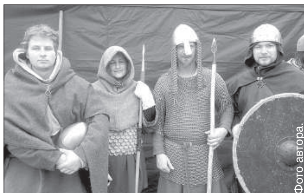
Съемки в лагере меченосцев.