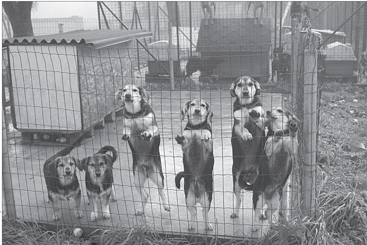
Сначала их было восемь, для двоих нашелся дом.